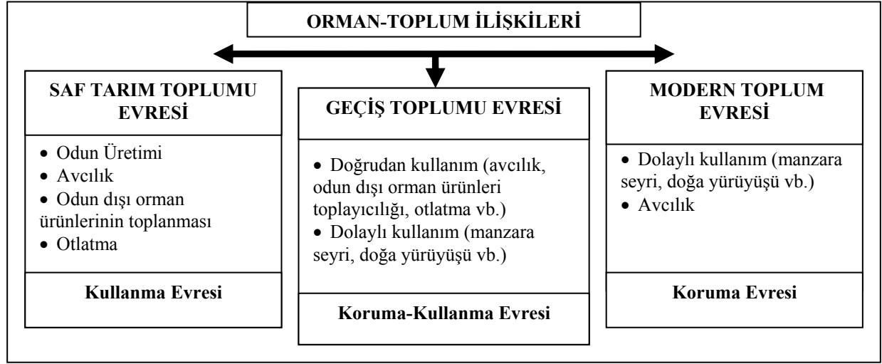
Şekil 3: Polonezköy’de Orman-Toplum İlişkilerinin Gelişim