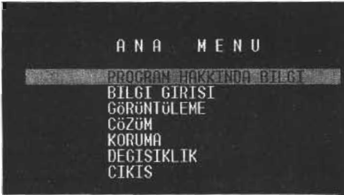
Şekil 1. ATADP 'nin QBASIC 'deki Açılış Penceresi

ATADP programı Doğrusal Programlama Problemlerini Revised Simpleks Algoritma kullanarak çözen, tarafımızca geliştirilen bir programdır. Program, ilk olarak QBASIC ortamında geliştirilmiş (Şekil 1.), daha sonra grafik arayüzüne (GUI) ve olaya bağımlı bir yapıya sahip olan (Microsoft Press, 1998) Visual Basic'e aktarılmıştır. ATADP Visual Basic Projesi (ATADP.vbp), Atadp.frm, ondeg.frm, gridform.frm, forcoz.frm, frmAbout.frm, frmSplash.frm, frmtip.frm bağımsız formlarından ve degisken.bas modülünden oluşmaktadır.