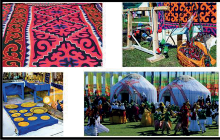
Görsel 7. Kırgız Göçebe sanatının günlük hayata yansımaları.

Orta Asya'da göçebe sanatını ve kültürünü devam ettiren diğer bir topluluk da Kırgızlardır. Göçebe yaşam tarzını, kültürel kimliğini ve manevi değerlerini ve inançlarını günümüzde de yansıtan Kırgızlar, oldukça zengin bir sanat geleneğine sahiptirler. Günümüzde de göçebe kültürünü koruyan Kırgız sanatı; tekstil, mücevher, metal işleri ile ahşap süslemeleriyle adından söz ettirmektedir.