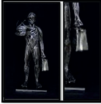
Görsel 15. Ufuk Güneş TAŞKIN, 'Göçebe" 2021, metal heykel, 64 x 22 x 17 cm. https://www.sanatabiyer.com/is-detay/21305/gocebe

Göçebe bir yaşam süren toplulukların günümüze dek gelebilen sanat eserleri, genel olarak ortak bir kültürü yansıtmaktadır. Bu kültür varlıkları pratik, kullanışlı ve kolay taşınabilir özellikleri sahip olup, göçebe sanatını yerleşik kültür sanatından daha üstün kıldığı söylenebilir. Üstün teknik ve malzeme hâkimiyeti, estetik değerlerin kullanışlılık özelliğiyle harmanlanması, doğadan edinilen tecrübe, tarihsel bilgi birikimi süsleme zenginliği sağlamaktadır. Göçebe kültüründe süslemelerin amacı estetik görünüm kazandırmasının yanı sıra, asıl olarak arka planda önemli bilgiler vermek ve anlamlar yüklemektir.