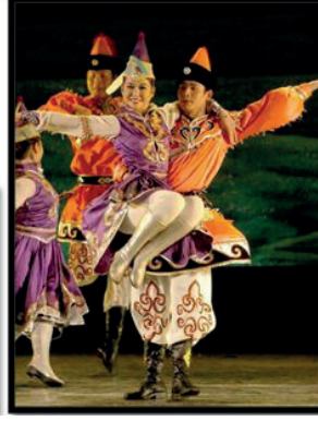
Görsel 13. Moğolistan Gösteri Sanatları: Göçebe Kültürün Hazinesi, 2007, (Fotoğraf, Bayin) ( http://www.chinadaily.com.cn/m/innermongolia/201401/27/content_17260300.htm )