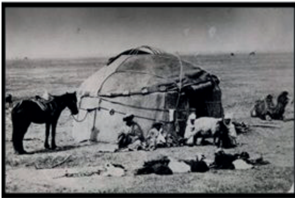
Görsel 1. Orta Asya göçebe hayatından kesitler.

https://www.loc.gov/rr/amed/guide/nes-centralasia.html