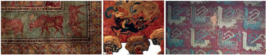
Görsel 5. Orta Asya göçebelerinin kullandıkları hayvan motifleri

Objelerde kullandıkları imgelerin sadeleştirilip stilize edilmesinin, göçebelerin kullandığı sanat tekniklerinden birisi olduğu düşünülmektedir. Ayrıca, renkli keçelerin birbirine eklenmesinde, halıcılıkta, tahta veya maden sanatlarında ise, motifleri basitleştirdikleri de görülmektedir (Görsel 5).