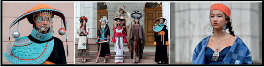
Görsel 12. Dünya Göçebe Moda Festivali. 2023.

Orta Asya Göçebe sanatının günümüze yansımalarından bir diğeri olan, Ağustos 2023 te sergilenen “Kırgız Göçebe Defilesi”, antik ve modern tasarımları birleştirmeyi amaçlamıştır (Görsel 12). Gösterişli Dünya Göçebe Moda Festivali’nin dördüncüsü olan bu etkinlik, Kırgızistan’da yapılmıştır. Defilede Kırgızistan’ın antik göçebe kültürüyle modern yansımalar kusursuz bir şekilde birleştirmeye çalışılmıştır. Kullanılan renkler, tasarımlarda gözlenen detaylar ve süsleme unsurları açısından ele alındığında göçebe kültürünün günümüze uyarlanmış şekli görülmektedir. Birçok uluslararası tasarımcının yer aldığı Dünya Göçebe Moda Festivali, Orta Asya’da göçebe medeniyetinin sesi duyuran ilk ve tek proje özelliğini kazanmıştır. Aynı zamanda Kırgızistan’ın moda endüstrisine de yön verdiği ve yol gösterdiği söylenebilir.