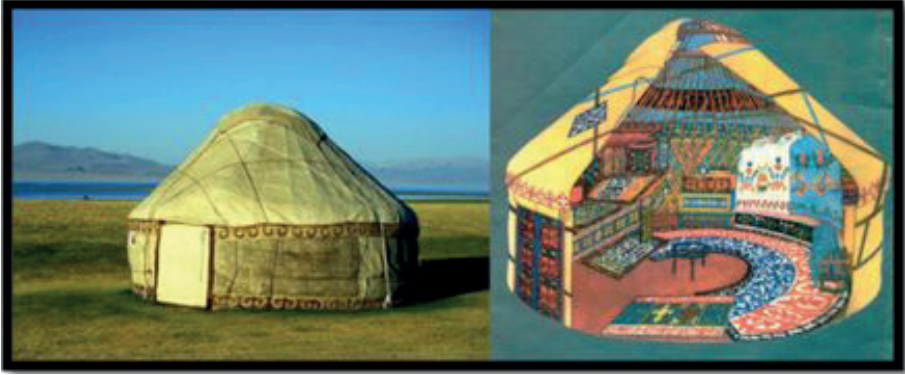
Görsel 2. Orta Asya göçebe çadırları ve iç mekân tasarımları

Göçebe hayatın gereksinimlerinden dolayı, iç mekân tasarımında oldukça hafif, taşınması kolay ve basit eşyalar üretme zorunluluğu, kültürel anlamda birbirine çok benzeyen göçebe toplulukların işlevsellik açısından temelde benzer ürünler ortaya çıkarmalarına neden olmuştur. Özellikle mezarlardan elde edilen bulgular bunu doğrular niteliktedir. Çadırlarını keçe, deri ve hayvan postlarından yaptıkları, iç mekân döşemelerinde ise dokumalı süslemeler kullandıkları görülmektedir. Çadır yaşamında günlük, pratik, kolay taşınabilen ürünlerin tercih edildiği örneklerden anlaşılmaktadır (Görsel 2) (Kuban, 1993: 56).