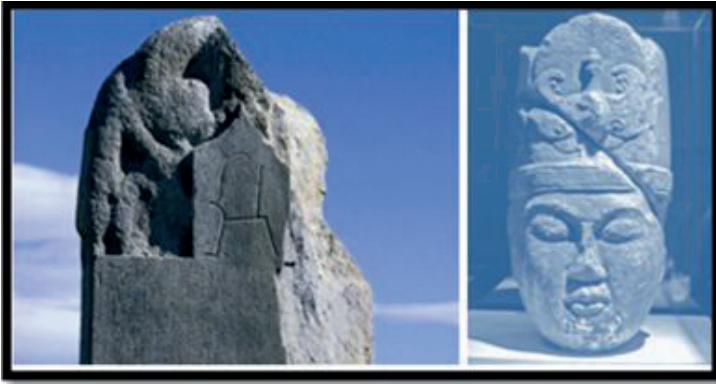
Görsel 4. Orta Asya'da Kültigin Abidesi'ndeki kağanlık damgası olan dağ keçisi motifini http://www.turkbilimi.com/p-15999-wordpress/

Hayatları savaş ve avcılıkla geçen göçebe sanatkârlar; inançları gereği kullandıkları totem niteliğindeki hayvan figürleri, at, keçi ve kuş gibi motifleri sıklıkla kullanmışlardır. Bazen, hayvansal motifler mitolojik şekilde tasvir edilirken, bazen de motiflerin, boy veya şahıs damgası olarak kullanıldıkları görülmektedir (Taşağıl, 2013: 343). Örneğin; M.Ö. 8. yüzyılda kullanılmış olan dağ keçisi motifinin Göktürk Kağan Sülâlesi'nin damgası olduğu (Görsel 4) Türk mitolojisinde de önemli bir yeri olan kuş motifinin ise Göktürk Kağan soyunun kuvvet ve kudret simgesi, Gök Tanrı'nın sembolü olarak ifade edildiği düşünülmektedir (Aral, 2012: 29) (Çoruhlu, 2000: 116).