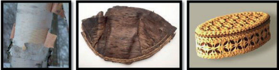
Görsel 8. İç Moğol Bölgesine ait huş ağacından yapılmış ürünler

Günümüzde Orta Asya'nın çeşitli bölgelerimde yaşayan göçebe etnik gruplar bulunmaktadır. Bunlar kendi coğrafi özelliklerine has malzemelerden, taşınabilir, günlük, kolay kullanılabilen, hafif eşyalar üretmektedirler. İç Moğolistan Bölgesi'nde; sağlam ve su geçirmezlik özelliğine sahip huş ağacı kabuğu buna örnek verilebilir (Görsel 8). Huş ağacı kabuğundan; kutular, kâseler ve sepetlerin yanı sıra süs eşyaları, kap-kacak gibi ürünler yaptıkları bilinmektedir ( http://www.chinadaily.com.cn/m/innermongolia/folkarts.html ). Kullanılabilir hale gelebilmesi için öncelikle huş ağacının kabuğunu soyup kaynatılmakta, daha sonra kesme, dikme gibi şekillendirme işlemleri yapılarak üzeri geleneksel desenlerle süslenmektedir.