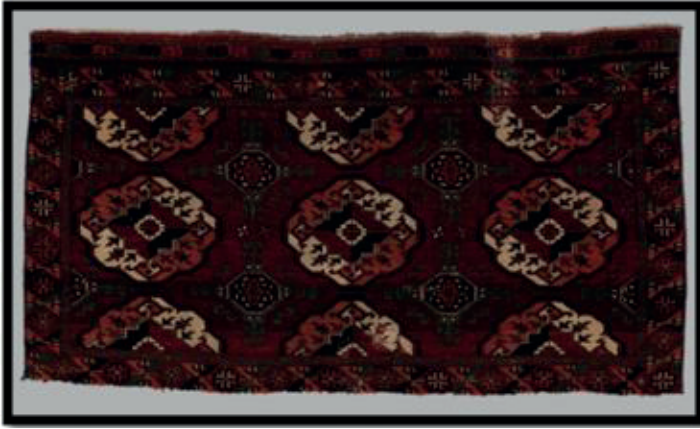
Görsel 6. 18.-19. Yüzyıl Orta Asya saklama çantası

rilmiştir. Bu anlayış, çadır içerisinde kullanılan halı, kilim, keçe, sergi, döşek ve dokumalara da yansıtılmıştır. Kadınların çeşitli nakış desenleri ile işlediği dokumalar da bu estetik anlayışın örneğini teşkil etmektedir. Orta Asya sanatının göçebe yaşamı yansıtan biçimleri, günlük kullanım eşyalarının yaşamlarında oynadığı işlevsel ve sembolik rolü ifade etmektedir. Örneğin; 18.-19. yüzyılın başlarına ait saklama çantasının ön yüzündeki motifler Orta Asya sanatını yansıtmaktadır (Görsel 6) ( https://www.metmuseum.org/learn/educators/lesson-plans/the-nomads-of-central-asia ).