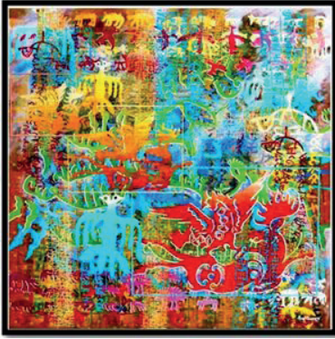
Görsel 17. Rauf Tuncer, Gelenekten Çağdaş resim sergisi, Tuval üzerine akrilik, 130cmx130cm, 2013. ( https://www.zeytinburnukultursanat.com/media/brochures/10_GELENE%C4%9EE_%C3%87A%C4%9EDA%C5%9E_YORUMLAR_-_RAUF_TUNCER.pdf )

Orta Asya göçebe kültür geleneğini günümüzde de sürdüren bu kültürel mirası, modern sanat anlayışıyla birleştiren diğer bir sanatçı Rauf Tuncer'dir. Sanatçı eserlerinde kendine özgü yorumlarıyla dikkat çekmektedir (Görsel 17). Evrenselliğin enerjisini yerellikten, geleceğin gücünü ise, geçmişten aldığı ifade eden sanatçı, tarihsel simgeleri, mitolojik betimlemelerle birleştirerek tuval üzerine akrilik boyalarla yaptığı çok renkli ve büyük boyutlu eserlerine yansıtılmaktadır ( https://www.zeytinburnukultursanat.com/media/brochures/10_GELENE%C4%9EE_%C3%87A%C4%9EDA%C5%9E_YORUMLAR_-_RAUF_TUNCER.pdf ).