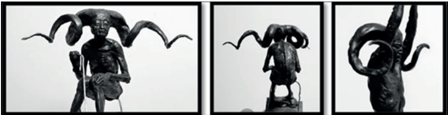
Görsel 11. Dorjderem Davaa. Devam Eden Çalışma. 2005.

Sanatçı bu malzemelerdeki karakteristik şekiller, doğal doku ve esnekliğin tüm imkânlarından faydalanmaktadır. Eserlerinde kullandığı malzemelerin yanı sıra yansıttığı ifadelerde de doğadan izlere rastlanmaktadır. Görsel 11'de yer alan insan figürünün başındaki hayvan boynuzlarını anımsatan detaylar, doğa ve çevre ile kurulan bağlantının göstergesi niteliğindedir ( https://vanessadesmet.wordpress.com/dorjderem-davaa/ ).