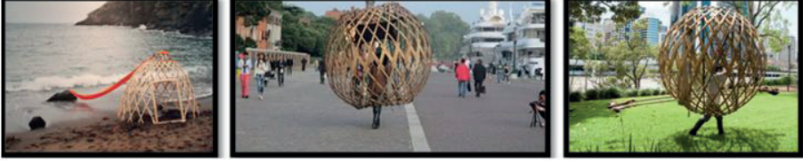
Görsel 7. Enkhbold Togmidshiiev. Moğol göçebe çadırı ger ile performans sanatı.

Moğolistan'ın donmuş bozkırlarında, çölde, deniz kenarında, otoyol kenarında, dünyanın farklı coğrafyalarında sokak ve meydanlarda gerçekleştirilmiştir.