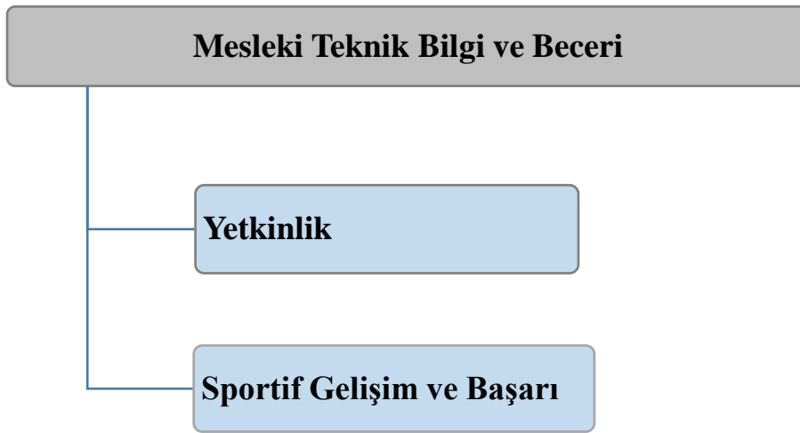
Şekil 3. Katılımcı görüşlerine göre ortaya çıkan mesleki teknik bilgi ve beceri temasına ilişkin bulgular

K7: “İş disiplini. Çünkü kendimden taviz vermeden doğrularımı son güne kadar devam ettirebilirim”.