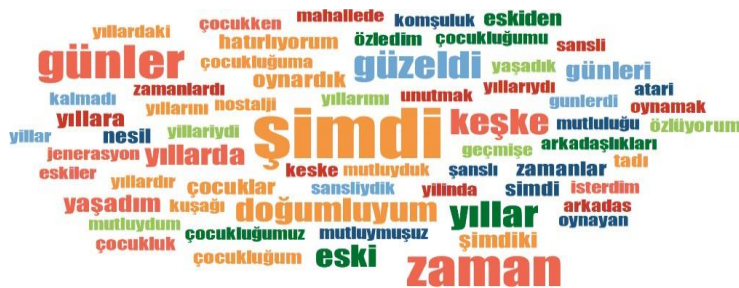
Şekil 1. Kullanıcıların Verdiği Yanıtlara Göre Çıkarılan Kelime Bulutu 4

YouTube yorumlarının analizi kendi içerisinde bir tipoloji oluşturmaktadır. Analiz kapsamında öncelikle YouTube videosu ve videoya gelen yorumlara ön inceleme yapılmıştır. Kullanıcı üretimine dayalı olarak video altına girilen yorumların meydana getirdiği kolektiflik etkisini içerecek alan notları alınmıştır. Buna bağlı olarak araştırmanın birinci aşamasında ön inceleme ve alınan notlar paralelinde, öncelikle yorumlarda geçen kelimelerin yoğunluğuna bağlı olarak Şekil 1'de görüldüğü üzere kelime bulutu oluşturulmuştur. Oluşturulan kelime bulutuna göre, videoyu deneyimleyen kullanıcıların anlamlandırma şekilleri belirlenmeye çalışılarak kategoriler oluşturulmuştur.