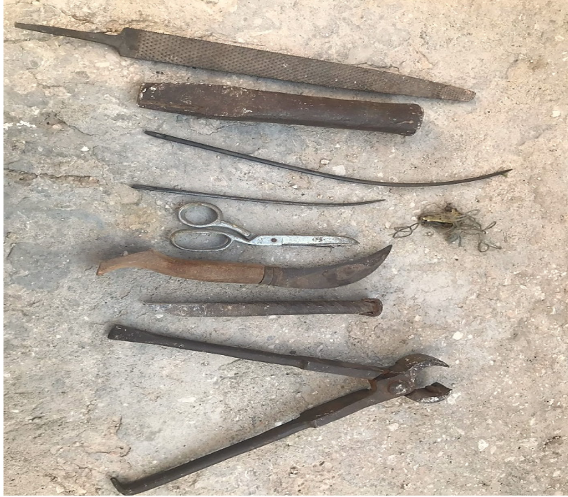
Resim 13: Semercilikte Kullanılan Madde ve Aletler

Semercilikte Kullanılan Madde ve Aletler (Kaynak kişinin belirttiği): Çul, saman, kamaş, meşin, teliz veya çuval, deri veya kaput bezi, tahta, çuvaldız, eye veya törpü, kerpeten, çekiç veya tokmak, kendir ve sicim, testere, şiş, keser, satyan, saz, keçe.