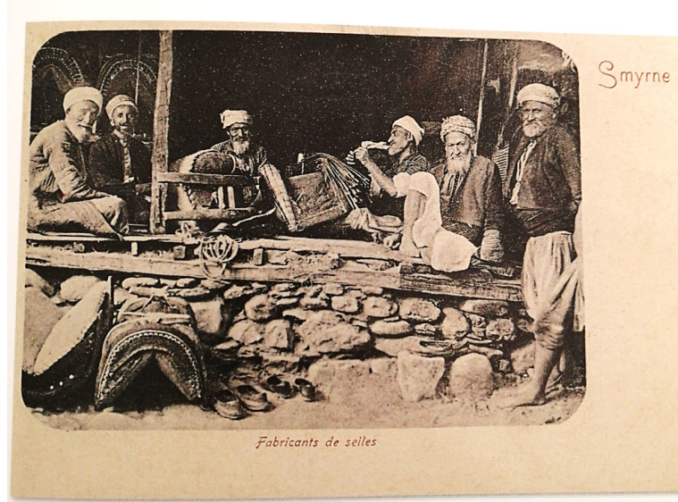
Resim 1: İzmir’de Semerciler 37

Semerciler, kent merkezindeki çarşıların yanı sıra saraçhanelerin yanı başında, yolcuların konaklamasına mahsus hanların yanında, kervansarayların yakınında mesleklerini icra etmişlerdir. Bu alanlarda bazen eskiyen semerleri tamir etmişler bazen de yenisiyle değiştirmişlerdir. 36