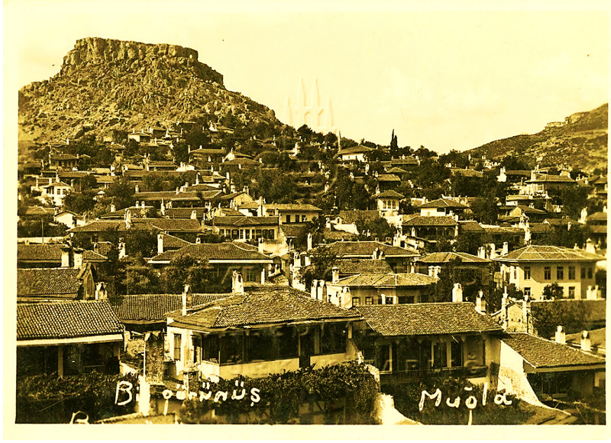
Resim 4: Muğla Kasabası 55

Çelebi Mehmed (1413-1421)'in ölümü üzerine tahta geçen II. Murad (1421-1451), 1424 yılında Menteşe Beyliği'ne son vermiş ve beylik topraklarını Osmanlı sınırlarına dâhil etmiştir. 56 Klasik Osmanlı mahallelerinde olduğu gibi Muğla mahallelerinde de camii, mescit, tekke, zaviye gibi dini yapılar yer almıştır. Nitekim Camii-i Kebir Mahallesi, Muğla'nın en eski mahallesi olup bugün Ulu Camii olarak bilinen caminin etrafında teşekkül etmiştir. Zira Hacı Rüstem, Muslihiddin, Şeyh Bedreddin ve Kiramüddin mahalleleri de aynı adlı kişiler tarafından yaptırılan veya adlarına yapılan mescitler etrafında vücut bulmuştur. Ahmed Hoca, Bâli Hoca, Emir Küçük, Hacı Bayezid ve Kara Memi mahalleleri ise isimlerini şahıslardan almıştır. 57