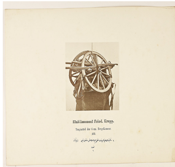
Resim 3: 6 Santimetrelik Dağ Topunun Nakli İçin Semer Takımı ve Nakliye Tertibi 42