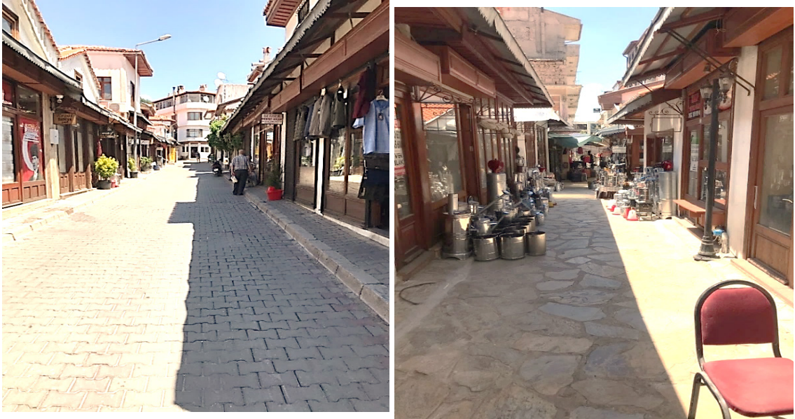
Resim 6: Muğla Arasta Çarşısı 65

Muğla'nın tarihî ve kültürel dokusunu yansıtan Arasta Çarşısı, kervan yolu üzerinde kuzey-güney, doğu-batı akslarının kesiştiği noktada yer almaktadır. Arasta içerisinde ayakkabıcılar, berberler, nalburlar, esnaf lokantaları gibi dükkânların bulunduğu toplamda 134 adet işletme yer almaktadır. Arasta'nın kuzey yönünde bulunan Tabakhane, kent yapısı için önemli bir ticaret noktasıdır. Arasta Çarşısı'nın merkezinde, merkez bölgesine de adını veren şadırvan bulunmaktadır. Arasta Çarşısı içerisinde ayrıca Şeyh Cami, bir diğer merkez noktasında eski çınar ve çınarın sembolü Şemsi Ana Çeşmesi, Saat Kulesi yer almaktadır. 64