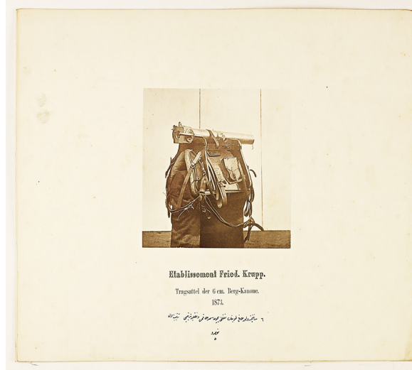
Resim 2: 6 Santimetrelik Dağ Topunun Nakli İçin Semer Takımı ve Nakliye Tertibi 41

Osmanlı Devleti'nde cephaneden gönderilen barut varilleri ve fişek sandıkları üzerine keçe ve meşin sarmak üzere semercilerin istihdam olunduğu görülmektedir. Nitekim 9 Mart 1804 tarihinde bu şekilde istihdam olunan semercilerin ücretleri olan 458,5 kuruşun ödenmesi istenmiştir. 38 Yine, İstanbul Baruthanesinde istihdam olunan semercilerin sekizer kuruş yevmiye aldıkları, fakat bunun yeterli gelmediği nezaret tarafından bildirilmiş, yevmiyelerine ikişer kuruş zam yapılarak onar kuruş yevmiyeye çıkarılması hususu Meclis-i Vâlâ'da da görüşülerek Sadarete sunulmuştur. 39 En nihayetinde ilgili durum uygun bulunarak kabul edilmiştir. 40