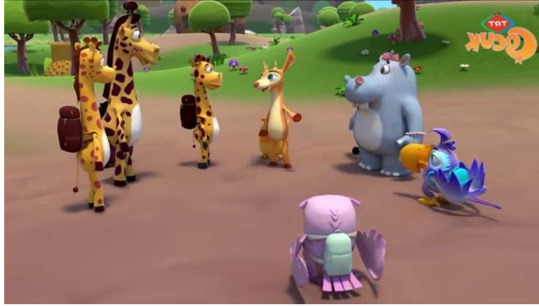
Şekil 3. Şarkılı Orman Sakinleri Nereye Gidiyor/ 3. 26. dakika

kalmasından dolayı üzüntü duyması üzerine arkadaşlarının Kiki'nin yanında olması (Kiki Model Arıyor/7.48. dakika) dostluk değerine değinilen noktalardır.