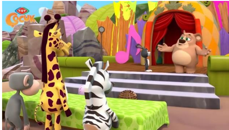
Şekil 2. Armut Şenliği/ 3.33. dakika

TDK'ye göre adalet kavramı hak ve hukuku gözetme, herkesin hakkını doğru şekilde vermek anlamına gelmektedir. Çocuklarda adalet değerinin verilmesi sağlıklı ve mutlu bir yetişkinlik hayatı geçirebilmeleri için önemli bir konudur. “Akıllı Tavşan Momo” isimli çizgi filmde adalet değerine bir kez ‘Armut Şenliği’ isimli bölümde yer verilmiştir. Çizgi filmde armut şenliği için bir lider seçmeleri gerekiyordu ve Şekil 2’deki sahnede oy birliği ile Bombom’u lider seçtiler.