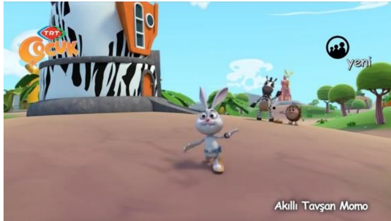
Şekil 4. Tako'nun Dişleri/ 5.50. dakika