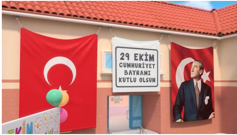
Şekil 7. Cumhuriyet Bayramı/ 11.21. dakika