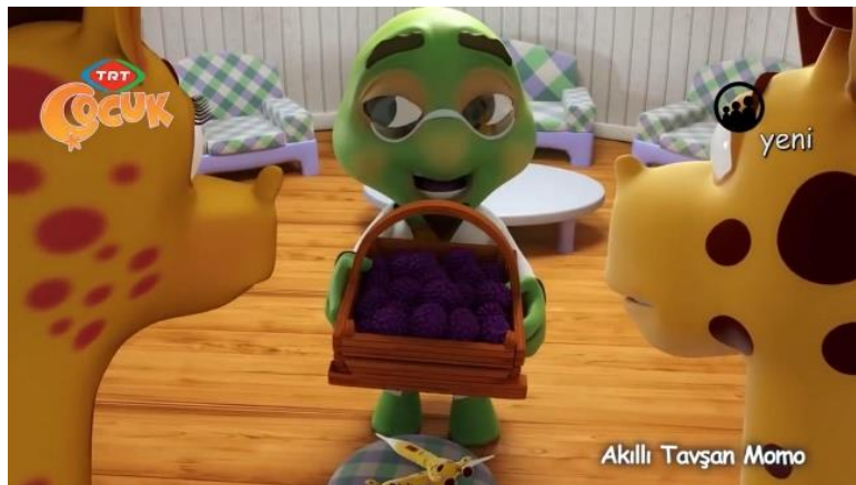
Şekil 5. Şıp ve Tıp Nerede? / 8.52. dakika