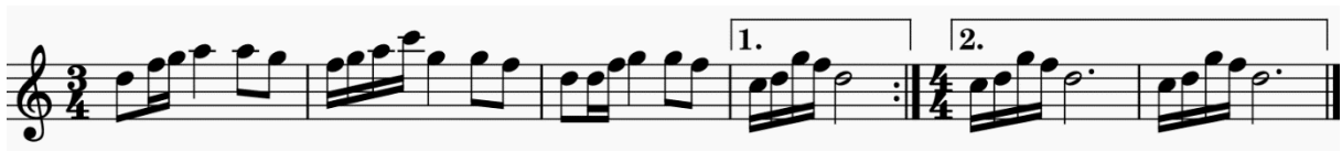
Görsel 2. Kongar-ool Ondar'ın icrasından transkript edilen Kongur-ei isimli eser.

2. Eserler genel olarak birbirini tekrar eden yapıdadırlar. (Görsel 2).