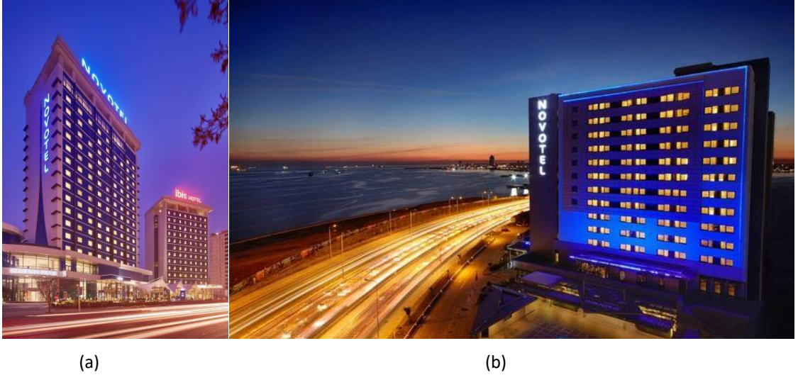
Şekil 4. Konya Novotel (a) ve İstanbul Zeytinburnu Novotel (b) (Kaynak: Kültür Portalı, 2021).