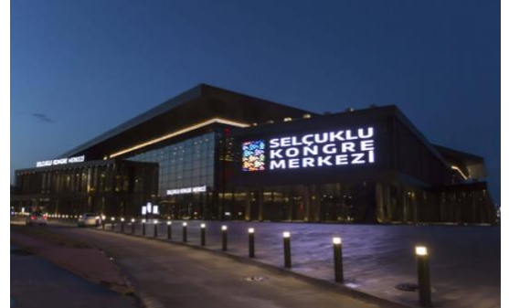
Şekil 10. Konya Selçuklu Kongre Merkezi.