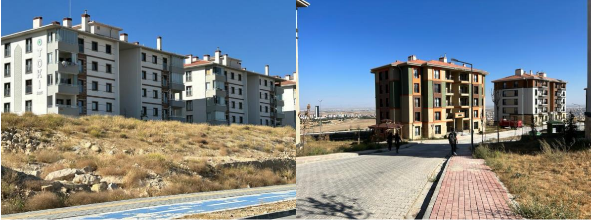
Şekil 2. Konya ili Ardıçlı Mahallesi TOKİ yapıları (Kaynak: Kişisel arşiv, 2023).

Tek tipleşmeye örnek olarak Konya'nın Selçuklu ilçesinin Ardıçlı mahallesinde ve Beyşehir ilçesinin Huğlu köyünde bulunan TOKİ konutları gösterilebilir. Huğlu köyü kendi içinde yerel özelliklere sahip ve köy dokusunun olduğu dar, küçük ve engebeli sokaklar etrafında iklime uygun taş yapı malzemesi ile üretilen konut tipolojisine sahiptir. Ancak günümüzde küreselleşmenin etkisiyle seri üretimi hızlandıran, sermayenin örgütlediği TOKİ konutlarını burada görmek mümkündür. Aynı tipte konut alanları, Konya kenti Selçuklu ilçesi Ardıçlı mahallesinde de görülmektedir (Şekil 2 ve Şekil 3).