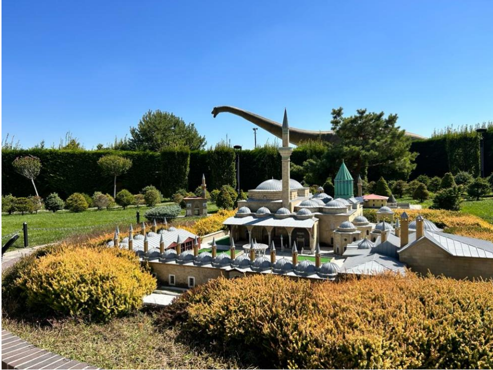
Şekil 6. Konya 80 Binde Devri Âlem Parkı.