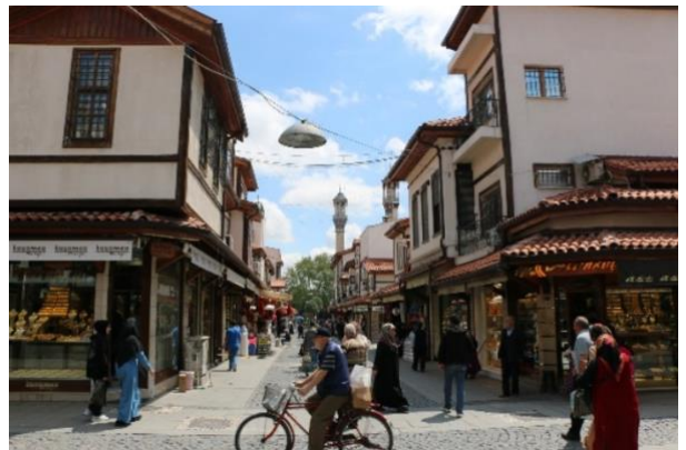
Şekil 8. Konya Bedesten Çarşısı (Kaynak: Kişisel arşiv, 2023).