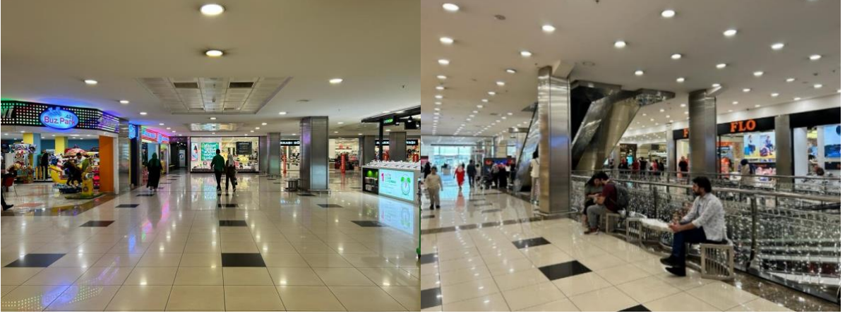
Şekil 9. Konya Kule Site AVM.

Konya Selçuklu Kongre Merkezi ve Japonya'da Arata Isozaki ve Anish Kapoor tarafından tasarlanan Ark Nova konser salonu, yersizleşme kavramı çerçevesinde ele alındığında, Ark Nova'nın yer ile fiziksel bağlarının koparıldığı görülmektedir. Mimaride prefabrik yapı üretimi olarak adlandırılan yapım türü, bir yerde üretilen ürünün sökölüp takılarak farklı bölgelerde yer ile bağ kurmadan yeniden üretilmesine olanak vermektedir. Böylece üretilen mekânlar yerel özelliklere ve kültürel kimliğe bağlı kalmadan birbiri ile aynı nitelikte olmaya başlamaktadır. Bu durum, kentlerde üretilen mekânların yersizleşmesine neden olmaktadır. Ark Nova konser salonunun coğrafyaya, kültüre, yere ve mekâna bağlı olmadan üretilmesi, yersizleşme örneği olarak ele alınmaktadır. Herhangi bir coğrafya ve kültürle bağlamsal ilişkisi olmayan yersiz bir mekân olarak da görülebilir (Şekil 10 ve Şekil 11).