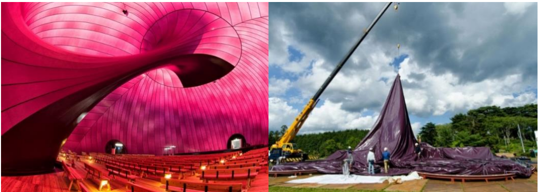
Şekil 11. Arata Isozaki ve Anish Kapoor, Ark Nova, Japonya (Kaynak: Deezen, 2022).