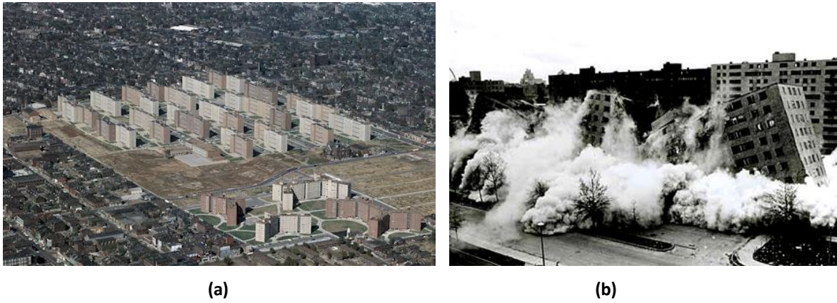
Şekil 1. Pruitt-Igoe Konutları.

Bu kapsamda 1955 yılında modern kent plancılarının kabul ettiği yüksek katlı yeni yerleşim birimleri inşa edilmiştir. Bu dönemin öne çıkan yapısı Pruitt-Igoe toplu konutları olmuştur. Yüksek katlı, modern kent kurgusuna sahip olduğu düşünülerek inşa edilen toplu konutlar, zamanla yaşam koşullarının kötüye gittiği, suç oranlarının arttığı, güvenlik sorunlarının yaşandığı ve ırkçılığın arttığı bir yer haline gelmiştir. Bu nedenle 17 yılın sonunda dinamitlenerek yok edilmiştir (Şekil 1). Bu durum, modern mimarlığın bittiğinin ve yeni bir döneme doğru ilerlendiğinin göstergesi olmuştur (Harvey, 1997). Yaşanan bu gelişmelerden sonra modernizmin beraberinde getirdiği kent planlama anlayışı sorgulanmış ve kimliksiz çevre oluşumuna neden olduğu için eleştirilmiştir (Balamir, 2005). Modernizm etkisinde düzenlenen yapı çevrelerin işlevselliğinden çok insanların maddi ve manevi, içsel durumlarına etki edecek fiziksel çevrelerin yapılması gerekliliği vurgulanmıştır. 1968’de karşı kültürel hareketlerin başlaması ve eleştirilerin artmasıyla, sonraki yıllarda modernizm yerini postmodernizme bırakmıştır (Karakurt, 2006).