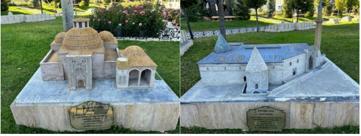
Şekil 5. Konya Ecdat Parkı (Kaynak: Kişisel arşiv, 2023).

Ecdat parkında Konya'nın kültürel değerlerinden Mevlâna Türbesi, Alaaddin Camii gibi Selçuklu mimari dönemine ait yapıların maketleri bulunmaktadır. Kültürel öneme sahip bu mimari değerler, park alanı içinde metalaştırılmakta, taklitleri minyatürleştirilerek aktarıldığından orijinalleri değersizleştirilmektedir (Korkmaz, 2021). Aynı şekilde, 80 Binde Devri Âlem Parkı'nda bulunan hem tarihi – kültürel geçmişe sahip yapıların hem günümüz çizgi film kahramanlarının hem de tarih öncesi devirlerde yaşayan dinozorların aynı park içinde bulunması, zaman karmaşasına neden olurken, ülkemizin her bir kentinin ayrı ayrı sahip olduğu kültürel değerleri bir anda sunmak, o değerleri metalaştırıp orijinallerini değersizleştirmektedir (Şekil 5 ve Şekil 6).