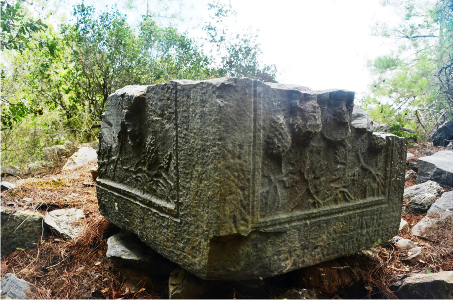
Fig. 4 Fiđla Tepesi: 4a: Fiđla Tepesi/Yapı kalıntısı 4b: Fiđla Tepesi/osthotek