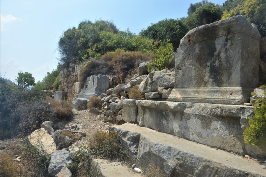
Fig. 8 Liman Caddesi-Yazıt Galerisi: 8a: Liman Caddesi/Yazıt Galerisi ve akropolis genel görünüm / 8b: Liman Caddesi ayrıntı