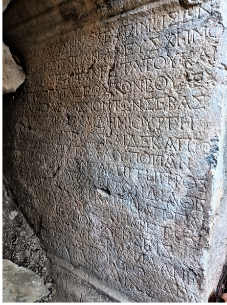
Fig. 2 Yazıt