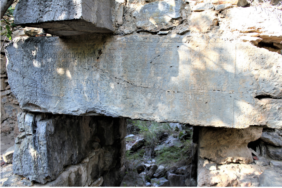
Fig. 5 Vali M. Pompeius Macrinus Yazıtı (İmparator Traianus'a bina ithafı)