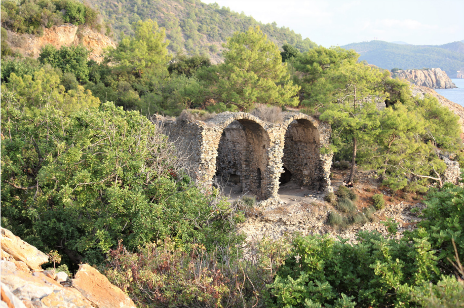
Fig. 6 Liman Hamamı