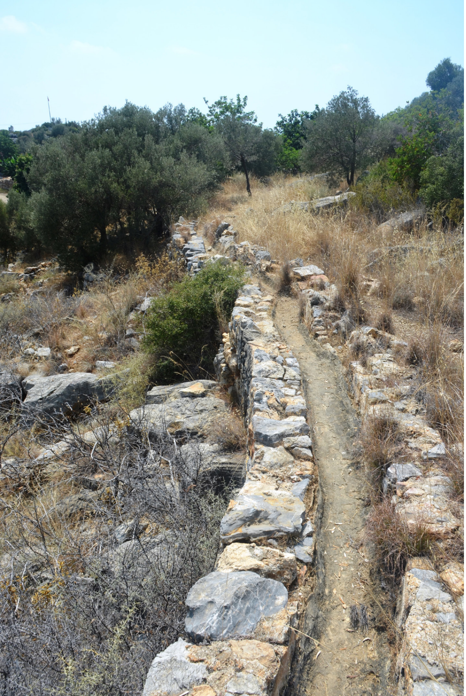
Fig. 7 Su Kanalı