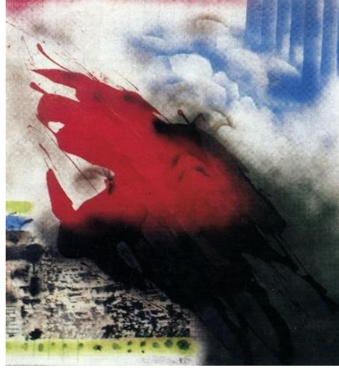
Görsel 2. Zahid Büyükişleyen, Çernobil'den Karadeniz'e 100x110 cm, Tuval Üzerine Yağlı Boya, 1988.

sıkıntılar, Hiroşima'ya kadar uzanan göndermeler, kavram ve soyut plastik görüntü onun resimlerinde uzun süre yer almıştır (Ateş, 2021, s. 21, 22). Sanatçının çevreci yaklaşım sergilediği çalışmalarında; renkler ve biçimler bir gerilimi, bir huzursuzluğu ortaya koymaktadır. İnsanın doğaya verdiği tahribatın önemli bir göstergesi olan “Çernobil'den Karadeniz'e” adlı eserinde aslında mesafelerin ne kadar kısaldığını bize göstermektedir (Görsel 2). Bunu o kadar belirgin bir biçimde vurgulamıştır ki parlak kırmızılar, siyahlar, sarılar ve maviler, insanı yutacakmış gibi bir his uyandırmaktadır. Etkilerini onlarca yıl devam ettirmiş olan bu çevresel problem, aslında sanatçının o günlerde yaşadığı dönemi yansıtan ilerici bir yaklaşım olarak algılanmalıdır. Dünyanın içine düştüğü küresel ısınma ve iklim değişikliğine neden olan nükleer patlamalar ve teknolojik atıklar her şeyi öylesine etkilemiştir ki insana ait değerler geri gelmeyecek şekilde değişime uğramıştır. Artık insan makineleşen ve doğaya aykırı, yıkıcı üretim çılgınlığının kıskaçı içerisinde dehşet verici bir söylemi kendi elleriyle oluşturmuştur. Büyükişleyen, tufandan önce yıkımın geldiğini ifade eden resimleriyle doğa, çevre ve insan ilişkisine dikkat çekerken aynı zamanda insan adına iç tedirginliğini de ortaya koymuştur (Aral, 2000, s. 120-124).