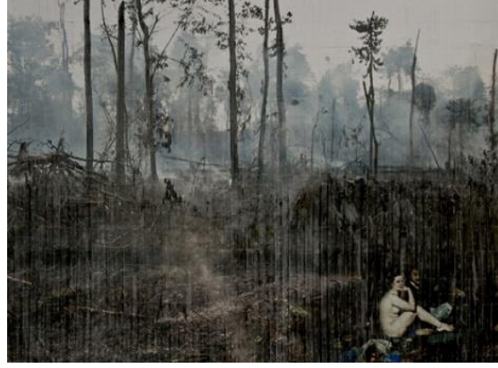
Görsel 4. Azade Köker, Piknik, 104x150 cm, Tuval Üzerine Karışık Teknik, 2011.