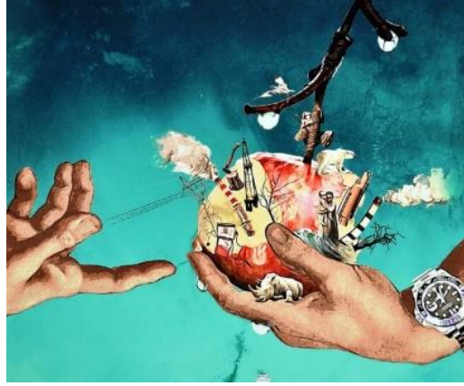
Görsel 3. Yasemin Sayıbaş Akyüz.