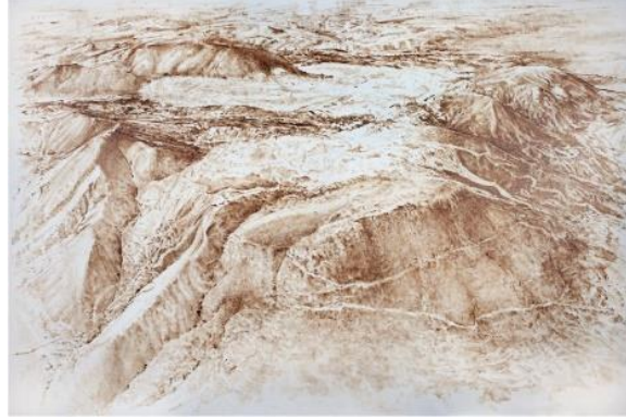
Görsel 6. Murat Akagündüz, İda-Soma, 200x300 cm, Tuval Üzerine Reçine, 2015. Nejat F. Eczacıbaşı Vakfı Koleksiyonu.