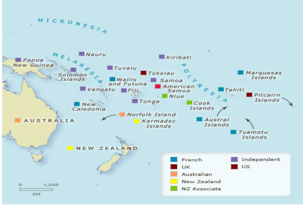
Görsel 1: Fransız Sömürgesi Adalar