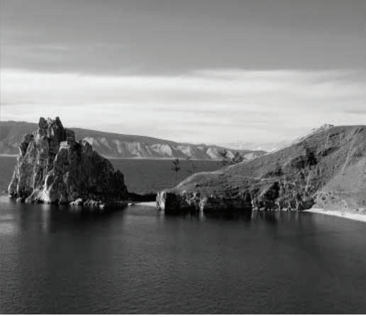
Resim 1: Şaman Kayası. Copyright Roberto Quijada (Erişim: 16 Şubat 2022)

khon Adası'nın küçük bir yarımadası olan kaya kütesinin içerisine oyulmuş mağarada yaşayan kadın şamanla ilgilidir. İnsanlar tarafından erişilmez bir noktada yaşıyor olduğundan kadın şaman burada barış ve esenlik içerisinde yaşar. Esasen bu kaya önemini ruhların yılda bir kez yaptığı mistik toplantıya ev sahipliği yapmasından alır. Ruhlar Şamanka'ya fizik üstü âlemden atlarıyla gelir. Ölümlülerin sorunlarıyla meşgul oldukları zaman ruhlar kayadan ayrılırken atlar kayada kalır. Bu efsane, son yıllara kadar oldukça güçlü şekilde kendini korumuştur. Öyle ki doğa üstü hususlarla alakalı oldukça hassas olmalarından dolayı kadınların bu kayaya tırmanmasına izin verilmemiştir. 29 Altay halklarının bir kısmına göre modern bir dini kült olan Burkhan'ın bu kayada yaşadığına inanılmaktadır. Tengri olarak da anılan Göksel tanrıların kendilerine ikamet olarak seçtiği saray olan bu kaya, Asya'nın en kutsal dokuz yerinden biri olarak düşünülmektedir. En güçlü tanrısal varlıkların burayı kendine ev olarak seçmesinden dolayı, onları kızdıracak şeylerden uzak durmak gerekir. Eski dönemlerde, insanlar bu tanrısal varlıkları rahatsız etmemek için onların yakınlarından atlarının nallarına bez bağlayarak geçmişlerdir. Burada