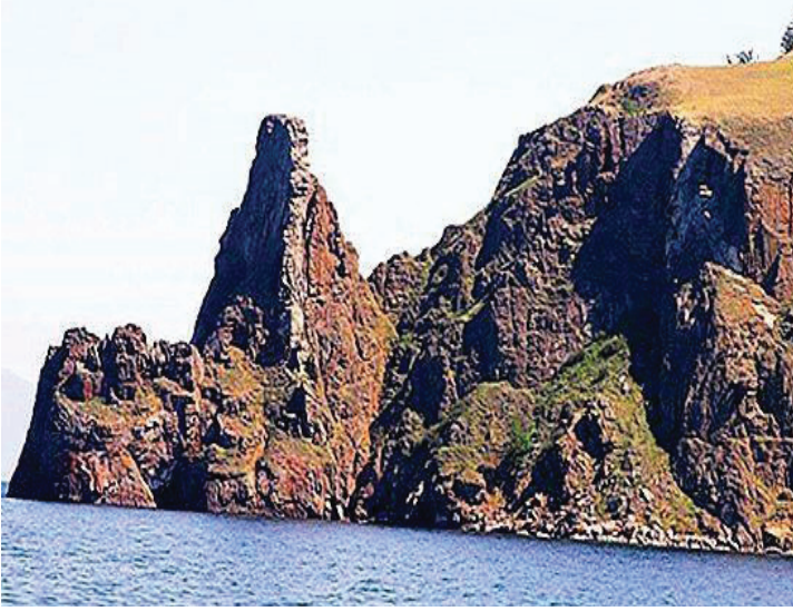
Resim 3: Khoboy Burnu. https://tr.public-welfare.com/4058485-interesting-facts-and-mysteries-of-baikal-history-and-sights (Erişim: 28 Şubat 2022)

Khoboy Burnu, Olkhon Adası'nın kuzeyindeki en uç noktada bulunmaktadır. İsmi Buryatça “diş” veya “azı dişi” anlamında kullanılan khoboy dan gelmektedir. 40 Gölden dışa doğru keskin bir dişe benzeyen sütun şeklindeki kaya, antik dönem kadırgaların önlerinde bulunan kadın şeklindeki büstlere benzetilmektedir. Bölge halkı tarafından bu kayaya genç kadın anlamındaki Deva adı verilmiştir. 41 Bir Buryat efsanesine göre bu kaya, Tengri tarafından kocasına verilen sarayı, aynısı kendisinde olmasına rağmen kıskançlıktan dolayı soyan kadının taşlaşması neticesinde oluştuğuna inanılır. Tengri: “Yeryüzünde kötülük ve kıskançlık sürdüğü müddetçe taş olarak kalacaksın.” demiş ve kadını taşlaştırmıştır. 42 Monolitik kaya, çok fazla sayıda yankı yapma özelliğiyle öne çıkmıştır. 43