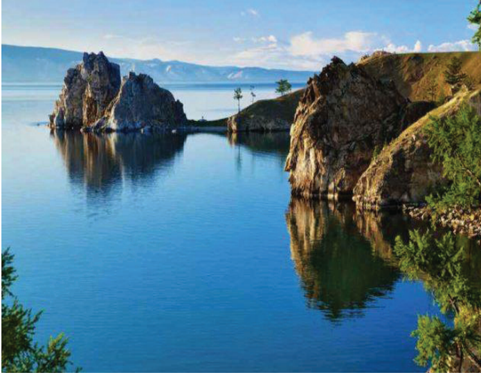
Resim 4: Bogatir Burnu https://amedeya.com/den-ozera-baykal/amp/ (Erişim:02 Mart 2022)

na gelen Ogneni 'dir. Bogatir ise savaşçı anlamına gelmektedir. 16. yüzyılın sonunda adaya gelen ilk Rus kaşifler önlerinde Baykal sularının aniden göğe doğru yükselerek ateşten bir duvara dönüştüğünü görür. Ateşten duvar yabancılar tarafından adanın kutsal topraklarına girilmesini engellemek için görünmüştür. Buryat şamanları tarafından Bogatir'de ateş, rüzgâr ve suyun elementel güçlerini çağırarak ayinler düzenlenmektedir. 20. yüzyılın ilk yirmi yılı boyunca bölgede yaşayan kabilelerin yaşlıları tarafından yeni doğmuş erkek bebeklerin burna getirildiği bilinmektedir. Onlar arasında burayı ziyaret eden bir çocuğun gelecekte lider veya savaşçı olacağı, özel manevi bir güç ve uzun ömür elde edeceğine ilişkin inanışlar bulunmaktadır. 44 Bahadır kelimesi, etimoloji itibariyle vurmak, kırmak, yere sermek devirmek anlamına gelen "bat-" kökünden türemiştir. Batır veya batur şeklindeki kullanımı da bulunan bahadır kelimesi; kahraman, yiğit, alp, güçlü, korkusuz gibi anlamlar taşımaktadır. 45 Eski Kıpçak Türkçesi'nde bahadır olarak geçen sözcüğe 13. yüzyılda yazılmış olan Codex Cumanicus 'ta da rastlanmaktadır. Erken dönem Türkçe ve Moğolca'da bagatur olarak geçen kelimenin hangi dilden diğerine geçtiği belirlenmemektedir. Slav dillerine geçen bu kelime [Rusça: Богатырь