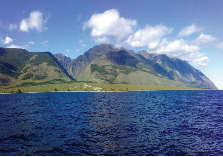
Resim 2: Riti Burnu.

Riti Burnu, Baykal'ın batı yakasında bulunmaktadır. Üzerinde hiçbir bitki örtüsü bulunmamakta ve burada kimse yaşamamaktadır. Bölgede çok sayıda kurumuş nehir yatağı bulunduğu ve kazılmış kanal görünümüne sahip olduğundan dolayı Rusça kazılmış anlamına gelen ritıy (Рытый)'dan geldiği düşünülmektedir. Yerliler ve turistler için gidilmesi zor bir yer olan Riti Burnu, herhangi bir yola sahip değildir. Buryatlar burayı lanetli bir yer olarak kabul etmektedir. Parlayan topraklar ve ışıkların görüldüğü bu bölge paranormal olaylara ev sahipliği yaparken kutsal bir yer olarak da kabul edilmektedir. 37 Riti Burnu, bilim adamları tarafından insanların öldüğü veya kaybolduğu, açıklanamayan olayların çeşitli teknoloji ve ekipmanlarla araştırıldığı gizemli bir yer olarak tarif edilmektedir. 1907 yılında Rus askerlerinin gölü geçmeye çalıştıkları esnada burna yaklaştıklarında kuvvetli bir fırtına çıktığı, teknelelerinin alabora olduğu, kiminin öldüğü, kiminin ise gölü geçmekten korkarak