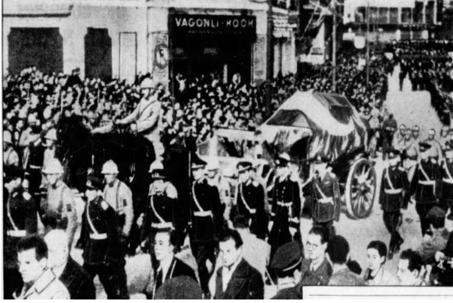
Ek – 8: Atatürk'ün cenazesi meclisten Etnografya Müzesine götürülürken ("Funeral procession" 1938: 15).