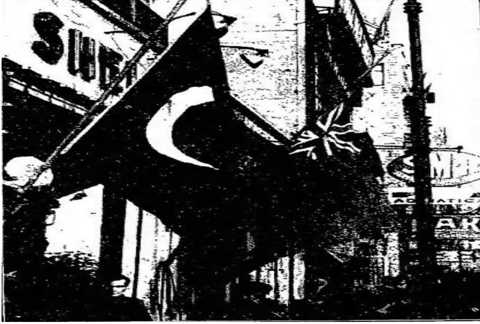
Ek – 6: Atatürk'ün anısına İstanbul'da yarıya indirilmiş olan bir bayrak ("Flags" 1938: 7).