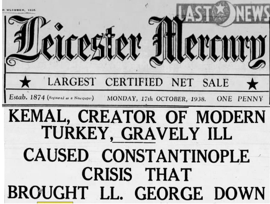
Ek – 1: Leicester Mercury'nin ilk sayfasında Atatürk'ün hastalığına ilişkin haberi ("Kemal, creator" 1938: 1).