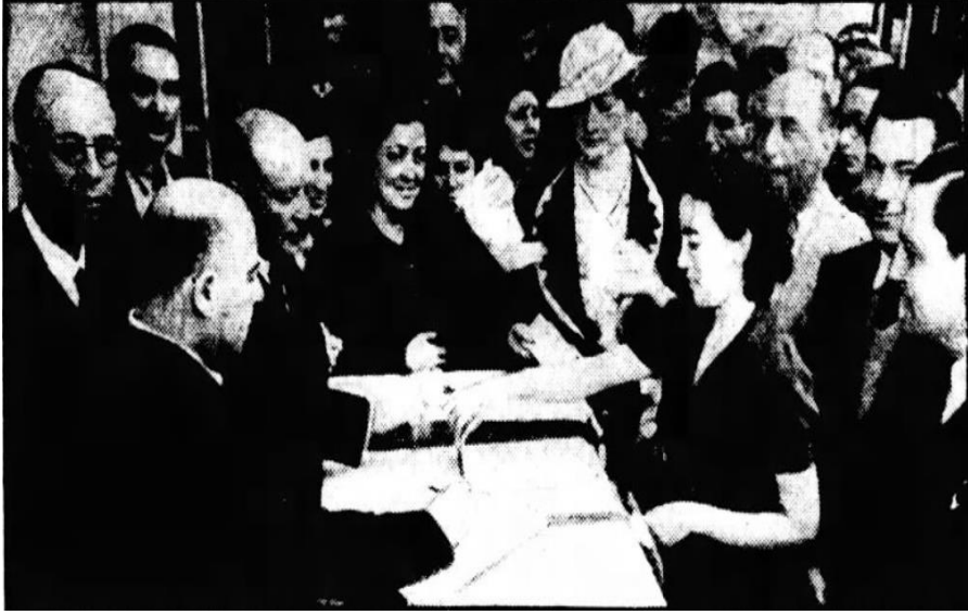
Ek – 3: Atatürk tarafından kendilerine seçme seçilme hakkı verildikten sonra ilk defa oy kullanan Türk kadınları ("Voting for the first time" 1938: 5).