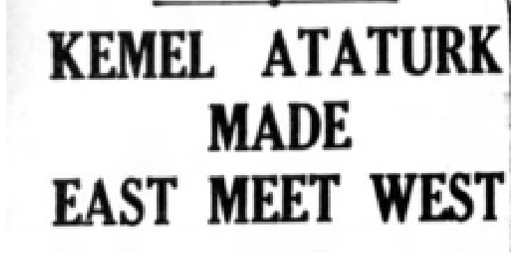
Ek – 4: Modern Türkiye'nin kurucusu öldü ("The creator of modern Turkey" 1938: 6).