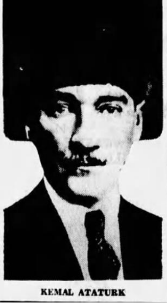
Ek – 5: Bir köylünün oğlu olan Atatürk, modern ülkenin kurtarıcısı oldu ("Peasant's son" 1938: 5).