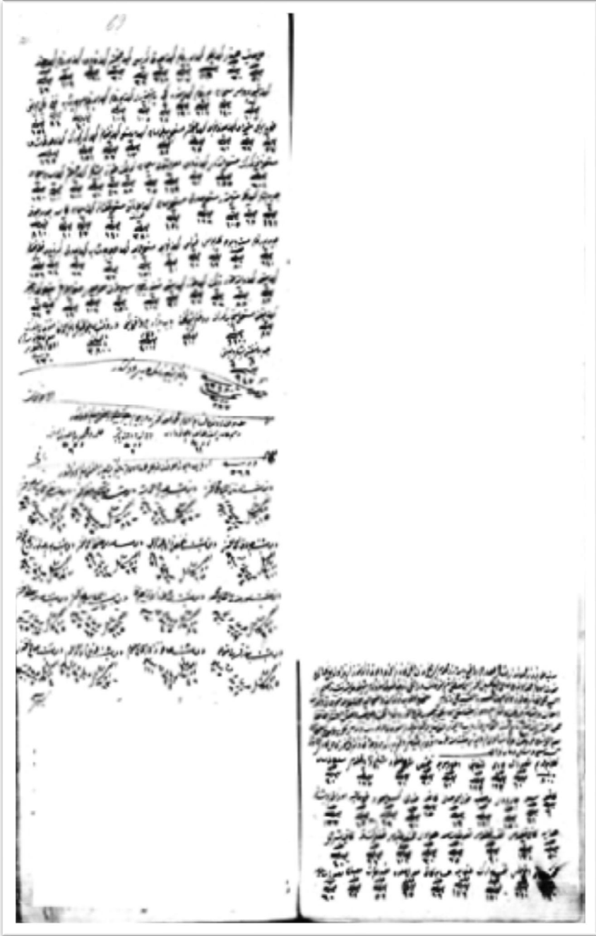
Ek 1. Pazarkapı Camii İmamı Şeyh Hüseyin Efendi'nin terekesi