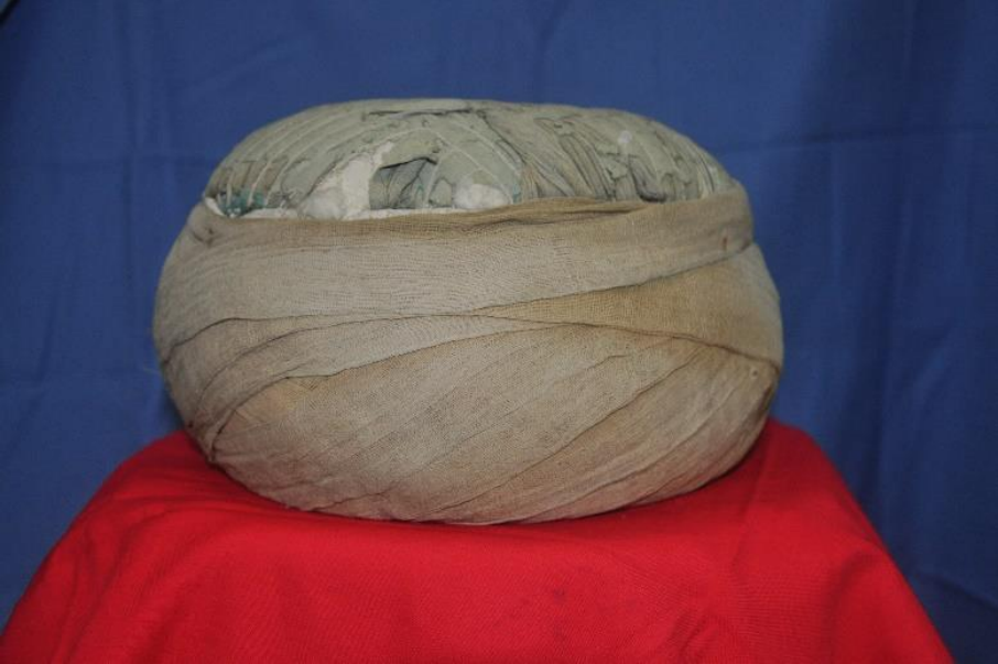
Şekil 6: Tac