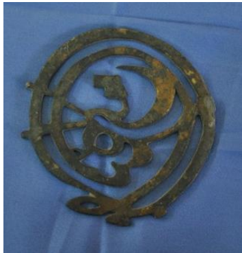
Şekil 4: 4 nolu alem