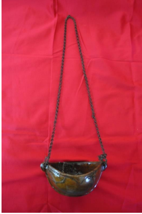
Şekil 11: Keşkül