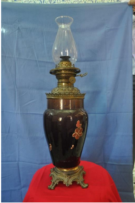
Şekil 16: Lamba