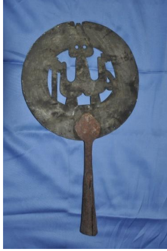
Şekil 2: 2 nolu alem