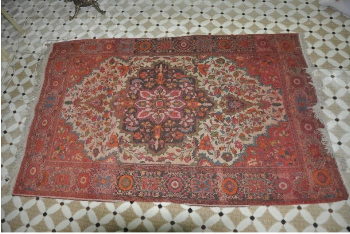
Şekil 18: Seccade