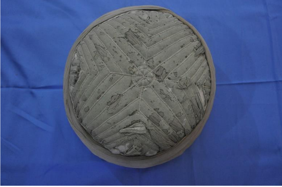
Şekil 5: Tac