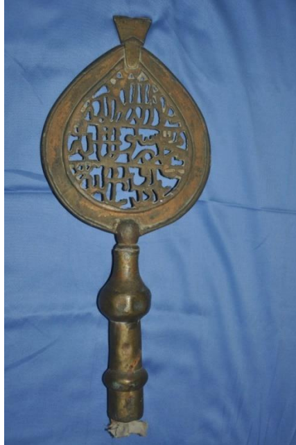
Şekil 1: 1 nolu aleme