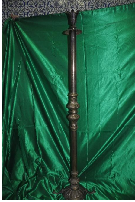
Şekil 9: 2 nolu şamdan-çerağ