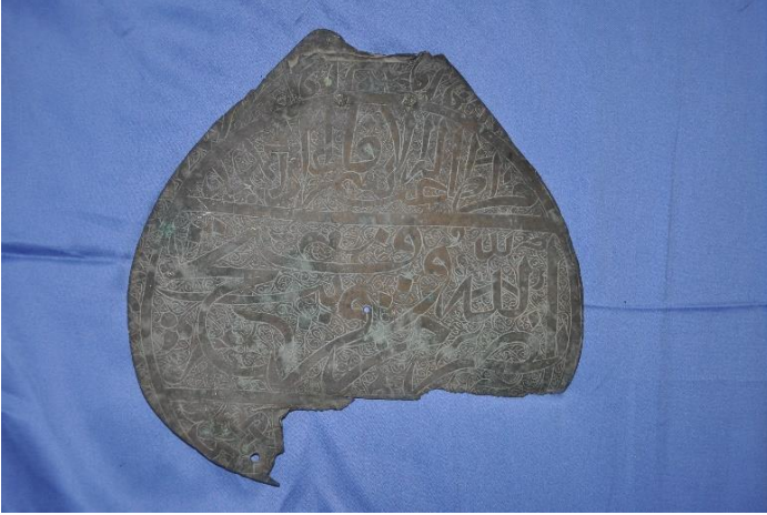
Şekil 3: 3 nolu alem