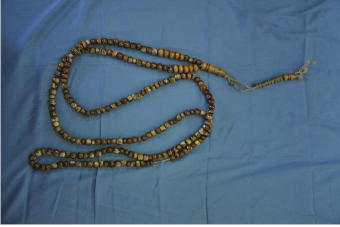
Şekil 17: Tesbih