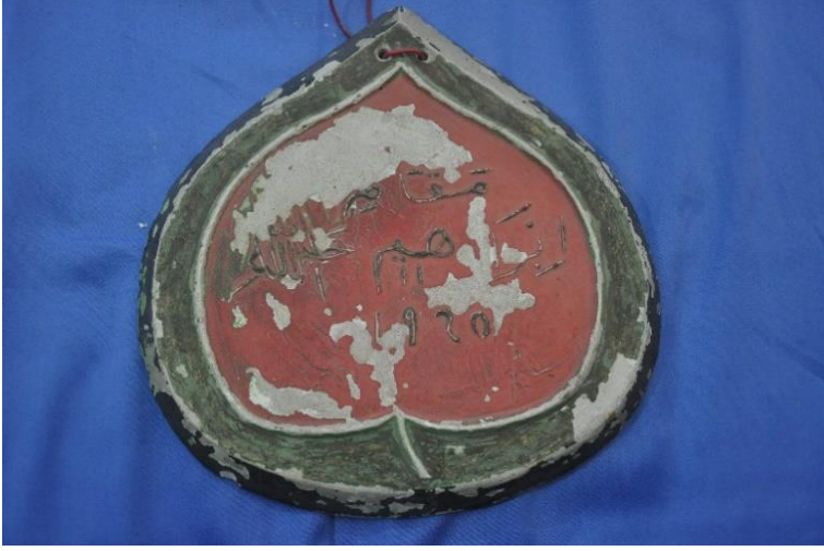
Şekil 20: 2 nolu levha