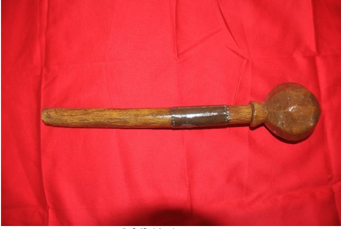
Şekil 13: Asa-şesper