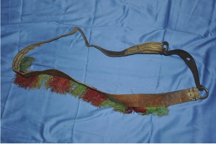
Şekil 15: Zikir Kemer