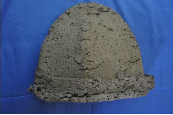
Şekil 7: Kùlah