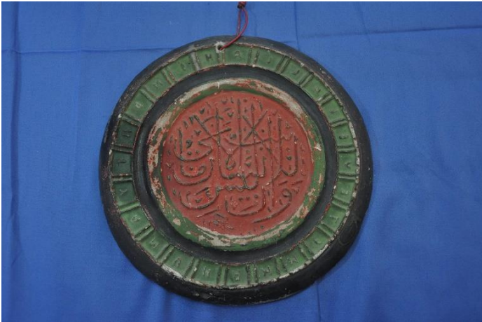
Şekil 19: 1 nolu levha