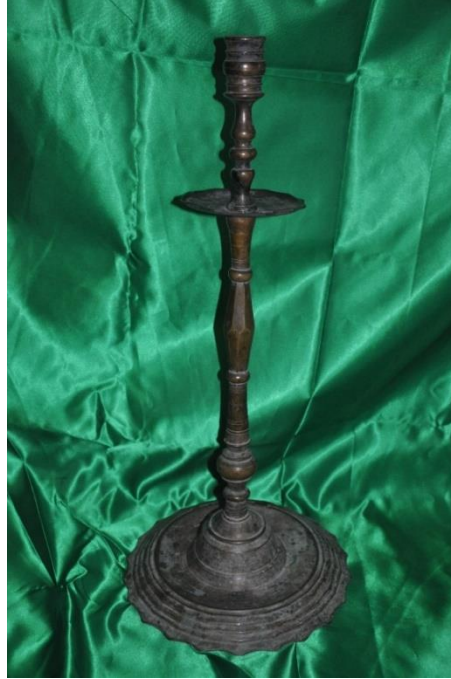
Şekil 10: 3 nolu şamdan-çerağ