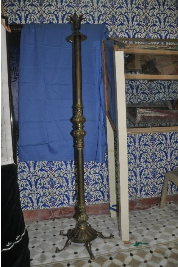
Şekil 8: 1 nolu şamdan-çerağ