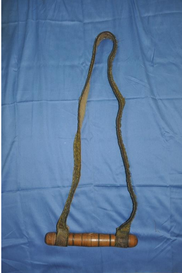
Şekil 14: Zikir Kemer