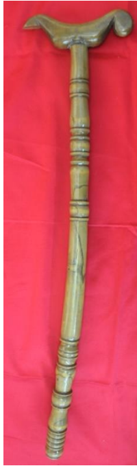
Şekil 12: Mütteka