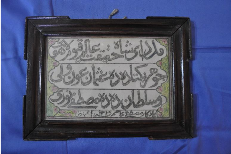
Şekil 21: 3 nolu levha