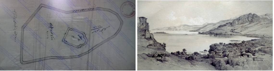
Fotoğraf 4a/b. Gedikkaya Kalesi ve içindeki şapelin inşa planı (1910) / Gedikkaya Tepesi ve altından şehre gelen yol ve çevresinin 1850'lerde Giresun Kalesi'nden bakılarak yapılmış çizimi (Gedikkaya Kalesi çizim: BOA, İ. AZN, nr. 9/ 18 (19 Rebiulevvel 1328); Manzara çizim: Tahsin Dervişoğlu Arşivi.)

Gerek Patrikhane'nin yazışmalarına, 1950'lilerde Bryer 'in yaptığı çizimlere ve gerekse yapı kalıntılarına bakarak Gedikkaya Kalesi'nin kuzey-güney yönünde yamuk üçgen biçiminde, kesme taştan inşa edildiğini ileri sürülebiliriz (Fotoğraf 3-4). Batı yönündeki giriş kapısında yuvarlak iki kulenin varlığı, ayrıca çevresindeki dik yamacın doğal bir koruma sağladığı ifade edilmektedir (Bryer, 2020: 250-251). 1964'te duvarları ve bir kulesi yıkılarak yakın mevkideki askerî hastane binasının inşasında kullanılmış; daha sonra yapılan müdahalelerle numunesi de kalmamıştır (Fatsa, 2020: 41-43; İltar, 2021: 56). Bu noktada söz konusu yapının Osmanlı tarihinde kullanılıp kullanılmadığı, kullanıldı ise ilişkili olduğu yapıların mahiyetine dair bazı sorular sorulabilir. Giresun'un fethi ve Osmanlı idaresine geçişinden sonra hazırlanan resmi evrakta bu isimde bir kale veya güvenlik yapısından söz edilmez. Ancak aynı mevkide küçük gemilerin sığınabildiği Gelincik Limanı ile buradan denize dökülmekte olan akarsuyun, bazı belgelerde Boğacak Limanı ve Boğacak Deresi şeklinde anıldığını biliyoruz. Çalış köyü hal-kının görevlendirildiği derbendin adı da vesikalarda yine aynı şekilde yazılmıştır. Esasında bakacak tabirinin galatı olan bu kavrama atfen, vadi boyu ulaşım sisteminin başlangıcında bir güvenlik yapısı bulunduğuna dair eski kayıtlarda da bilgilere rastlanmaktadır (BOA, TT 52: 678, 680-681; 387: 762; BOA, KK.d 2697: 90a). 11