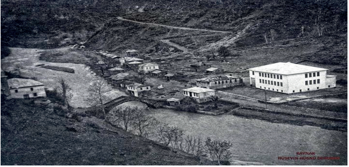
Fotoğraf 1. Karahisar-Giresun yolunda önemli bir menzil noktası: Dereli ilçe merkezindeki Hanyanı Mevkii (Köprünün solunda cami, sağında karakol ve hanlar var).

Kayıtlarda köprülerin bulunduğu lokasyona değinilmemiş ise de günümüze ulaşan bazı yapı kalıntılarından hareketle yaklaşık bir mevki belirlemek mümkündür. Nitekim sahadaki çalışmalarımız sırasında Duroğlu beldesinden geçen Yavuzkema beldesi yolu üzerinde iki adet, Duroğlu Tekke (Çatak) mahallesinde ise bir adet köprünün halen mevcut durumda olduğunu görme imkânımız olmuştur. (Fotoğraf-2) 7 Ahşap veya taş malzeme ile inşa edilmiş olan derbent (karakol) yapısının da aynı mevkide, bitki örtüsü içinde zamanla kaybolduğu düşünülebilir. Yine aynı bölgede Yağmurca köyünde Yavşan deresi üzerinde ve Dereli ilçe merkezindeki tek gözlü taş köprülerin bu ulaşım sisteminin birer kalıntısı olduğuna şüphe yoktur (Fotoğraf-1).