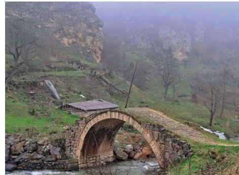
Fotoğraf-2a-b. Yakup Halife köprülerinden (Duroğlu Beldesi Çatakaltı mevkii) ve Şeyh Mustafa Zaviyesi yapılarından Çifteler Köprüsü ve değirmen (Yavuzkema Beldesi)

Bu yollar üzerinde, ihtiyaç duyulan noktalarda birer mescit veya cuma camisi, yolcuların konaklayabilecekleri zaviyeler, akarsular üzerine köprüler; nihayet bu sistemin imar ve güvenlik işlerini yürütecek şekilde tesis edilen derbentler eski kayıtlara konu edilmiştir (Barkan, 1942: 299-302) Nitekim Dereli ilçesine bağlı Yavuzkema Beldesi'nde Şeyh Mustafa Zaviyesi ve Bodar Camisi, Kızıltaş köyünde Hacı İlyas Zaviyesi 9 ve Göcü Camisi; Güdül ve Semayil'de Şimşir Derbendi ve Şeyh Murad Zaviyesi; Sarvan köyünde Kızılöz Derbendi ve