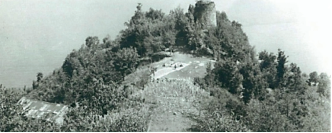
Fotoğraf 5. 1970'li yıllarda Gedikkaya Kalesi'nin kulelerden biri ve arka planda Giresun Adası

Bu durumda eski kayıtlarda belirttiği haliyle Yakup Halife ve hanedanına Süleyman Bey tarafından verilen yol hizmetinin başlangıç noktası Bakacak/Boğacak Derbendi , yani Gedikkaya Kalesi'dir. Varlığına tarihi vesikalarda işaret edilen Vanazıd, Kızılöz, Şimşir ve Şemseddin derbentleri ile bağlantılı olan ulaşım sistemlerinin Giresun şehri ile irtibatı da bu yapı üzerinden sağlanmıştır (BOA, TT 52: 677,670; 288: 724,731-732, 737, 752; 255: 509; 557: 29). Söz konusu yolu kullanan insanların şehre girmeden önce uğradıkları son vakıf yapılar ise Kayadibi Camisi ve onun imareti durumundaki Derviş Murad Zaviyesi 'dir. Eldeki mevcut verilere bakarak bu kurumların, Yakup Halife Zaviyesi ve Bakacak Derbendi ile olan ilişkisini de aydınlatmaya çalışalım.