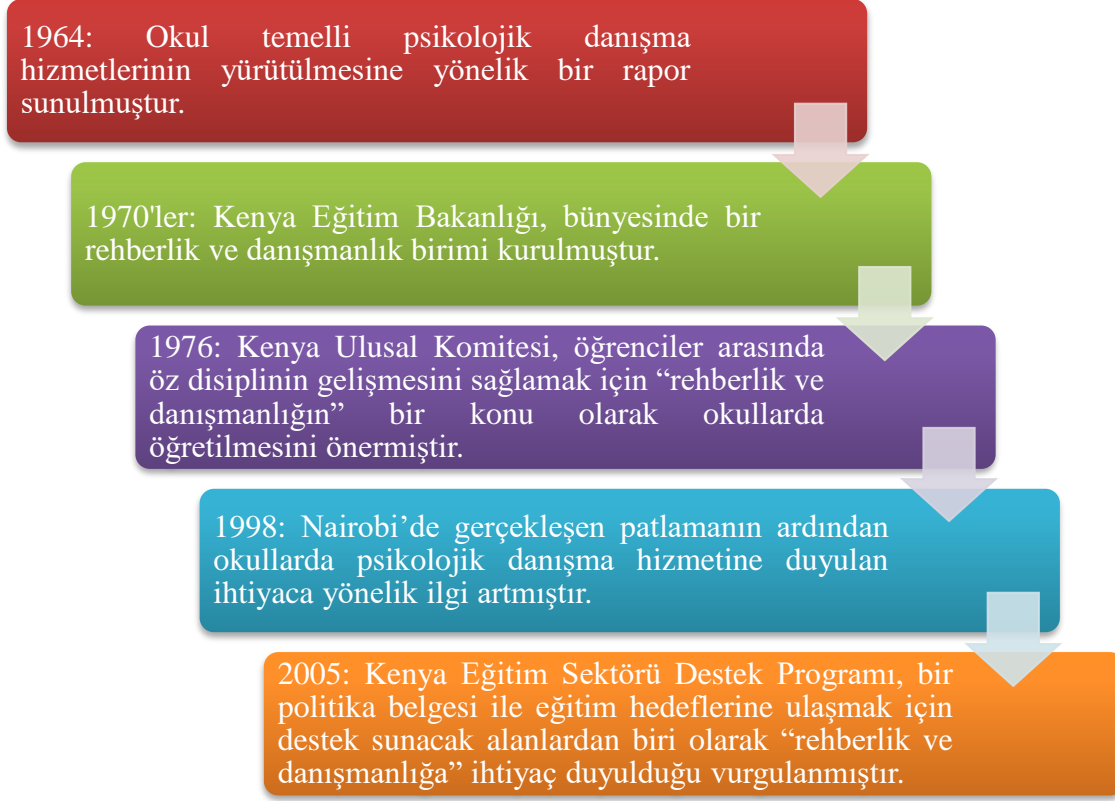
Şekil 1. Kenya’da okul psikolojik danışma ve rehberlik alanının tarihsel gelişimi