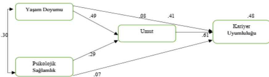
Şekil 2. Aracılık modeli

Tablo 1’de yer alan bulgular incelendiğinde; kariyer uyumluluğu puanları ile yaşam doyumu ( r=.45 , p<.01 ), umut ( r=.68 , p<.01 ) ve psikolojik sağlamlık ( r=.36 , p<.01 ) puanları arasında pozitif yönde anlamlı bir ilişki olduğu görülmektedir. Şekil 2’de aracılık modeline ilişkin elde edilen sonuçlara yer verilmiştir. Korelasyon ilişkisine ilişkin bulgular ile birlikte sonraki aşamada yaşam doyumu ve psikolojik sağlamlık değişkenlerinin kariyer uyumluluğunu yordama düzeyini ilişkin bulguları elde etmek amacıyla regresyon analizi yapılmıştır. Analiz sonucunda yaşam doyumu ( B = .43 , t = 7.647 ) ve psikolojik sağlamlığın ( B = .39 , t = 4.948 ) kariyer uyumluluğunun pozitif yönde anlamlı bir yordayıcısı olduğu bulgusuna ulaşılmıştır. Standartlaştırılmış regresyon katsayılarına ( \beta ) ilişkin bulgular ise, yaşam doyumunun ( \beta = .38 ) beliren yetişkinlerin kariyer uyumluluğu üzerinde psikolojik sağlamlığa ( \beta = .24 ) göre daha önemli bir yordayıcı olduğunu ortaya koymaktadır.