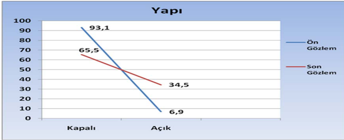
Şekil 1. Öğretmen A'nın Soru Sorma Becerisi Öğretimi Öncesindeki ve Sonrasındaki Gözlem Sorularının Yapı Yönünden Yüzde Grafiği

Öğretmen A'nın soru sorma becerisi öğretimi öncesindeki sorularının %93.1'i kapalı uçlu iken bu oran öğretim sonrasında %65.5, %6.9'u açık uçlu iken öğretim sonrasında bu oran %34.5 olmuştur. Soru sorma becerisi öğretimi sonrasında kapalı uçlu soruların oranının %27.6 oranında düştüğü, açık uçlu soruların ise aynı oranda arttığı görülmektedir. Gerçekleşen bu değişimin, Öğretmen A'nın sorularının yapısı üzerinde üzerinde anlamlı bir farklılık oluşturup oluşturmadığını belirlemek için Ki-Kare analizi yapılmıştır. Tablo 2, Öğretmen A'nın Ki-Kare analizi sonucunu göstermektedir.