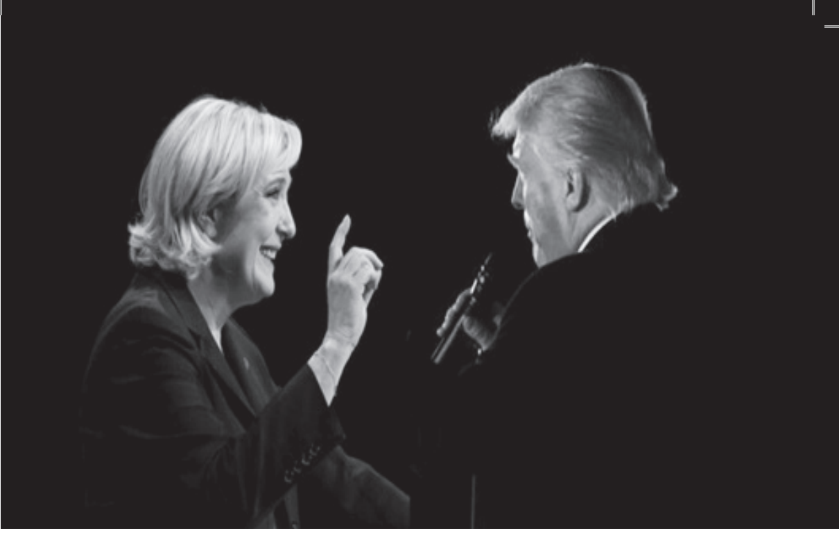
Donald Trump destekçileri için Marine Le Pen'in projesi, eski Amerikan başkanı-nınsını anımsatan bir dünya vizyonunu savunuyor.

rılmasına yönelik önemli bir girişim olarak kayıtlara geçmiştir. Sovyetler Birliği'nin dağılması sonucunda Avrupa ülkeleri arasındaki bütünleşme daha fazla hız kazanmıştır.