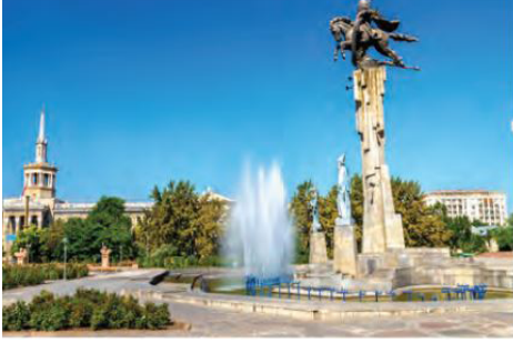
Görsel 10. Bişkek