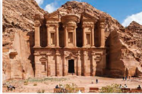
Görsel 2. Petra Antik Kenti

Ders kitabı içeriğinde, Orta Doğu'yla ilişkili olarak Suriye'ye ait siyasi ve tarihi konular hakkında tanıtıcı bilgilere yer verilmiş, ekonomik, sosyal ve kültürel konulara da atıfta bulunulmuştur. Türkiye ve Suriye arasında önemli bir sınır kapısı olan Yayladağı sınır kapısı ve başkenti Şam ile ilgili bir görsel yer verilmiştir. Ayrıca Suriye'nin sınır komşularımız içerisinde en uzun kara sınırına sahip ülke olduğu belirtilmiştir.