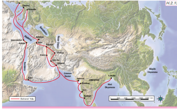
Görsel 5. Baharat Yolu Haritası

6. sınıf Sosyal Bilgiler ders kitabı içerisinde bulunan bir diğer konu başlığı “ İpek ve Baharat Yolu ” dur. Baharat yoluna ilişkin açıklamada, Orta Çağda Hindistan’dan başlayarak günümüzde Orta Doğu coğrafyasında bulunan ülkelerin toprakları üzerinden Avrupa’ya geçen tarihi bir ticaret yolu olmasından bahsedilmiştir.