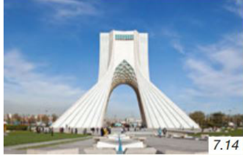
Görsel 7. Azadi Kalesi

Ders kitabı içerisinde yer alan “ Türk Cumhuriyetleri ve Komşu Ülkelerle İlişkiler ” konu başlığına bakıldığında İran ve Türkiye arasındaki ekonomik, kültürel, siyasi ve sosyal ilişkilerin öneminden bahsedildiği, petrol ve doğalgaz ticaretinin bu ilişkilerin ana kaynağı olarak görüldüğü ifade edilmektedir. Buna ek olarak kitap içeriğinde İran’ın başkenti Tahran’da bulunan Azadi kalesine ait bir görsel yer almaktadır.