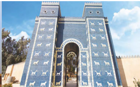
Görsel 4. İştar Kapısı