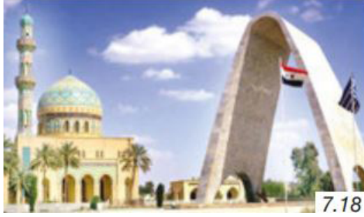
Görsel 9. Bağdat Cami

sayesinde Irak'tan ülkemize ham petrol taşındığı vurgulanmıştır (Şahin, 2021, s. 242). Kitapta Irak'ın Bağdat kentinde yer alan Bağdat Cami isimli bir görsele de yer verilmiştir.