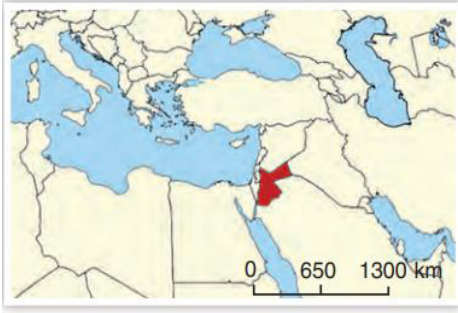
Görsel 1. Ürdün Siyasi Haritası