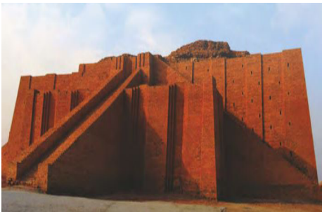
Görsel 3. Ziggurat

Sosyal Bilgiler ders kitabında “ Ülkem, Kültürüm ve Tarihim/Tarihe Yolculuk ” öğrenme alanı ile Orta Doğu'da önemli bir bölge olan Mezopotamya medeniyetleri hakkında tanıtıcı bilgilere yer verilmiştir. Özellikle Sümerler, Asurlar ve Babiller gibi medeniyetlerin bu bölgede kurulduğu ve tarihte çok önemli kültürel faaliyetler gerçekleştirdikleri ayrıca belirtilmiştir. Kitap içeriğinde Irak'ın Ur kentinde restore edilmiş Ziggurat ve yine Irak'ın Babil kentinde İştar Kapısı adlı görseller dikkat çekicidir.