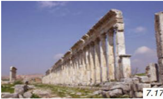
Görsel 8. Roma Tapınağı (Şam)

6. sınıf Sosyal Bilgiler ders kitabında Suriye, Türkiye’nin en uzun sınır komşusu olarak belirtilmiş ve Türkiye’nin Suriye halkının her zaman yanında yer aldığı açıklanmıştır. Özellikle devletimizin 2011 yılında başlayan Suriye’deki iç karışıklıktan ötürü ülkemize sığınan mültecilere kucak açması üzerinde durulmuştur. Ders kitabında Suriye’nin başkenti Şam’da Roma tapınağını belirten bir görsele de yer verilmiştir.