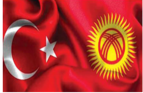
Görsel 11. Bişkek Bayrağı

4. sınıf Sosyal Bilgiler ders kitabında Kazakistan hakkında “Orta Asya’daki Türk Cumhuriyetleri arasında en geniş yüz ölçümüne sahip ülke olan Kazakistan’ın başkentinin Astana” olduğu belirtilmiştir (Tüysüz, 2020, s. 187).