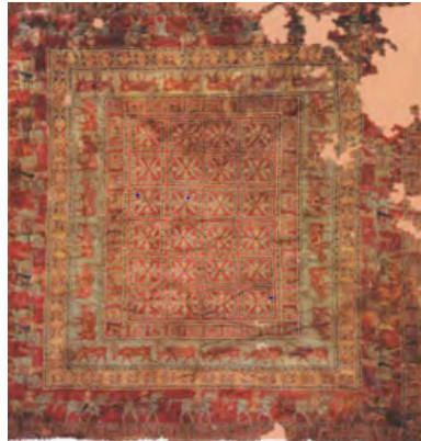
Görsel 12. Pazırık Halısı

5. sınıf Sosyal Bilgiler ders kitabında “Kültürel Özelliklerimiz” konu başlığı ile geleneksel el sanatları içerisinde bulunan halıcılığın, kökeninin Orta Asya’dan geldiği ve Anadolu’ya taşınan gelenekle devam ettirildiği ifade edilmiştir. Konuyla ilgili dünya üzerindeki en eski halılardan biri olan Pazırık halısının Orta Asya’da bulunmuş bir Türk halısı olduğu örneği verilmiştir. Kitapta ayrıca atalarımızın çay içeceği ile Anadolu’ya gelmeden önce Orta Asya’da tanıştıkları belirtilmiştir (Evirgen, Özkan ve Öztürk, 2020, s. 51).