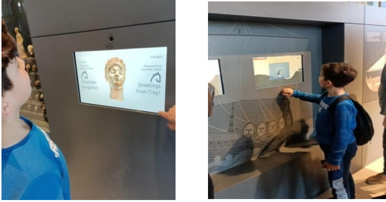
Fotoğraf 4: Yüz tanıma teknolojisi ve dokunmatik ekranlı oyun teknolojisi

Müzelerde çocuklara yönelik fiziki ve teknolojik düzenlemelerin yanı sıra eğitsel düzenlemelerde yapılmaktadır. Troya Müzesinde çocuklara yönelik eğitsel düzenlemeler Tablo 4'te gösterilmektedir.