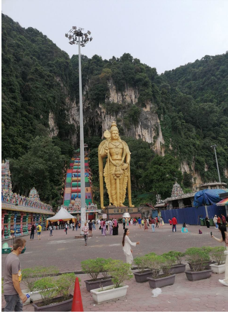
Resim 3: Batu Caves'e çıkan merdivenler ve Lord Murugan heykeli. (Çekilme tarihi: 15.5.2022)

Tapınak ayrıca Tamillerin her sene Ocak-Şubat aylarının dolunay zamanında kutladığı Thaipusam festivali için de önemli bir yere sahiptir. Soorapadman ve kardeşlerini yenmesi için tanrıça Parvati'nin, oğlu Murugan'a ilahi mızrağı olan Vel'i vermesinin anısına kutlanan bu festival kutlamaları tapınağın sadece Malezya'daki Hindular için değil, bütün dünyadaki Hindular nezdinde bir hac merkezine dönüşmesini sağlamıştır.