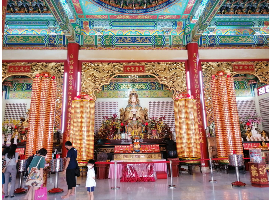
Resim 4: Tapınağın içinden bir görünüm. (Çekilme tarihi: 28.5.2022)

Tapınağın dış avlusunda ise Guanyin'in, kayaların ve küçük bir şelalenin içine yerleştirilmiş olan daha küçük bir başka heykeli bulunmaktadır. Avluda ayrıca Çin mitolojisinin evlilik ve aşk tanrısı olan Yue Lao'nun da bir heykeline yer verilmiştir. Avluda bunlardan başka Çin Şifalı Bitkiler Bahçesi, Dilek Kuyusu ve Kaplumbağa Göleti gibi unsurlar da göze çarpmaktadır. Avlunun en ilginç kısmı ise Çin astrolojisinin 12 hayvanı olan fare, öküz, kaplan, tavşan, ejderha, yılan, at, koç, maymun, horoz, köpek ve domuzun büyük birer heykellerinin sıralandığı köşedir. Bu hayvanların her birine farklı karakter özellikleri atfedilmiş ve bu hayvanların atfedilmiş olduğu yıllarda doğanların ait oldukları hayvanın karakter özelliklerine sahip olduğuna inanılmıştır. Bu burçların kökenine dair anlatılan efsaneye göre Buda, bir yılbaşında bütün hayvanları sarayına çağırılmış ancak huzuruna yalnızca 12 hayvan çıkmış. Saraya ilk olarak adım atan Fare'den sonra sırasıyla öküz, kaplan, tavşan, ejderha, yılan, at, keçi, maymun, horoz, köpek, ve son olarak domuz gelmiş. Buda, davetine icabet eden bu hayvanları ödüllendirmek için bir yılı 12'ye bölmüş ve her bir burca bu hayvanlardan birinin ismini vermeye karar vermiş. İnsanlar da böylece bu hayvanların özelliklerine sahip olmaya başlamışlar. 39 Aşağıda bu hayvanların karakter özellikleri ve atfedildikleri yıllar verilmiştir.