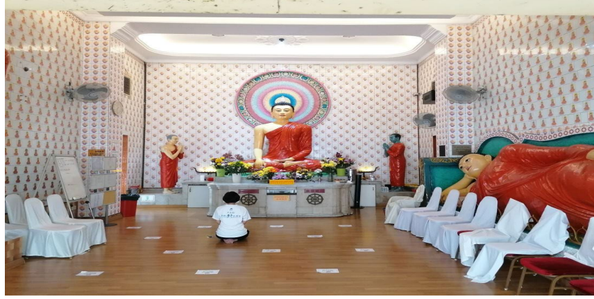
Resim 1: Ana tapınak odasının içinden bir görünüm. (Çekilme tarihi: 22.5.2022)

dikildiği ve insanlar tarafından tazim edildiği yeri ve çevresini koruduğuna ve etkilediğine inanmaktadırlar.