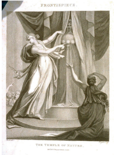
Görsel 3. Johann Heinrich Füssli, Doğa Tapınağı Şiirinin Ön Yüzü , 1803, Gravür, 16.3x22cm.

Johann Heinrich Füssli'nin resminde İsis bir peçenin değil büyük bir perdenin arkasında gizlenmiştir (Görsel 3). İsis burada, bereket ve doğa ana sembolü Kibele ya da Artemis gibi, doğurganlığı, bereketi ve anneliği temsilen çok meli olarak tasvir edilmiştir.