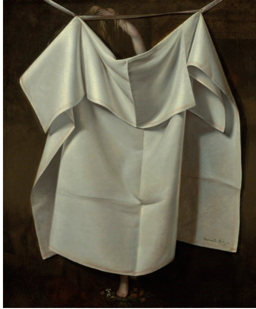
Görsel 6. Raphaelle Peale, Denizden Yükselen Venüs – Bir Aldatmaca (Banyodan Sonra) , Tuvalle Yağlı Boya, 74,2 x 61,2 cm.

Kutsal olanın bir perde ile saklandığı en etkileyici yapıtlardan biri de kuşkusuz Raphaelle Peale'nin Denizden Yükselen Venüs'üdür (Görsel 6). Resimde perde Venüs'ten çok daha gerçek ve ön plandadır. "Burada seyirciyi heyecanlandıran ve sarsan şey zaten neredeyse hiçbir tarafı görünmeyen kadının kendisi değil onu saklayan perdedir. Ağzı sulandıracak bir görüntüyü örterek seyirciyi deli eden, çarpıcı şekilde gerçek ve kendi işini iyi gören bir perde." (Leppert, 2017: 53). Richard Leppert resmin bizimle alay ettiğinden bahseder, seyirciye X ışınları gönderdiğini söyler fakat Peale'nin resmin göremediğimiz kısmını asla çizmemiş olduğuna da parmak basar. Peale, bize bu resmi, gözlerimizden saklanan gerçek bir resmi gizleyen bir resim olarak göstermeye çalışır. Leppert'e göre bu Trompe l'oeil bizi cinsiyet alanına götürür. Perdedeki gerçekliği algılamakta zorlanmayan izleyici için, Venüs algılanamayacak oyunbaz bir yanılsama olarak kalır.