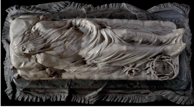
Görsel 4. Giuseppe Sanmartino, Peçeli İsa, 1753, Mermer, 50cm.x80cm.x180cm.

Peçe motifi 18.yüzyıl ve erken 19.yüzyıl yazarlarının eserlerinde sıklıkla görülür. Kant, Apuleius, Johann Andreas Segner, Ralph Cudworth, Voltaire, Friedrich Schiller, Hegel, Schelling, Karl Leonhard Reinhold, Goethe gibi pek çok şair, yazar ve düşünür İsis ve gizemli sözleri hakkında yazdılar. Yine aynı dönemde Peçeli İsis gibi, Peçeli İsa ve Peçeli Meryem heykel örnekleri dikkat çeker (Görsel 4, Görsel 5). Giovanni Strazza, Raffaele Monti, Pietro Rossi ve Giovanni Maria Benzoni gibi pek çok sanatçı peçeli tipe katkıda bulundular.