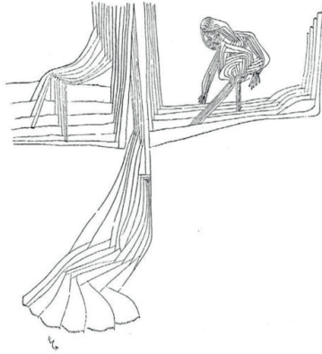
Görsel 1. Paul Klee, Perde Alemi , 1925, Kağıt Üzerine Dolma Kalem, 12x10 cm.

Perde, kelime anlamı olarak: Görüşü, ışığı engellemek, bir şeyi gizlemek için pencereye veya bir açıklığın önüne gerilen örtüdür; iki yeri birbirinden ayıran bölmedir. Kapılarda, pencerelerde, yatak süslemesi olarak, duş perdesi olarak, sinemada, tiyatrodada, gölge oyunlarında, kapağı olmayan dolaplarda, taht ya da yatak süslemelerinde, hastanelerde, soyunma kabinlerinde kullanılan, tarihten bu yana yaşamımızın birçok alanına yayılmış bir nesnedir perde. Fakat perde, saklama, görüşü ve ışığı engelleme anlamının bir getirisi olarak, metaforik olarak deyimlerin içinde de kendine yer bulur. Bir şeyin görünmeyen gizli yanına 'perde arkası', kendini dışarıya karşı izole eden birine 'perdelerini kapattı', dürüst davranmayan kalbini açmayan birine senin 'perdelerin var' deriz. Bu deyimler perdenin kişinin 'iç dünyası ve dünyayı algılama biçimi' ile olan ilişkisine dikkat çeker.