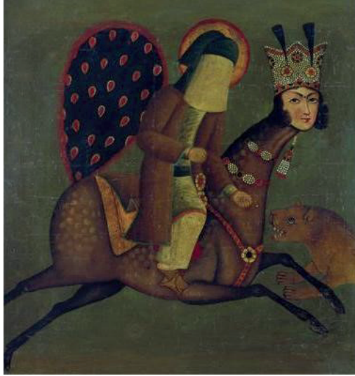
Görsel 7. Muhammet Zaman, Miraç, Keten Üzerine Yağlı Boya, Astan Quds Razavi Müzesi, 17.yüzyıl.

nedenle elleri ile gözlerini kapatır ve yandıklarını söylerlerdi. Bu nedenle “Hz. Peygamber’in başındaki hâle gibi kapalı yüzünün de ışıklı olduğu gerçeği de unutulmamalıdır.” (And, 2022: 127). Peçe bir çeşit kutsiyet katmak amacıyla kullanılır. Bu da bize perdeleme/peçeleme betimlemesinin, İsis ile aynı nedenle kullanıldığını gösterir. (Görsel 7, Görsel 8).