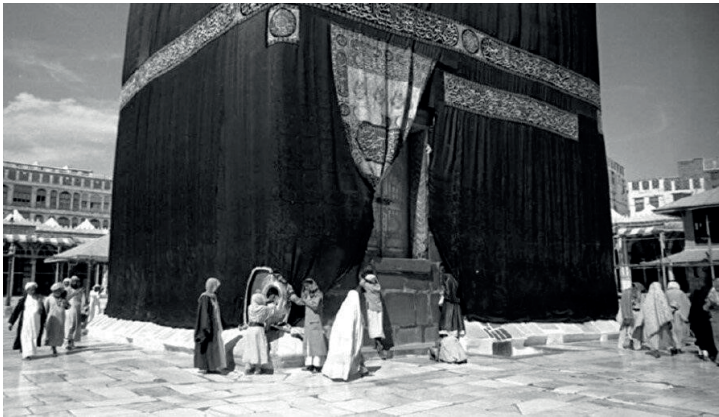
Görsel 10. Bilinmiyor, Kâbe, 1919, Fotoğraf. (Milli Kültür Araştırmaları Dergisi, Cilt4, Özel Sayı, 1-16.)

Yüce ve kutsal olanın örtülmesine bir diğer örnek de Kâbe'dir (Görsel 10). Sözlükte "dört köşeli veya küp şeklinde olmak" anlamındaki ka'b kökünden gelen ka'be "küp şeklinde nesne" demektir. Tavan ve duvarlar, yukarıdan mermer kaplamalara kadar inen çepeçevre atlastan yapılmış bir perde ile örtülüdür. Bu örtüye kisve adı verilir. İlk defa ne zaman ve kimin tarafından örtüldüğü hususunda farklı rivayetler vardır. Kabe'nin örtüsünün bir çeşit metafor olduğu bilinmektedir.