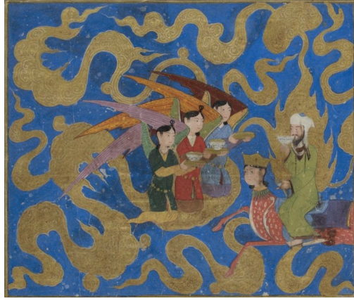
Görsel 9. Miraçname-Miraç gecesinde Hz. Muhammed'in kendisine ikram edilen şarap, bal ve sütün arasından sütü tercih ederek içmesini anlatan minyatür, 17.yüzyıl (Paris Bibliotheque Nationale de France, Suppl. turc 190, F.34 V0; Seguy 1977: plate 35).

17.yüzyıl'a ait Miraçname'den alınmış Miraç sahnesini anlatan minyatür örneği, peygamberin yüzünün peçesiz tasvir edildiği örneklerdendir. Üç melek tarafından şarap bal ve süt sunulduğu, peygamberin ise sütü seçtiği sahne betimlenmiştir (Görsel 9).