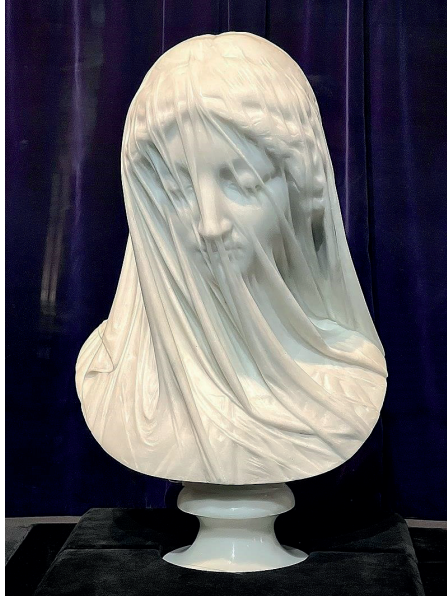
Görsel 5. Giovanni Strazza, Peçeli Meryem, 1743, Carrara Mermeri, 48 cm.