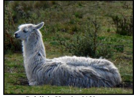
Şekil 1. Huarizo [12]

Huarizo, erkek lama ile dişi alpakadan elde edilen bir hibriddir [8, 9]. Genellikle nadir bulunan yapağısı için yetiştirilmektedir. Huarizolar genellikle kısır, ancak Minnesota Rochester üniversitesinde yapılan genetik araştırmalar çok küçük bir genetik modifikasyonla doğurganlığın korunmasını sağlamanın mümkün olabileceğini ortaya koymuştur [9]. Orijinleri deve yetiştiriciliğinin kontrolsüz olmaya başladığı İspanyol işgalinin hemen sonrasına dayanmaktadır. Genellikle yüksek oranda kalın lif içeren yapağıları nedeniyle Peru'daki tüm deve lifi endüstrisindeki insanlar tarafından bu hibridler makbul sayılmamaktadır [10]. Lama'ya benzeyen Lama/Alpaka hibridi "Warilla" olarak da bilinmektedir, ancak eğer Alpaka ebeveynine benziyorsa "T'aqa" olarak adlandırılmaktadır [11]. Şekil 1'de bir Huarizo görülmektedir.