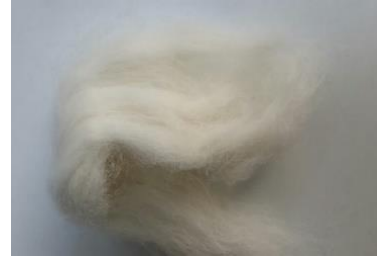
Şekil 2. Denemelerde kullanılan Huarizo lifleri

Denemelerde Şekil 2'de fotoğrafı verilen Peru'dan temin edilen beyaz renkli Huarizo lifleri kullanılmıştır.