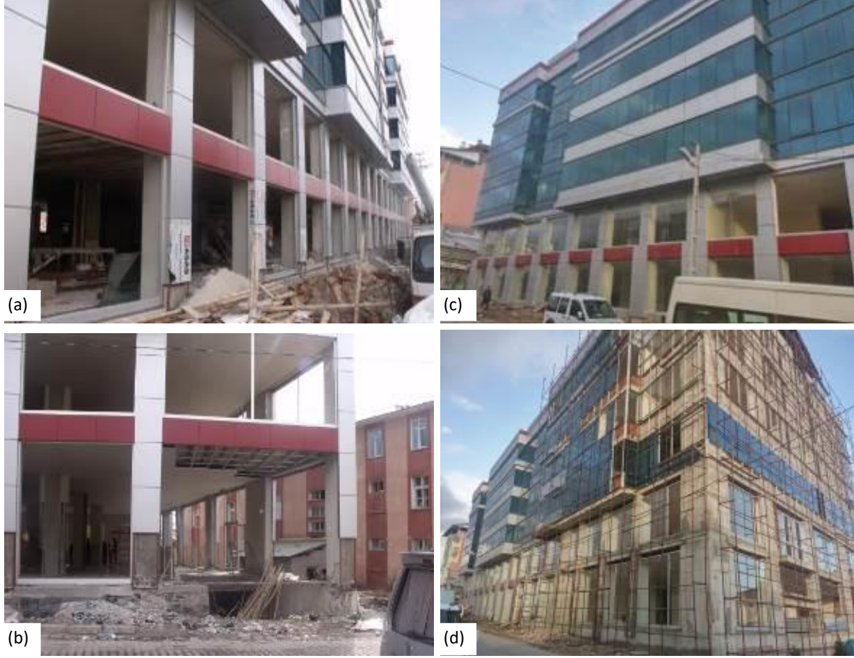
Şekil 5. İncelenen yapının hasarlı hali (a, b) ve güçlendirme sonrası (c, d) görüntüleri

yansıtılarak analiz yinelenmiştir (Şekil 4c). Şekil 5a-d'de güçlendirme öncesi ve sonrasına ait yapıdan görüntüler yer almaktadır. Yapının deprem öncesi, sonrası ve güçlendirmiş hallerin modal analiz sonuçları tablo 1'de sunulmuştur.