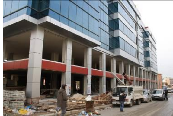
Şekil 2. Yapının önden görünüşü [16]

Yapının arkasında ve tek tarafta boydan boya dış duvar bulunmaktadır. Bu durum gerçek yapıyı yansıtabilmek amacıyla, bu çalışmadaki modelde diyagonal çapraz elemanlarla tanımlanmaktadır.