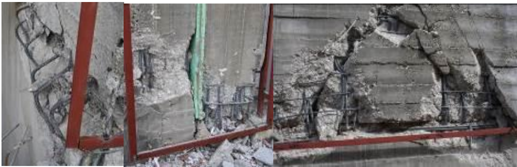
Şekil 1. Yapıdaki hasara ait örnek görüntüler

Literatürde statik ve dinamik hesaplar sonucu güncel TDY'ye göre yeterli olarak tasarlanan, ancak, son depremlerde ağır hasar alan BA yapıların hasar görme nedenlerinin ortaya konulması amacıyla; 23 Ekim 2011 Van depreminde ağır hasar almış (Şekil 1) bir yapı seçilerek detaylı bir şekilde incelenmiştir [15]. Literatürde yayınlanmış olan çalışmada, yapının projesindeki ve uygulamasındaki her iki durum ayrı ayrı modellenerek analiz edilmiş 2007 TDY'ye göre yetersiz elemanlar belirlenmiştir.