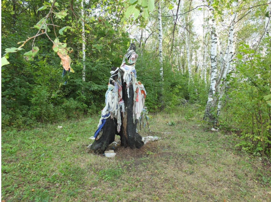
Ludorvay-Udmurt Cumhuriyeti Suvar Etnoparkı-Çuvaş Cumhuriyeti Aksu-Tataristan