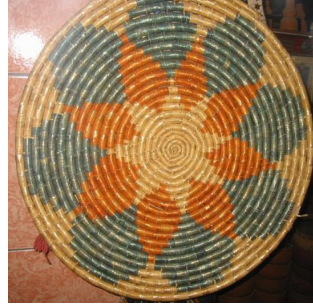
Görsel 17: Stilize Çiçek Desenli Mardin Sifri Örneđi