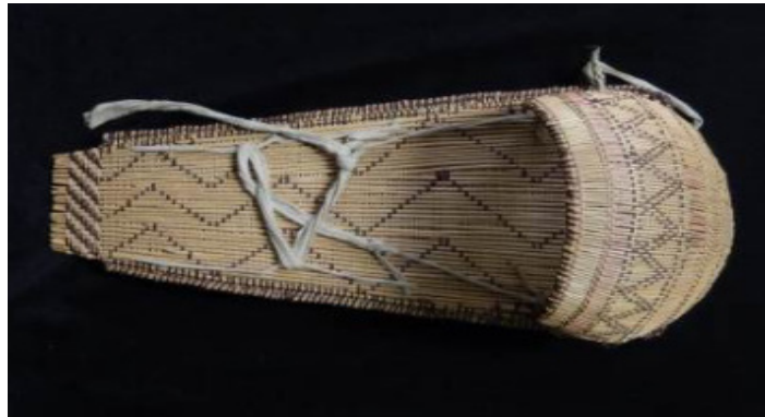
Görsel 37: Kuzey Amerika Kızılderili Bebek Taşıyıcı

Kızılderili sepetlerinde bebekleri taşımak için özel sepetler bulunmaktadır. Türk kültüründe ve Anadolu sepetlerinde bebeklerin taşınması amacıyla dokunmuş sepet örneklerine rastlanmamıştır.