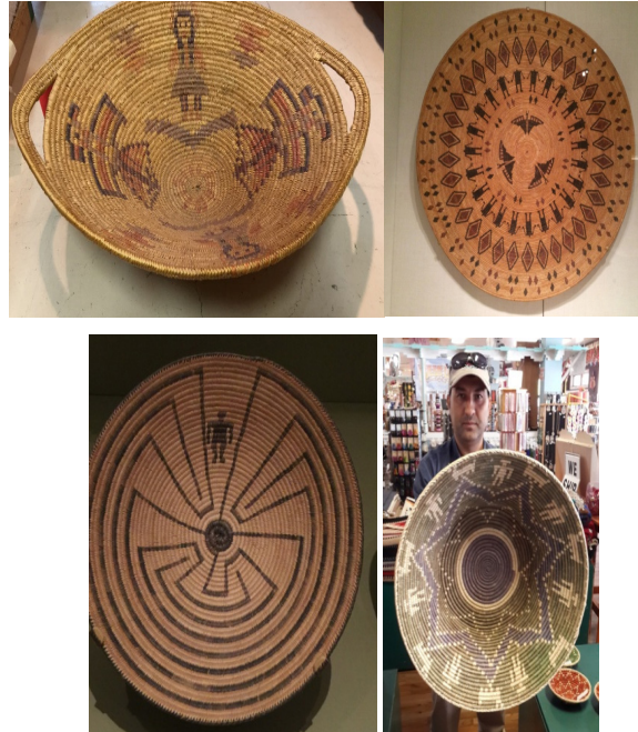
Görsel 14: Kuzey Amerika Kızılderili İnsan Figürlü Sepet Örnekleri

İnsan figürü Kuzey Amerika Kızılderili sepetlerinde sık kullanılan desenler arasında yer almaktadır (Bkz. Görsel 14). Özellikle labirent adam konulu sepetler insanın yaşam serüvenindeki iyilik ve kötülüğünü temsili yolla anlatır ve kabileler arasında çok yaygın sepet örneklerindedir (Bernstein, 2003:19). Türkiye kültüründeki sepet örneklerine bakıldığında figüratif ve insan figürünün kullanıldığı sepet örneklerine rastlanmamaktadır.