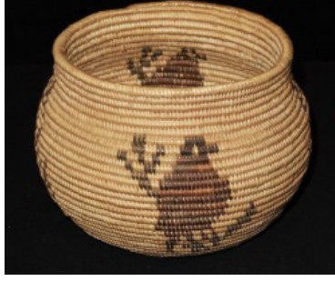
Görsel 23: Kuzey Amerika Yerli Kuş Motifli Sepet Örneği

Kaynak: (Santa Barbara Museum Of Natural History Kataloğu, t.y.)