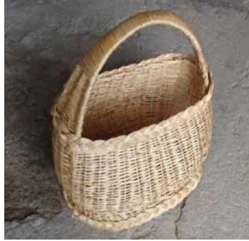
Görsel 33: Anadolu'dan Nişan Sepeti Örneği

Kızılderili ve Türk kültüründe evlilik kutsal sayılmakta, hayatın önemli bir bölümünün başlangıcı olarak kabul edilmektedir. Hem Türklere hem de Kızılderilerde tören sepeti olarak da adlandırılan özel sepetler örülmüştür. Anadolu'daki sepetler "nişan sepeti" (Bkz. Görsel 33) olarak tanımlanmaktadır. Genellikle desensiz ve ebat olarak büyük saplı sepetlerdir. Nişan sepeti ile hem kız tarafı hem de erkek tarafı birbirleri için hazırladıkları hediyeleri gönderirler. Kızılderili düğün sepetleri (Bkz. Görsel 34) Türk sepetlerinden oldukça farklıdır. Düğün esnasında kutsal saydıkları nesnelere yere koymamak için kullanılırlar. Hopi kabilesinde ise, damadın ailesi gelin için gelinlik diğer buna karşılık olarak gelinin ailesine damadın ailesine sepet levhası hediye etmektedirler. Yerli sepetlerinin tasarımları da özeldir. Kullandıkları semboller ile dünyaya gelişi, acıyı, üzüntüyü ve evliliği temsil etmektedir (Santa Barbara Museum Of Natural History Kataloğu, t.y.).