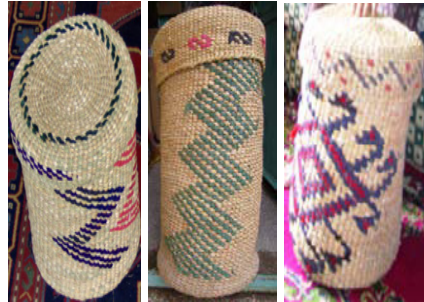
Görsel 18: Deve Boynu Motifli, Yılan Eğrisi Motifli, Akrep Motifli Sepet Örneđi, Aksaray Gülağaç

Anadolu halkı ve Kızılderililer, doğada gördükleri hayvanların motiflerini de sepetlerinde kullanmışlardır. Türkiye’de örülen sepetler incelendiğinde çok nadir natüralist hayvan tasvirlerine (Bkz. Görsel 19) rastlanmaktadır. Genellikle sepetlerde görülen sembolik hayvansal motifler, kilimlerde ve halılarda kullanıldığı görülen Türk desenleridir (Bkz. Görsel 18). Özellikle Aksaray’ın Gülağaç sepetleri de geleneksel hayvansal motifler ile süslenmiş sepetlere örnektir.