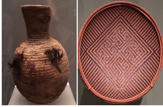
Görsel 4: Kuzey Amerika Yerli Sepetleri Örnekleri

(Müze Envanter No:3/9367, ca. 1890-1910 ve Müze Envanter No:25/699, ca. 1920)