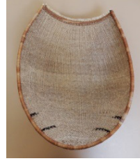
Görsel 8: İkileme Tekniği (Twined Technique)