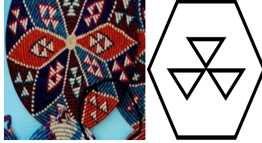
Görsel 24: Ayna Motifli Hatay (Antakya) Cimem Örneği ve “Küpe (Ayna)” Motifi Çizimi

Her iki kültürde de desen ve motif özellikleri bakımından benzerlik gösteren sepet (Bkz. Görsel 24 ve Görsel 25) örnekleri tespit edilmiştir. Bu sembollere örnek olarak Anadolu kilimlerinde de sık rastlanan “küpe motifi” verilebilir. Anadolu’da bekar kızlar evlenme isteklerini dokumalarında küpe sembollünü kullanarak belirtmişlerdir (Yeşildal, 2019:193). Küpe motifi aynı zamanda karşımıza “Ayna motifi” (Bkz. Görsel 24) olarak Şanlıurfa yöresindeki çit süslemelerinde de çıkmıştır (Özcan, 2017:98).