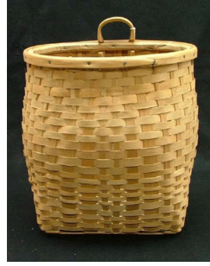
Görsel 29: Passamaquoddy Yerlileri Sepet Örneği