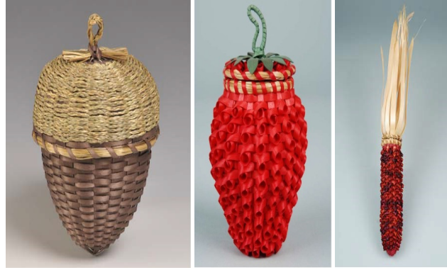
Görsel 39: Fantastik Sepet Örneğeri

Kuzey Amerika Kızılderili sepetleri arasında fantastik sepet olarak tanınan bir grup bulunmaktadır. Bu sepetler parlak renkli, kıvrımları olan süslü sepetlerdir. Bu sepetler yaban mersini, ilek, balkabađı, kozalak ve mısır gibi yiyeceklerin řekillerinde örcölöğülen Wabanaki Sepetleridir (Bkz. Görsel 39). Bu tarz sepet örneğine Anadolu'da rastlanmamıřtır (Neptune ve Neuman, 2015:8).