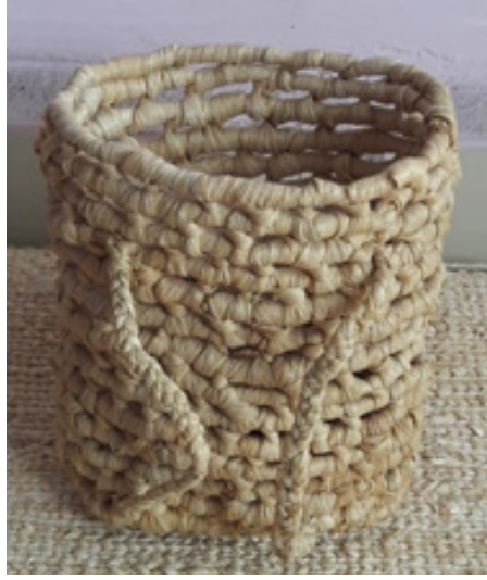
Görsel 40: Kültür Bakanlığı Bitkisel Örücülük Sanatçısı Nebiye Yıldız'a Ait Mısır Kapçığından Sepet Örneği