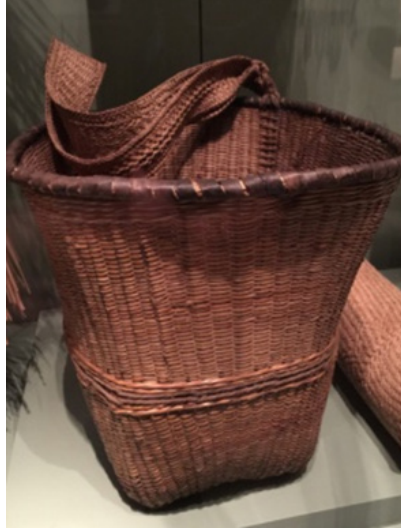
Görsel 26: Mebêngôkre Yerlileri Yük Sepeti

Mebêngôkre yük sepetleri de kamptan kampa taşınırken ev eşyasını korumak ve saklamak için kullanılmıştır. Ayrıca, 1800 yılların sonlarında Brezilya fıstığı ve kauçuğu toplamak içinde üretilmişlerdir (Eroğlu, 2015a). Her iki sepet form ve işlev olarak benzer ama örgü tekniği olarak farklılık göstermektedir.