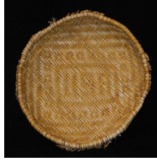
Görsel 6: Tekleme Tekniği (Plaited Technique)

Kuzey Amerika Kızılderili sepetleri; teklemeye tekniği (plaited technique) (Bkz. Görsel 6), bükerek ikileme (wicker technique) (Bkz. Görsel 7), ikileme tekniği (twined technique) (Bkz. Görsel 8), ve ajur örme tekniği (coiling technique) (Bkz. Görsel 9), olmak üzere dört temel teknik üzerine inşa edilmiştir. Kızılderili sepetleri dünyada teknik çeşitlilik bakımında özel bir yere sahiptir (Bernstein, 2003:16).