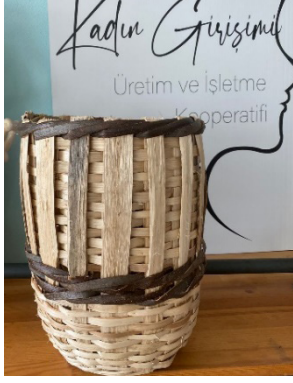
Görsel 28: Karamürsel Sepeti