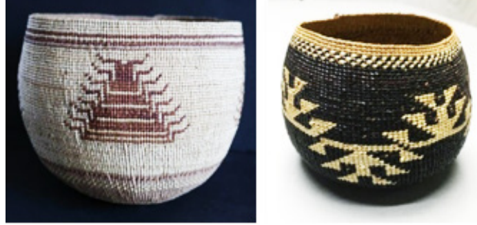
Görsel 20: Kırkayak Tasarımlı ve Kurbağanın Eli Tasarımlı Kızılderili Sepet Örneği

Kuzey Amerika Kızılderili sepetlerinde hayvansal motifler (Bkz. Görsel 20 ve Görsel 21) Türk sepetlerinde olduğu gibi stilize edilerek kullanılmıştır. Ayrıca Kızılderili sepetlerinde, Avrupalı alıcıların talebi ile, natüralist hayvansal tasvirler (Bkz. Görsel 22) ve kuş motifleri de (Bkz. Görsel 23) yer almaktadır (Bernstein, 2003:19).