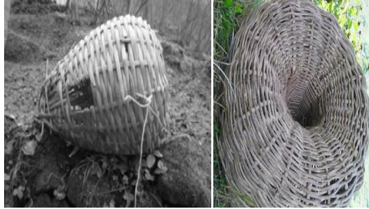
Görsel 31: Türkiye’den Çöte Örnekleri