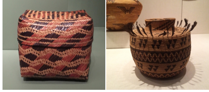
Görsel 5: Örgü Tekniği ve Yabancı Malzeme ile Süslenen Sepet Örnekleri