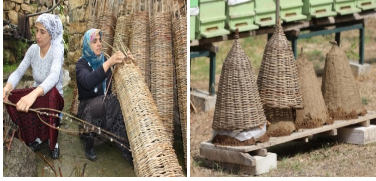
Görsel 32: Konik Sepet Yapımı, Sepet Kovan Örnekleri