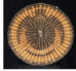
Görsel 7: Bükerek İkileme (Wicker Technique)