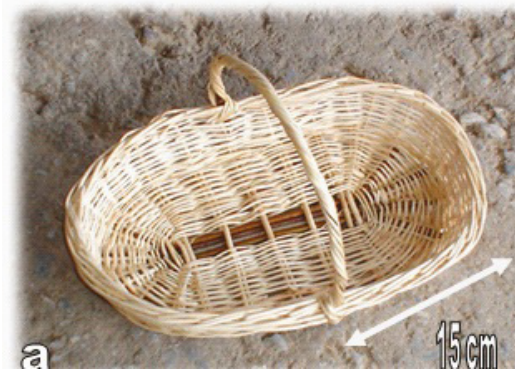
Görsel 3: İncir Sepeti Örneği

Fonksiyonlarına göre tanımlanan sepetlere yumurta sepeti, kaşıklık sepeti, pazar sepeti, incir sepeti (Bkz. Görsel 3), bulgur sepeti, nişan sepeti, şişe sepeti gibi sepetler örnek olarak verilebilir.