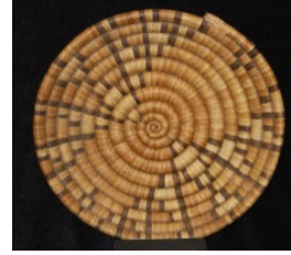
Görsel 9: Ajur Örme Tekniği (Coiling Technique)