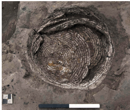
Görsel 1: Çatalhöyük Kazısında Bulunan Defin Sepeti

Önceki dönemlerden elde edilen nadir örneklerden birisine neolitik döneme tarihlendirilen, Çatalhöyük kazılarında elde edilen defin sepetidir. Çatalhöyük yerleşkesinde yapılan kazılarda M. Ö. 6500 yıllarına ait sepet ve küfe kalıntıları bulunmuştur. Neolitik dönem insanları sepetleri sadece taşıma ve saklama aracı olarak kullanmamışlardır. Tahılları sepette koyarak sıcak toprakta kavurma ve ısıtma işleminin yapıldığı bilinmektedir. Çatalhöyük'deki duvar resimlerinden ve buluntulardan (Bkz. Görsel 1) ölüleri sepetin içinde gömdükleri anlaşılmaktadır. Sepetler sarmal teknikle dokunmuş ve tabandan başlayarak spiral şeklinde örülmüştür. Buluntulardan Neolitik dönem sepetlerin günümüzdeki sepetlerle aynı teknikle dokunduğu anlaşılmaktadır (Türktaş, 2011:134). Arkeolojik bulgular Anadolu'da sepet örücülüğünün, Neolitik dönemde Çayönü, Çatalhöyük, Ulucak, Domuztepe, Aşağı Pınar'da başladığını ve Batı Anadolu'da Gülpınar, Beşik-Sivritepe Alacalığöl'de Koltolik dönemde de devam ettiğini göstermektedir (Özdemir, 2010:2).