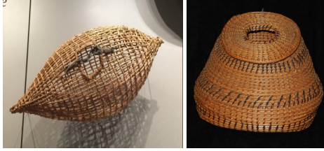
Görsel 30: Kuzey Amerika Yerli Balık Avlama Malzeme Örnekleri

Kuzey Amerika Yerli ve Anadolu sepetleri sadece eşya veya yük taşımak amacıyla kullanılmamıştır. Balık avlamak için “çöte” adı verilen sepetlerde bulunmaktadır. Her iki toplumda da üretilen çöteler form olarak benzerlik göstermektedir. Ayrıca, sepetler suyun dışarı çıkması için sık dokunmamıştır ve balıkların içeriye girebilmesi için küçük bir delik bulunmaktadır.