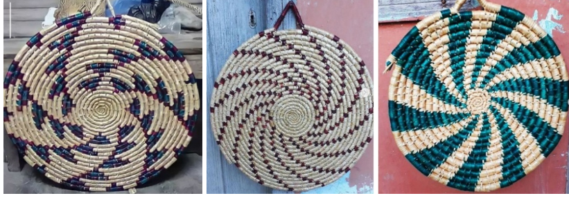
Görsel 13: Çarkifelek Desenli Hatay (Antakya) Cimem Örnekleri