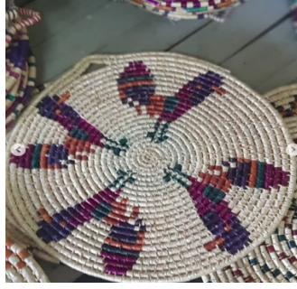
Görsel 19: Horoz Tasviri, Hatay (Antakya) Cimem Örneği