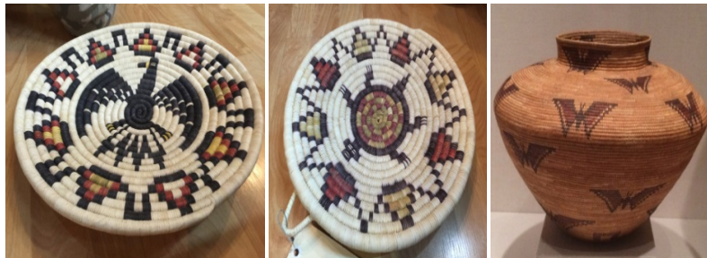
Görsel 22: Kuzey Amerika Kızılderili Natüralist Hayvan Desenli Sepet Örnekleri