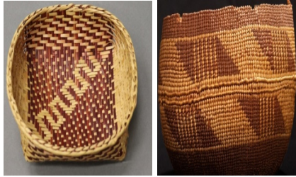
Görsel 21: Solucan İzi Tasarımlı ve Su Yılanı Tasarımlı Kızılderili Sepet Örneği