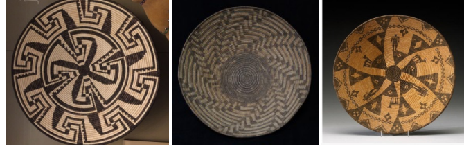
Görsel 12: Çarkifelek Desenli Kuzey Amerika Kızılderili Sepet Örnekleri