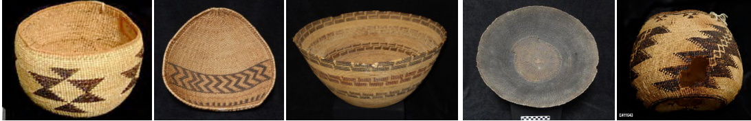
Görsel 35: Çorba Kasesi, Kepçe, Sıvı Kaynatma Kabı, Kuru Pişirme Kabı, Kaşıklık

Anadolu ve Kızılderili kültüründe sepetler mutfakların vazgeçilmez araç ve gereçlerindedir. Özellikle Yerli kabileler sepetleri kuru ve sıvı kaynatma kabı olarak kullanırlar. Kuru pişirme yönteminde, Yerliler ot ve tohumlarını sepet tepelerine sıcak kömürler atarak pişirmişlerdir. Sıvı kaynatmada ise; sepetler çok sıkı dokunur ve su eklendiğinde lifler şişer ve böylece su geçirmez. Kızılderili mutfaklarında sepetleri pişirme kapları dışında yemek hazırlama kapları, çorba kabı, saklama kabı, tepsi, kepçe, elek, yemek karıştırıcı, kaşıklık gibi birçok fonksiyonel ürün olarak görülebilir (Bkz. Görsel 35). Mutfakta kullanılan sepetler sadece işlevsel ürünler değildir, estetik olarak da özel sepetlerdir, form ve desen olarak çok zengin çeşitliliğe sahiptirler (Santa Barbara Museum Of Natural History Kataloğu, t.y.).