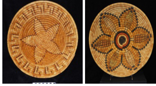
Görsel 15: Kuzey Amerika Kızılderili Stilize Çiçek Desenli Sepet Örnekleri