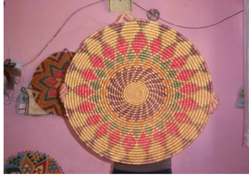
Görsel 11: Hatay (Antakya) Sini-Sofra Örneği, Fotoğraf:Berna İleri

Kuzey Amerika Kızılderili ve Türk sepet örücülüğünün benzer özellikleri olduğu gibi farklılıkları da mevcuttur. İki kültür sepetleri arasındaki en büyük ayrım Kuzey Amerika sepetlerinde işlevsellik kadar görselliğin de önemli olmasıdır. Kızılderili sepetleri zanaattan öteye gitmiş sanata dönüşmüşlerdir. Türk sepetleri incelendiğinde ise sağlamlık ve fonksiyonelliğin ön planda tutulduğu görülmektedir. Anadolu sepetleri, Kızılderili sepetlerinin aksine genellikle tek renk, desensiz ve bez ayağı tekniğiyle örülmüştür. Fakat Türkiye’de birkaç bölgede Amerika Yerli sepetlerine, örülme tekniği ve motif benzerliği gösteren sepet örnekleri de görülmektedir. Kızılderili sepetlerine en yakın örnek Hatay (Antakya) ilinde, buğday saplarından örülen ve yörede “cimem”, “tabak” ya da yöresel adıyla “tabakıyye-tıbayka”, yer sofrası olarak kullanılan büyük boy “sini-sofra” (Bkz. Görsel 11) olarak adlandırılan ürünlerdir (Çelik, Karakelle ve İleri, 2013:66-69).