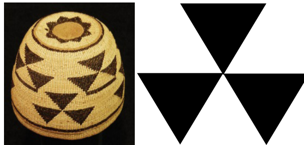
Görsel 25: Kızılderili Karok Kabilesi “Yılan Burnu Tasarımlı” Sepet Örneği ve “Yılan Burnu” Motifi Çizimi

Kızılderili Hupa, Yurok, ve Karok kabilelerinin sepetlerinde kullanılan “Yılan Burnu Tasarımı (Snake Nose Design)” sembolleri şekilsel olarak küpe motifi ile benzerlik göstermektedir (Bkz. Görsel 25).