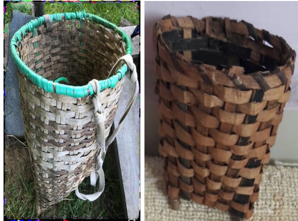
Görsel 27: Karadeniz Bölgesinden Fındık Sepeti Örnekleri

Kaynak: (Niyazoğlu, 2022:201), (Yıldız, 2023)