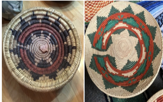
Görsel 34: Kuzey Amerika Kızılderili Düğün Sepeti Örnekleri