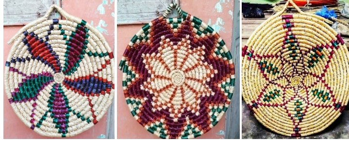
Görsel 16: Stilize Çiçek Desenli Hatay (Antakya) Cimem Örnekleri

Kaynak: (Santa Barbara Museum Of Natural History Katalođu, t.y.)