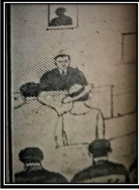
Resim 3. Karagöz/28.10.1933