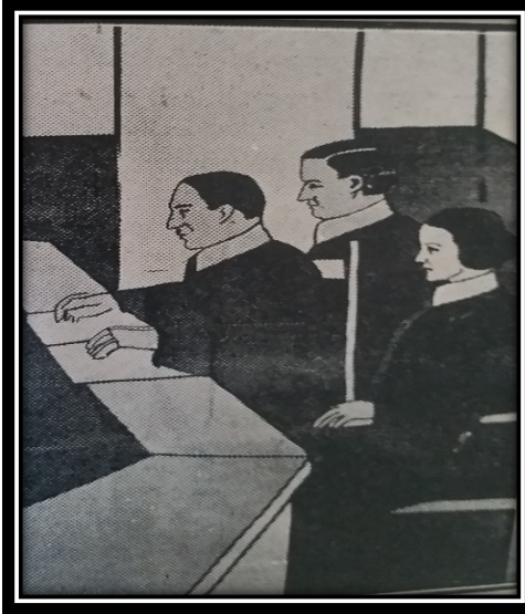
Resim 5. Karagöz/28.10.1933