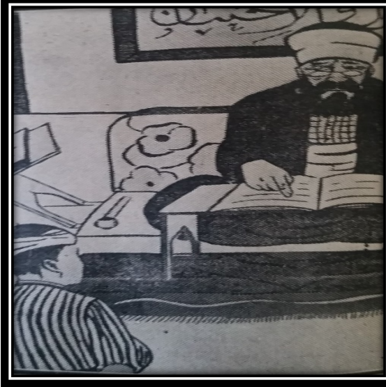
Resim 6. Karagöz/28.10.1933

Eski mektebin hapisneden farkı yoktu, eski mahkemede bir sarıklı tek başına aklına eseni yapardı, eski imam nikâhı bir sözle kıyar bir sözle bozulurdu! (1933, 28 Birinci Teşrin). Eski devirle yeni devir arasındaki değişim, Karagöz , s.4-5.