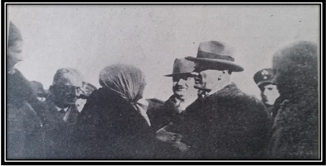
Resim 7. Karagöz/28.10.1933

Cümhur reisimiz büyük Gazi, Başvekilimiz İsmet Paşa kadın erkek köylü kentli her sınıf halkla konuşup herkesin isteğini dinleyip yerine getiriyorlar; eskiden hükümet adamlarının yüzünü bile göremezdik! (1933, 28 Birinci Teşrin). Eski devirle yeni devir arasındaki değişim. Karagöz , s.4.