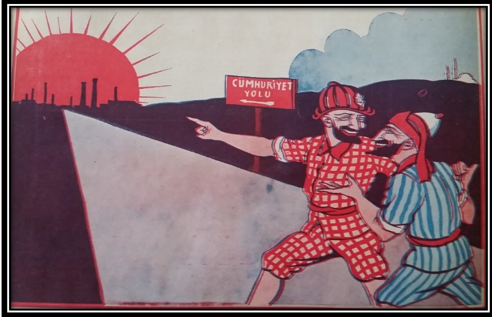
Resim 8. Karagöz/1/11.1933

“Eski devirle yeni devir arasındaki değişim” başlıklı yazının devamında “eski ve yeni” siyasetçilerin karşılaştırmasının yapıldığı görülmektedir. Bu karşılaştırmada sayfada yer alan diğer görsellerden farklı olarak karikatür yerine Atatürk’ün gerçekleştirdiği yurt gezilerinden bir fotoğraf karesi kullanılmıştır. Bununla beraber Atatürk’ün bulunduğu fotoğrafın yanında eski hükümeti veya padişahı gösteren bir karikatür kullanılmamıştır. Fotoğraf altı yazısında “ eskiden hükümet adamlarının yüzünü bile göremezdik ” ifadesi eklenmiş, “Osmanlı” hem görsel hem yazılı olarak sansürlenmiştir.