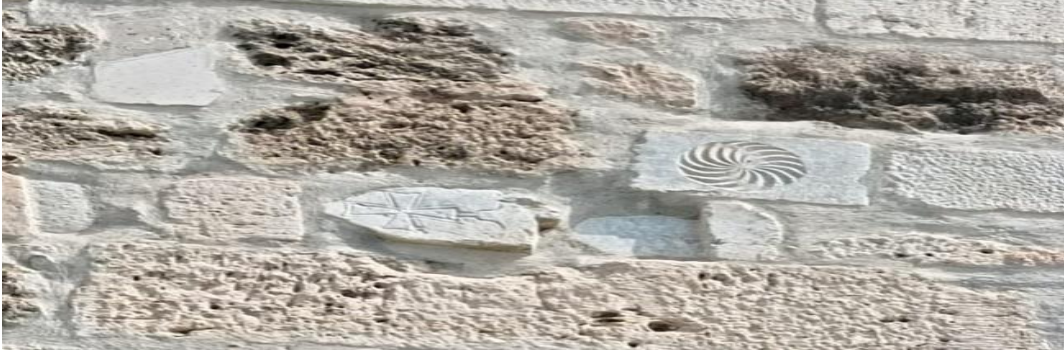
Fotoğraf 3. Haç figürlü taşın duvar inşasında kullanılmış olması bu duvarın Dânişmendli sonrası bir dönemde yapıldığını göstermektedir.

Kalenin bulunduğu zeminin hem kayalık olması hem de vadi tabanından yüksekte olması savunmayı kolaylaştırmaktadır. Bu nedenle Tokat Kalesi hendeğe ihtiyaç duymaz. Kayalık zemin kuşaticıların lağım bağlamasına imkân vermemektedir. Kalenin bulunduğu noktaya mancınık taşlarının ulaşması oldukça zordur. Bu nedenle kuşatmalarda mancınıkla saldırıdan istenen netice alınamamıştır. Günümüzde kale çevresinde dış surlara ait herhangi bir kalıntı yoktur ancak bazı çalışmalarda iç kaleyi koruyan bir dış surun olabileceği ifade edilmiştir. 34 Bu dış surdan da geriye yalnızca “Dizdar Kapısı” olarak adlandırılan yapı kalmıştır ( Fotoğraf 11 ).