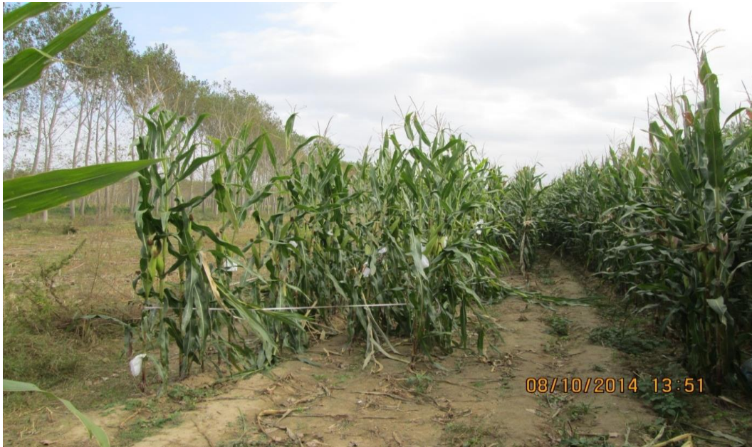
Şekil 1. Silajlık mısır bitkisi deneme alanı

Çalışmanın ana materyalini Kırklareli ili Babaeski ilçesi Hazinedar Köyü'nde yetiştirilen II. ürün mısır bitkisi oluşturmuştur (Şekil 1). Çalışmada katkı maddesi olarak homofermantatif ( ho LAB) ve heterofermantatif ( het LAB) laktik asit bakterilerini içeren 2 ticari inokulant kullanılmıştır. İnokulantlar silajlara 6.00 log 10 cfu/g düzeyinde katılmıştır. Araştırma materyali hasat öncesi ve hasat sonrası olmak üzere kontrol, ho LAB ve het LAB inokulant uygulaması içeren olmak üzere 3 deneme grubuna bölünmüştür. İnokulantların uygulanmasında firma önerileri dikkate alınmıştır. İnokulantlar hasattan 15 ve 7 gün olmak üzere 2 farklı dönemde tarlada mısırlara el tipi pülverizatör yardımı ile atılmıştır. Hasat öncesi ve sonrasını karşılaştırmak amacıyla, hasat dönemi geldiğinde yine kontrol, ho LAB ve het LAB inokulant uygulamaları yapılmıştır. Hasat öncesi ve hasat sonrası gruplarını içeren uygulamalara ait muameleler CASCVP 260PD marka laboratuvar tipi paket silaj makinası ile paketlenmiştir. Her muameleye ait 3'er paket silajın kullanıldığı çalışmada, silajların paketlenmesinden sonra materyaller laboratuvar koşullarında (20-22 °C) depolanmıştır.