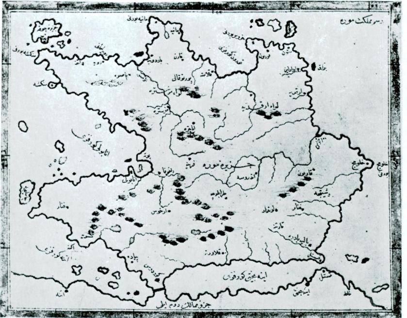
9 — Resm-i memleket-i Mora (Kâtip Çelebi, Cihannümâ, ayn. yerde, var. 286)