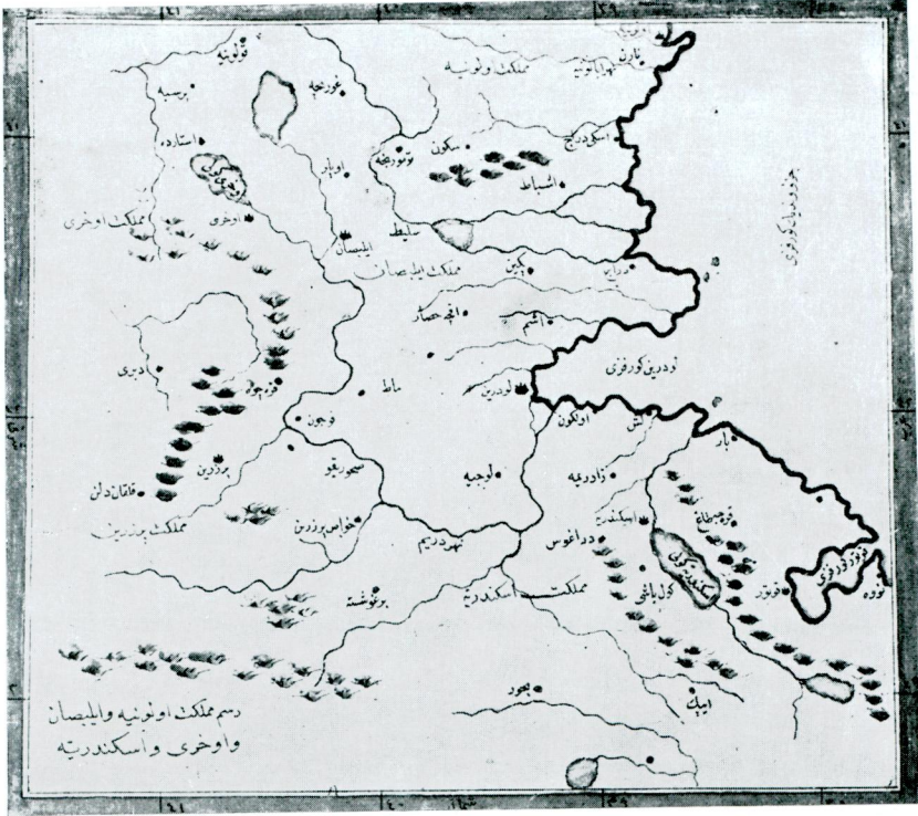
13 — Resm-i memleket-i Avlonya ve İlbasan ve Ohri ve İskenderiye (aynı eser, aynı yer, var. 294).