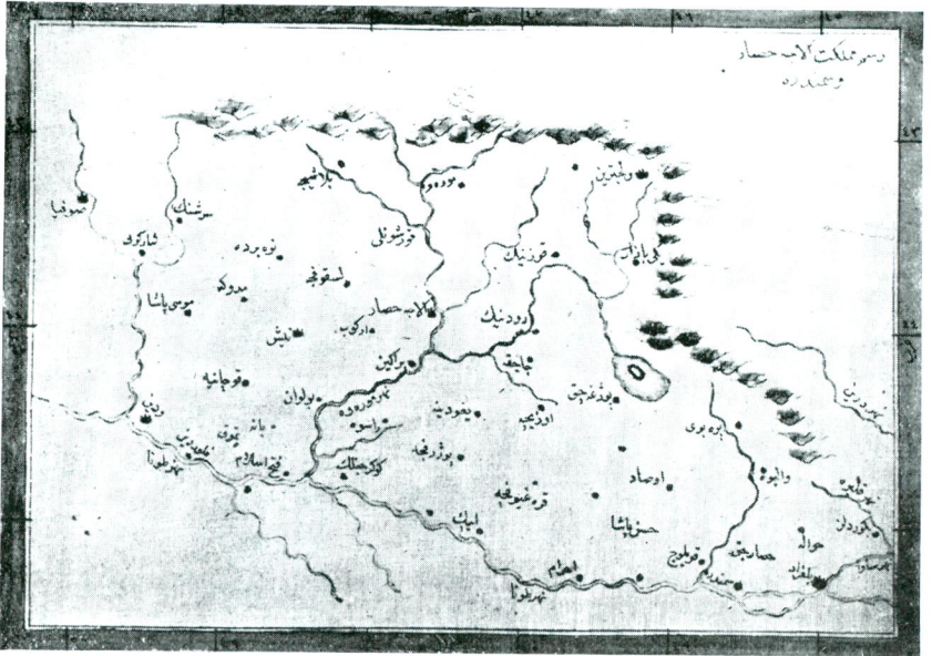
16 — Resm-i memleket-i Alaca-Hisar ve Semendire (aynı eser, aynı yer, var. 302).