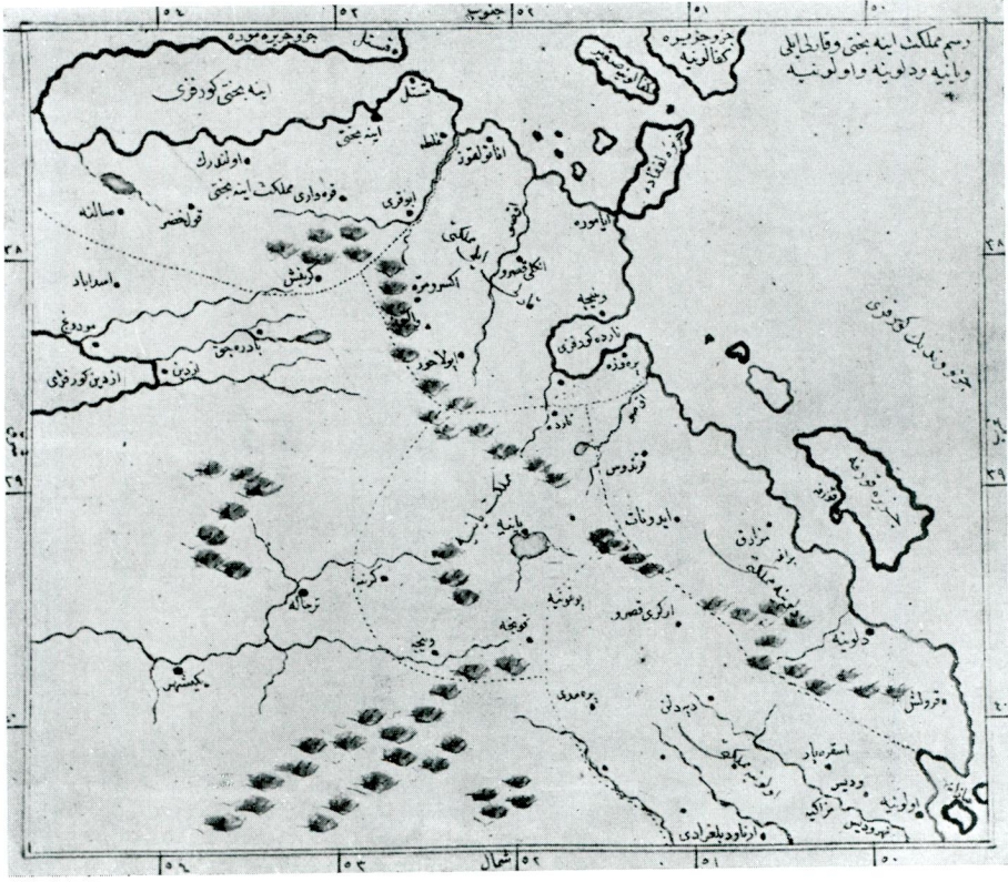
10 — Resm-i memleket-i İnebahtı ve Karlı-ili ve Yanya ve Delvine ve Avlonya (aynı eser, aynı yer, var. 290).