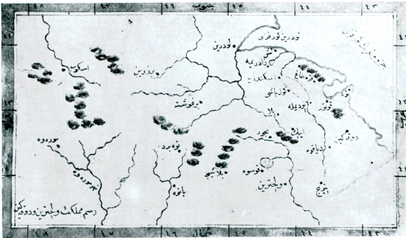
14 — Resm-i memleket-i Vulçtrin ve Dukagin (aynı eser, aynı yer, var. 297).