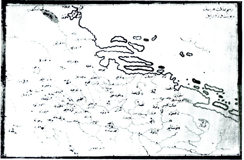
15 — Resm-i memleket-i Hersek ve Bosna ve Izvornik (aynı eser, aynı yer, var. 298).