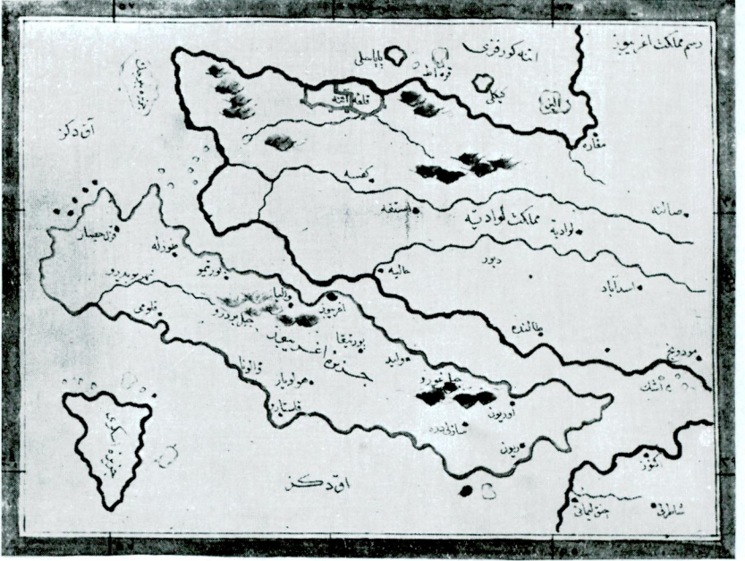
8 — Resm-i memleket-i Ağrıboz (Cihannümâ, Topkapı Sarayı Ktb., Revan Köşkü, No. 1629, var. 283).