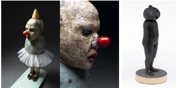
Görsel 15. Üzerinde çeşitli imgeleri barındıran, kendiliğine yabancılaşmış figür, seramik heykel, "Palyaço", Tom Bartel 2017, (solda).

Tom Bartel, gizemli bir kavrama atıfta bulunan, yüzeyi çatlaklardan oluşan figüratif seramik heykeller biçimlendirmektedir. Zamanın erimesi ve mekânların çürüyerek yok olması üzerinden gözlemde bulunan Bartel, bireyin süreçler içerisinde nasıl değiştiğini ve dönüşerek yok oluşa doğru yönelişini incelemektedir. Süreçler içerisinde değişen varlıkların anlamlandırılmasını heykellerinin sentez görünümü ile ifade etmektedir. Yaşam boyunca, kaçınılmaz sarsıcı olguların ve bilgi birikimlerinin, insanı nasıl etkilediğine dair bir metafor oluşturmuştur. Heykellerinde çeşitli yaşam süreçlerinin imgelerini yansıtan Bartel, birçok statüye ayrılan bireylerin, eylem özgünlüğünden uzaklaşarak yabancılaşmasını konu almaktadır. Kendine özgü ifadeleri barındıran her heykel, sosyolojik araştırmalar ile antropomorfiği içermektedir. Tarihsel alanın çok yönlü anlamlandırmalarını, kavramsal boyutta değerlendiren Bartel, yaşam içerisinde kütleleşen her imgenin, kendinde taşıdığı anlam karmaşasını ortaya çıkarmıştır. Bu karmaşanın içerisinde, uzaklaşma eylemi ile soyutlanmaya yönelen her bireyin, yaşama kaşı yabancılaşan ifadesini, heykellerinin imgeler ile yüklü donuk ifadesi üzerinden aktarmıştır.