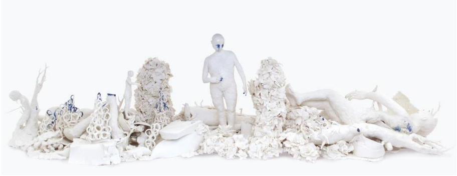
Görsel 5. Birçok parçadan, bütünü oluşturan duygulanımlar, figüratif soyut, porselen çalışma, "Barok ve Berserk (çığına dönüşmek)", Claire Curneen 2017, ( https://www.liverpoolmuseums.org.uk/13/11/2022 ).

Yabancılaşmanın, yalnızlaşmanın, nitekim yok olmanın getirdiği ruhsal acı duygulanımını ve feda etmenin evrensel karmaşasını biçimlendirdiği porselen figürlerine yansıtan Claire Curneen, porselenin yarı saydam ve kırılabilir yapısını içinde kaosu taşıyan bireyler ile ilişkilendirmiştir. Spesifik bir varlık olarak değerlendirdiği insan duygulanımlarını, sanat ifadesi olarak konu almış ve cinsiyetsiz bir biçimde incelemiştir. Sıfatlara ayrılmanın, bireyin kendi kimliğine yabancılaşmasındaki etkisini, inanç imgeleri ile bütünleştirmiş ve zihnin var olan gerçekliği üzerinden sanat nesnesine aktarmıştır. İnsanın var olduğu görünür dünya üzerindeki bulanıklaşan kimliğini, yaşam içerisinde yüklenen zorlayıcı imgelerde aramıştır. Yabancılaşma durumunu, yaşam içerisinde belirli ritüellerden gözlemleyen sanatçı, zorunda hissedilenin üstüne gidilmesi ile yaratılmış bir yok oluşu sergilemiştir. İnanılmaz derecede güçlü olabilen doğal yapının, nasıl kırılabilir olduğunu irdelemiş, belirli olgular ile törpülenerek değiştirilen ve dönüştürülen içeriğin üzerinde durmuştur.