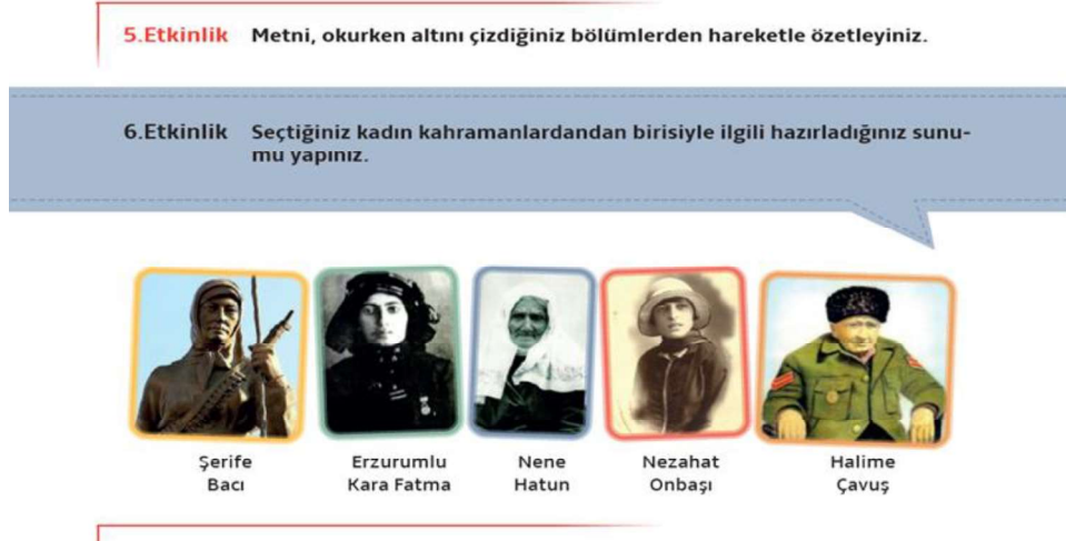
Şekil 3. Farklaştırılmış Etkinlik Örneği (7. Sınıf)

Şekil 3'teki etkinlikte, öğrencilerden kadın kahramanlarla ilgili araştırma yapmaları ve araştırmalarını sunmaları istenirken beş farklı seçenek sunulmuş olarak öğrencilerin ilgi ve istekleri göz önünde bulundurulmuştur.