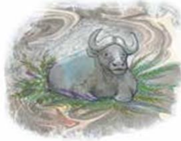
Şekil 2: Kürdan Kız Adlı Öykünün Girişinde Sunulan Görsel

Kitabın son öyküsü, ikinci bölüme de ismini veren Kürdan Kız 'dır. Öyküde çocuk okuyuculara sinematografi tekniğinin güzel bir örneği sunulmaktadır. Doğrudan olayla başlayan öykü önce ipucu niteliğindeki bir görselle desteklenir.