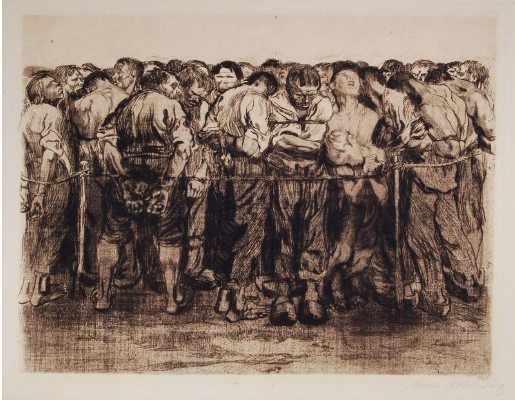
Resim 1. Käthe Kollwitz "Tutuklular" Käthe Kollwitz müzesi, Köln, Almanya, 1908

eser de bu çarpıcı imgelerdendir. Bu eserde yer alan her bir figür, anlam yönünden, sanki bir diğerini pekiştirmek için vardır. Yüzlerindeki ifadeler istisnasız belli bir olaya vurgu yapmaktadır. Dış görünüşleri itibarıyla figürler arasında ciddi bir benzerlik vardır. Duygular, algıya dayalı bir yanılsamaya sebep olan bu tekrar ve çoğaltmaları belli bir oranda gerçeğe dönüştürür. Bunun nedenlerinden biri, gözün form veya çizgiye dayalı oyunları, bütün detaylarıyla takip edemeyişidir. Bu anlamdaki görme eylemi, belli bir alanla sınırlı kalmaktadır. Ünlü sanat eleştirmeni Berger bu konu ile ilgili şöyle bir ifade kullanmıştır; ‘Yalnızca baktığımız şeyleri görürüz. Bakmak bir seçme edimidir (J.Berger,1986:8)’. İşte bu seçme edimi veya sadece belli bir alana bakma, kişinin imgedeki benzer diğer nesne ve figürleri aynı anda algılamasını zorlaştırır. Bu zorlaştırma durumu, görsel imgenin bir bütün olarak okunması veya saptanmasını engeller. Engelleme işlemi ise yukarıda bahsettiğimiz illüzyon olgusunun güçlü bir şekilde varlık bulmasına yardım eder. Tutuklular adlı eser de bu türden bir düzenleme ile oluşturulmuştur.