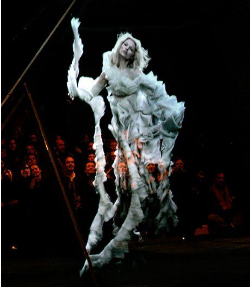
Fotograf 14. Alexander McQueen – 2006, Kate Moss.

http://tr.pinterest.com/pin/456482112202862615/ , adresinden 14 mart 2104 tarihinde alınmıştır.