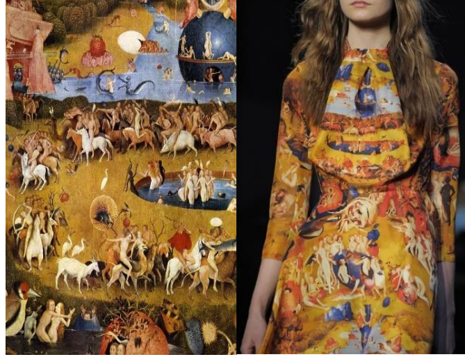
Fotoğraf 4. Hieronymous Bosch 1504-1510 / Carven 2012-Hieronymous Bosch 1504-1510 / Carven 2012 Carven, http://tr.pinterest.com/pin/456622849688598905/ , adresinden 21 Temmuz 2014 tarihinde alınmıştır.