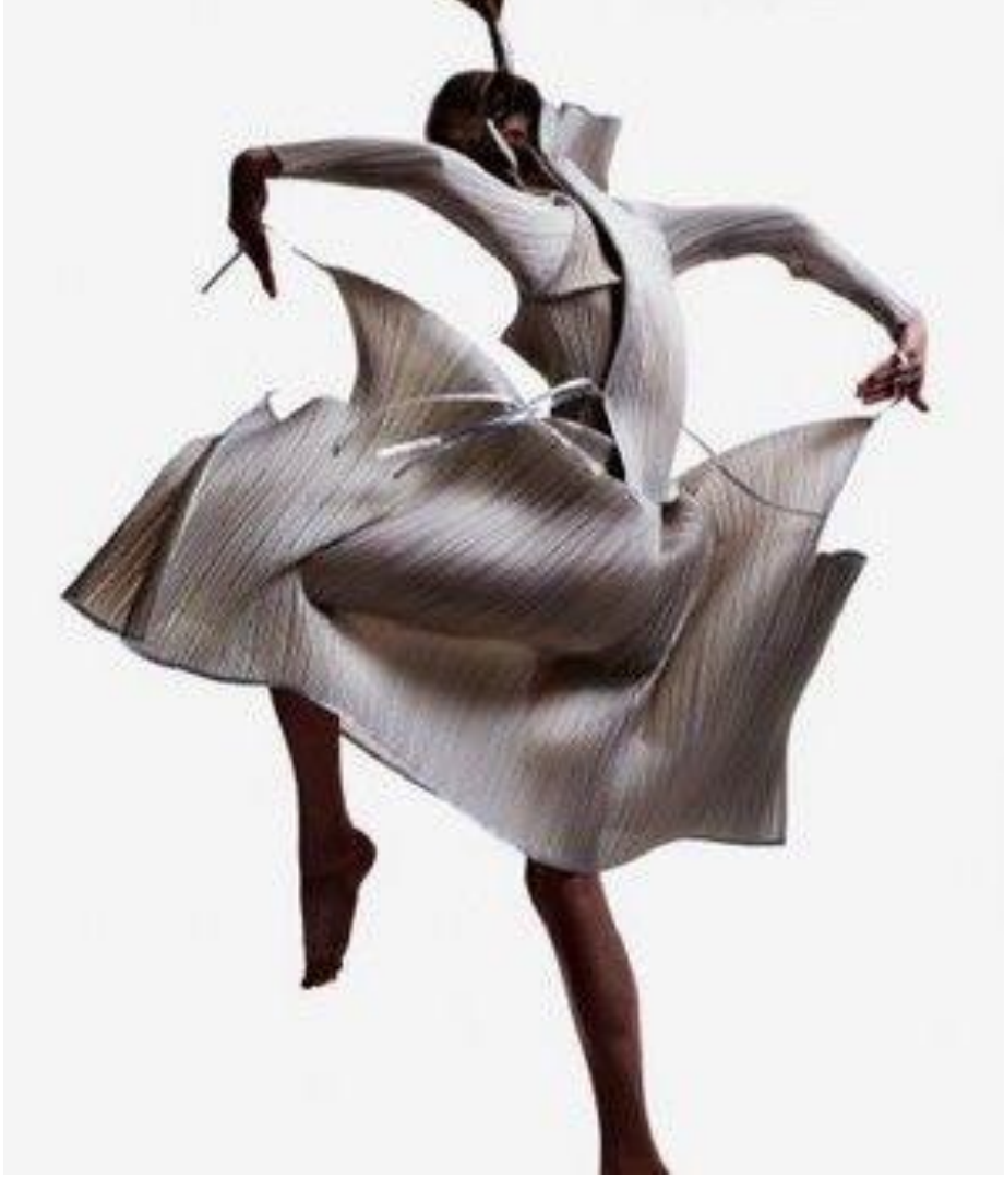
Fotoğraf 7. Issey Miyake 1993 "Pleats Please", http://tr.pinterest.com/pin/246853623296317109/ , adresinden 21 Mayıs 2014 tarihinde alınmıştır.

Batılı modernite kavramını egemen kılan "bedeni hapsedme" görüşü ünlü İngiliz moda tasarımcısı Alexander McQueen'in 2006 giysi koleksiyonunun tanıtımında Beden Sanatı (Body Art) ile Performance \ Performans sanatını birleştirir nitelikte olmuştur. Sanatçı, ünlü İngiliz model Kate Moss'u seyircilerin de görebileceği şekilde şeffaf bir holograma hapsederek kadın bedenini adeta bir kapalı kutu içine hapsedmiştir (Fotoğraf 8).