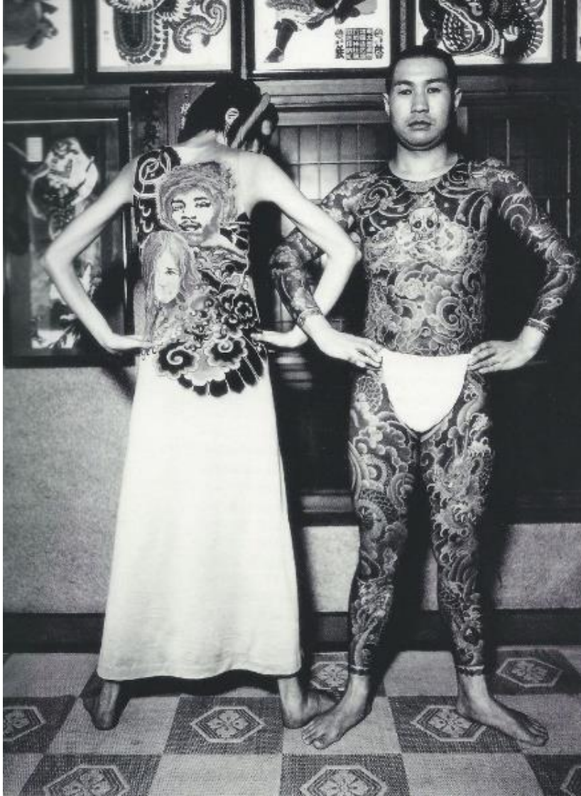
Fotoğraf 6. Issey Miyake, http://www.tumblr.com/search/jimi%20hendrix%20tattoo , adresinden 14 Mayıs 2014 tarihinde alınmıştır.

koleksiyonunda kullandığı elbise tasarımı, vücut dövmelelerinin kumaş ile bedeni bütünmüş gibi gösteren formuyla dikkat çekicidir. Sanatçı, hazırladığı bu giysi tasarımında Beden Sanatının tekstil sanatına uyarlaması yapılmış en güzel örneklerinden birini sergilemiştir (Fotoğraf 6).