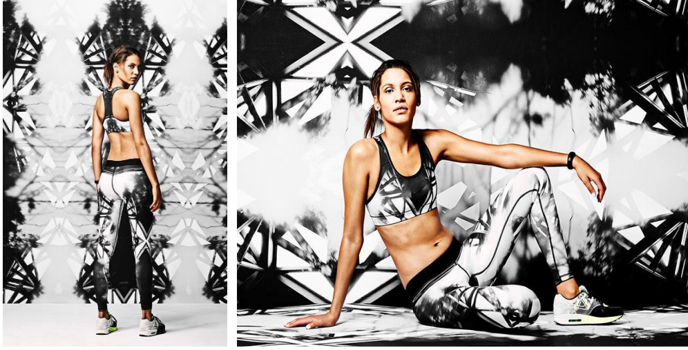
Fotoğraf 9. Nike – 2014, http://www.nike.com/us/en_us/launch/c/2014-08/nike-tight-of-the-moment-foco-bonito , adresinden 18 Ağustos 2014 tarihinde alınmıştır.