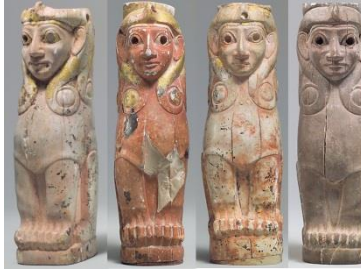
Resim 4. Asur Ticaret Kolonileri Çağı, Acemhöyük, Fildişi dişi sfenks heykelcikleri (Metropolitan Sanat Müzesi, Pratt Koleksiyonu)