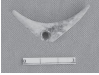
Resim 1. Üst Paleolitik Çağ, Karain Mağarası, Bumerang biçimli fildişi kolye (Yalçınkaya vd. 2015: 448, resim 2)