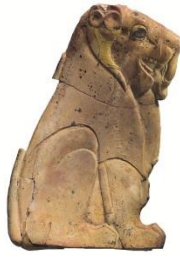
Resim 5. Asur Ticaret Kolonileri Çağı, Acemhöyük, Oturan aslan kabartmalı fildişi plak (Metropolitan Sanat Müzesi, Pratt Koleksiyonu)