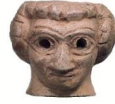
Resim 3. Asur Ticaret Kolonileri Çağı, Acemhöyük, Fildişi kadın başı (Metropolitan Sanat Müzesi, Pratt Koleksiyonu)