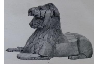
Resim 17. Urartu, Altın-tepe, Fildişi yatan aslan heykelciği (Özgüç 1969: 44-45; Lev. XXXVIII, 1)