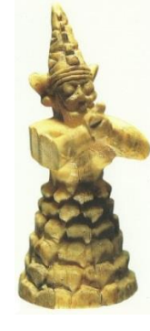
Resim 9. Hitit İmparatorluk Çağı, Boğazköy, Fildişi dağ tanrısı heykelciği (N. Özgüç 2002: 245, abb. 3)