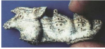
Resim 19. Lidya, Sardes, At koşum takımına ait fildişi geyik (Dusinberre 2010: Res. 1)