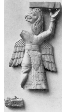
Resim 14. Urartu, Toprakkale, Fildişi kartal başlı grifon (Barnett 1950: pl.XV, 1)