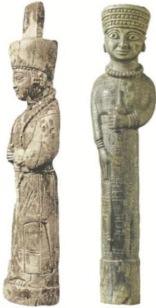
Resim 21. Lidya, Efes Artemis Tapınağı, Fildişi erkek heykelcikleri (Bilgi 2012: 593, res. 1209, 1210)