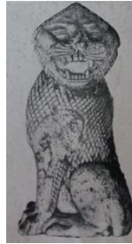
Resim 16. Urartu, Altın-tepe, Fildişi oturan aslan heykelciği (Özgüç 1969: 42; Lev. XXXIV, 1)