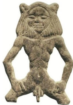
Resim 8. Hitit Krallık Çağı, Alacahöyük, Fildişinden ayakta duran Tanrı Bes heykelciği (Bilgi 2012: 390, res. 1090)