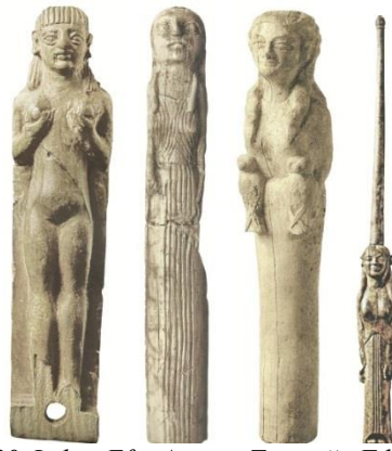
Resim 20. Lidya, Efes Artemis Tapınağı, Fildişi adak heykelcikleri (Bilgi 2012: 588, res. 1195, 1197, 1204, 1205)