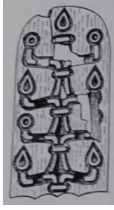
Çizim 1. Urartu, Altuntepe, Fildişi hayat ağacı plaka (Özgüç 1969: 56; Res. 57)