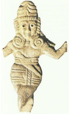
Resim 10. Hitit İmparatorluk Çağı, Boğazköy, Fildişi dans eden savaşçı tanrı heykelciği (Seeher 2002: 168, res. 152)