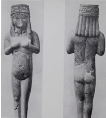
Resim 12. Urartu, Toprakkale, Fildişinden çıplak kadın heykelciği (van Loon 1966: 132, pl. XXXIV)