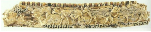
Resim 18. Frig, Kerkenes Dağ, İşlenmiş fildişi levha (Summers ve Summers 2007: 122)