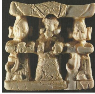
Resim 11. Hitit İmparatorluk Çağı, Boğazköy, Fildişi üçlü tanrı grubu plakı (N. Özgüç 2002: 244, abb. 1)