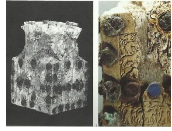
Resim 6. Asur Ticaret Kolonileri Çağı, Acemhöyük, Fildişinden yapılmış tasvirli kutusu (N. Özgüç 2002: 246, abb. 6-7)