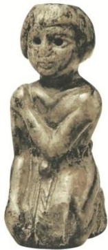
Resim 7. Hitit Krallık Çağı, Alacahöyük, Dizleri üzerine çökmüş çocuk görünümündeki fildişi heykelcik (Bilgi 2012: 390, res. 1089)