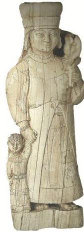
Resim 22. Lidya, Elmalı-Bayındır D Tümülüstü, Fildişi kadın heykelciği (Bilgi 2012: 588, res. 1206)