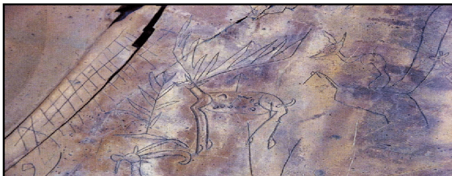
Карс кілемі үстіндегі киік және тау ешкі мотиві

Карс чаллы. Кіші суретте оқпен атылған үстінде таңбасы бар киік