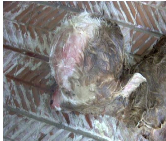
Şekil 6. Buzağıda hydrocephalus.

Extremite Anomalileri: Vakaların içinde en sık görülen grubu oluşturdu. 26 erkek (%22.60), 16 dişi