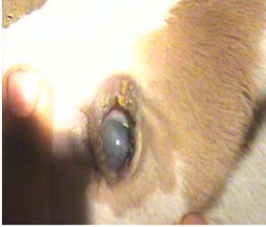
Şekil 3. Buzağıda kongenital Katarakt.