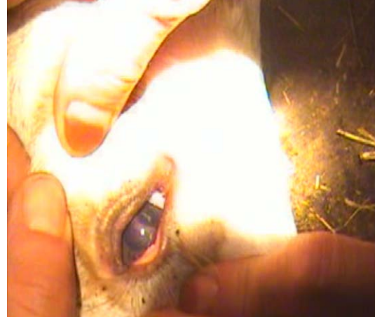
Şekil 4. Buzağıda persistant pupillar membran.

Karın-Bağırsak Anomalileri: Suni tohumlama sonrası doğan 12'si erkek (%10.43), yedisi dişi (%6.08) 19 buzağıda (%16.52) barsak anomalisi gözlemlendi. Bu olguların 3'ünde atresia rekti (%2.60), 5'inde atresia ani (%4.34), 4'ünde atresia coli (%3.47), 7'sinde ise şiştosoma refleksüm (%6.08) tespit edildi. Atresia anili vakalardan 2'sinde anal bölgeye "+" ensizyon uygulanmış, rektum açığa çıkarılarak anüse ağızlaştırılmış ve post operatif kontrollerde hayvanlar yaşamlarını sürdürmesinde sorun şekillenmemiştir. Diğer atresia anili olgu ile tüm atresia rekti ve coli hayvan sahibinin ekonomik düşünmesi nedeni ile müdahale edilmedi. Bağırsak evantrasyonu görülen yedi olgudan dört tanesi iki gün içerisinde öldü, üç olguya cerrahi müdahale uygulandı. Müdahale edilen üç olgudan biri bir hafta sonra öldü, diğer ikisi ise normal sağlığına kavuştu.