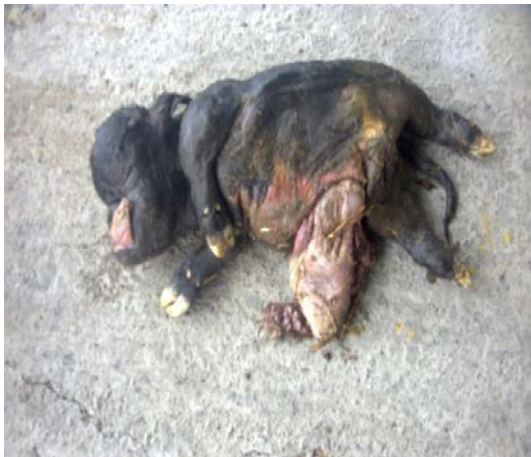
Şekil 5. Buzağıda chondrodystrophia.

(%13.04), 3'ünde kongenital katarakt (%2.60), 2'sinde ise persistant pupillar membran (%1.73) saptandı. Muayeneler, gün ışığında direkt olarak veya endirekt olarak ışık kaynağı ile yapıldı. Amaurosis teşhisinde yürütme deneyi ve göze önünde el hareketine verilen reflexin kontrolü yapıldı. Amaurozisli hayvanlara 3cc A vitamini ilk üç gün günlük, sonraki bir ay haftalık, sonraki ay onbeş günde bir toplam dokuz kas içi uygulama ve ilk bir hafta süre ile göze iki damla şeklinde kullanımı tavsiye edildi. Tavsiyeye edilen şekilde uygulama yapılan 10 olgudan 6'sında tam, 1'inde kısmi bir görüşün sağlandığı, 3'ünün ise tedaviye cevap vermediği belirlendi. Kist dermoid belirlenen 15 buzağının sekizinde hasta sahiplerinin isteği üzerinde operasyon gerçekleştirilmiş 5'inde tam görüş sağlanmıştır. Kongenital katarakt; birinde doğum sırasında, diğer ikisinde ise üç haftalık iken teşhis edildi. Persistent retinal membranın; olguların birinde tek (sol göz), diğerinde çift taraflı olduğu, kısmi bir görüşe sahip olduğu belirlendi.