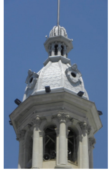
Saat Kulesinin Örtü Kısmı.