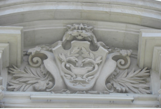
Belediye Binası, Pencere Alınlıklarında Yer Alan Armalardan.

Alınlıklardan bir diğesinde, aslanın açık ağızında bu kez iletke, gönye gibi geometride kullanılan araçlarla, çekiç ve kazma gibi işgücünde kullanılan araçlar bir araya getirilerek adeta, eğitimli sınıfla işçi sınıfının her ikisinin de önemine bir arada vurgu yapılmış, hem eğitimin ve ilmi araştırmaların hem de işgücü ve emekle çalışıp üretmenin değerli olduğunun altı çizilmeye çalışılmıştır. Bu arma da, çevresindeki floral süslerle Art-Nouveau karakteri kazanmıştır.