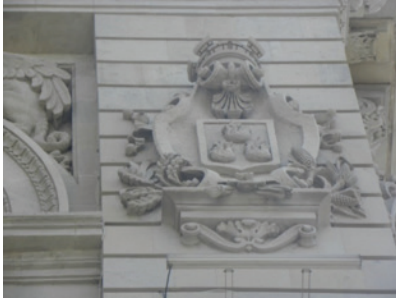
Cephedeki Süslemelerden Ayrıntı.