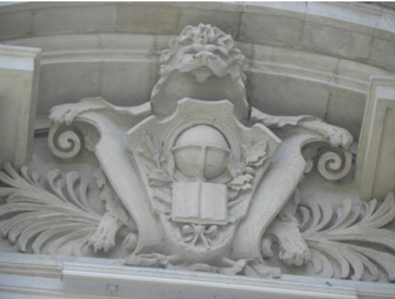
Belediye Binası, Pencere Alınlıklarında Yer Alan Armalardan.

Alınlık kabartmalarından bir diğeri, bitki dal ve yaprakları arasından süzülen karşılıklı iki yılanın, bir kase içerisine zehirlerini (derman) akıtışını konu alır. Çevresi doğa kaynaklı bitkilerle kuşatılmış bu armada; sağlık ve tıp sembolü yılanların doğadan aldıklarını bir kasede biriktirmeleri, ikonografik olarak doğanın ve doğadaki bitkilerin, insan sağlığının ve tedavide kullanılan ilaçların kaynağı olduğunu vurgulamaktadır.