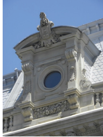
Saat Kulesi Formunda İşlenmiş Çatı Saçağı Alınlığı.