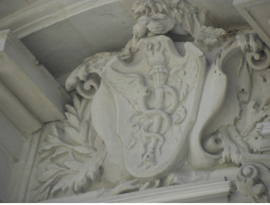
Belediye Binası, Pencere Alınlıklarında Yer Alan Armalardan.

Pencere alınlık tablalarına işlenmiş armalar arasında en dikkat çekicilerinden biri, açık ağızlı bir aslanın ağızı içerisinde yer alan madalyondur. Kabartma heykel tarzında ele alınan bu armada, bir meşale etrafına karşılıklı dolanmış kanatlı yılan figürlerine yer verilmiştir. Bu yılanlı arma, sağlık ve tıp sembolü olarak, Türk ve dünya kültür tarihinde önemli yer tutar. Armanın çevresini saran aşırı plastik bitkisel dekorasyon, bu süslemeye Neobarok ve Art-Nouveau karakter kazandırır.