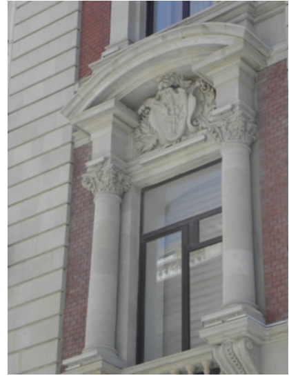
Cephede Yer Alan Pencereleden.

Yapı cephelerine Neo-barok karakter kazandıran en önemli unsurlar hiç şüphesiz, korint başlıklı plasterler üzerine, iç-içe profillerden yuvarlak kemer alınlıklı ve her bir alınlığın tabla kısmında farklı