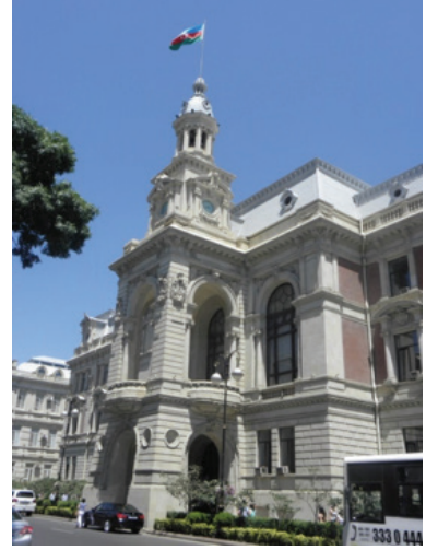
Belediye Binası, Saat Kulesi Şeklinde Tasarlanmış Giriş Bölümü

Cephelerde yatay ve dikey hatlardan oluşan aksiyal görüntü ve simetrik düzen Neo-klasik bir karakter yansıtırken, yüzeyden aşırı taşkın ve plastik bir şekilde işlenmiş kalın profilli kuşakların, iç-içe profillerden oluşan ve yüzeyden ileri fırlayan yuvarlak kemer formundaki pencere alınlıklarının, alınlık tablolarındaki aşırı plastik bir şekilde işlenmiş figürlü ve bitkisel unsurlardan oluşan armaların ve giriş bölümündeki aşırı hareketli mimari anlayış sergileyen saat kulesinin cephede yarattığı ışık -gölge kontrastı, hareketlilik ve gösteriş Neo-barok mimari tarzın yapıya egemen olduğunu ortaya koymaktadır. Ayrıca, aşırı plastik şekilde işlenmiş floral ağırlıklı süs unsurları da Art-Nouveau tarzı mimari cephe anlayışının özellikleri olarak dikkati çeker. Dolayısıyla yapıda; Neo-Barok, Art-Nouveau ve az da olsa Neo-klasik mimari üsluplarının kaynaşımından oluşan, eklektik bir cephe düzeni söz konusudur.