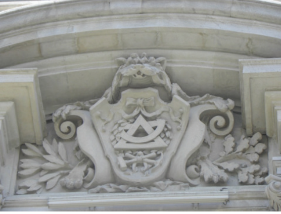
Belediye Binası, Pencere Alınlıklarında Yer Alan Armalardan.

Alınlıklardan bir diğesinde, aslanın açık ağızında bu kez iletke, gönye gibi geometride kullanılan araçlarla, çekiç ve kazma gibi işgücünde kullanılan araçlar bir araya getirilerek adeta, eğitimli sınıfla işçi sınıfının her ikisinin de önemine bir arada vurgu yapılmış, hem eğitimin ve ilmi araştırmaların hem de işgücü ve emekle çalışıp üretmenin değerli olduğunun altı çizilmeye çalışılmıştır. Bu arma da, çevresindeki floral süslerle Art-Nouveau karakteri kazanmıştır.