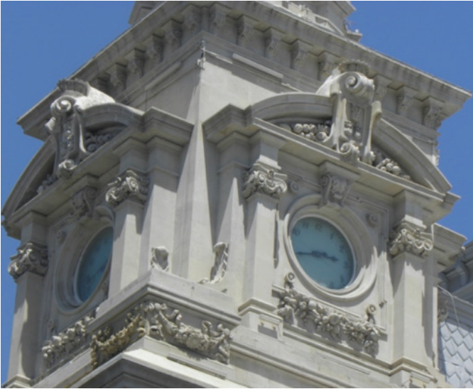
Saat Kulesinin Zemin Üstü İkinci Katı.