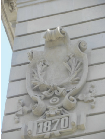
Bina Üzerinde Yer Alan Kitabe.