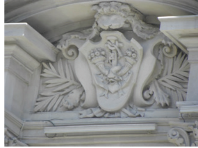
Cephedeki Süslemelerden Ayrıntı.