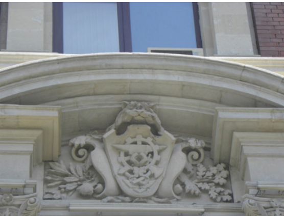
Belediye Binası, Pencere Alınlıklarında Yer Alan Armalardan.

Pencere alınlıklarındaki bir başka armada, yine bir aslanın açık ağızı içerisinde, gemi çapası, gemi hatlatı, meyve kaseleri içerisinde meyve ve çiçek demetleri, kurdale motifleriyle birlikte teknoloji ürünleriyle doğa ürünlerinin kaynaşımını yansıtan Art-Nouveau üslubunda bir süsleme tarzı söz konusudur. Bu motiflerin yüzeyden kabarık ve heykelsi biçimde işlenişleri cephede aşırı ışık-gölge kontrastına ve hareketli görünüme sebep olduğu için, aynı zamanda Neo-barok bir süsleme tarzı da ortaya çıkmaktadır.