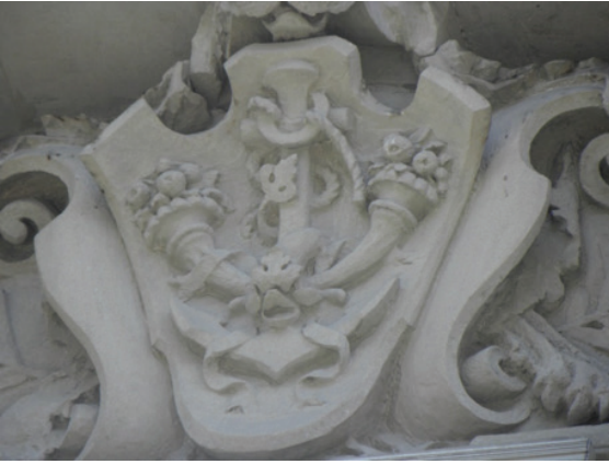
Belediye Binası, Pencere Alınlıklarında Yer Alan Armalardan.

Pencere alınlık tablalarına işlenmiş armalar arasında en dikkat çekicilerinden biri, açık ağızlı bir aslanın ağızı içerisinde yer alan madalyondur. Kabartma heykel tarzında ele alınan bu armada, bir meşale etrafına karşılıklı dolanmış kanatlı yılan figürlerine yer verilmiştir. Bu yılanlı arma, sağlık ve tıp sembolü olarak, Türk ve dünya kültür tarihinde önemli yer tutar. Armanın çevresini saran aşırı plastik bitkisel dekorasyon, bu süslemeye Neobarok ve Art-Nouveau karakter kazandırır.