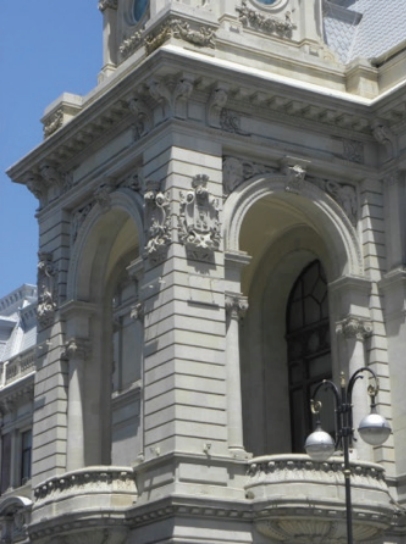
Belediye Binası, Saat Kulesi Şeklinde Tasarlanmış Girişten Ayrıntı.