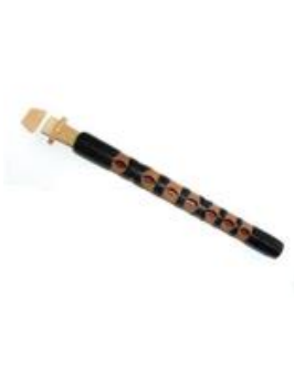
Şekil 4a. Hichiriki (Japonya)

Doğu'nun farklı coğrafyalarında farklı kültürler ile yoğrularak değişik formlar ve isimler olarak kullanılmıştır. Aşağıdaki şekilde mey benzeri sazlara örnek görüntüler yer almaktadır. Aşağıdaki şekillerde bunlara örnekler verilmiştir.