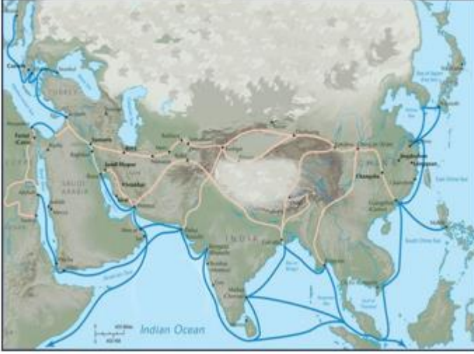
Şekil 5. Mey ve Benzeri Çalgıların Göç Haritası (URL-2)

Mey sazının diyatonik bir ses dizilimi olması sebebi ile icrasında birçok sıkıntılar mevcuttur. Ayrıca ses aralığı dar olması münasebetiyle birçok yörede kullanımı daralmıştır. Ancak bu sızılı ve etkileyici sazı, unutmak ve kullanmamak imkânsızdır. Anadolu insanının yüreğini parçalayan, derdine derman olan, uzun hava açışlarıyla iz bırakan mey sazının eşlik ettiği birçok türkü mevcuttur.