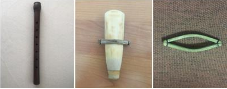
Şekil 3a. Gövde

yapıldığı gibi, asma ağacı, söğüt dalı, fındık dalı tercih edilir. Yapılan bu parçalara kıskaç ismi verilir. Kıskaç isminin söylendiği gibi maşa, kelepçe ismiyle de söylenir. Kamışın uç kısımlarının kalıbını koruyan parçaya başlık denir. En büyük görevi dış etmenlere karşı kamışın ucunu korumaya alır. Aşağıdaki şekillerde gövde, kamış ve kıskaç görünümü yer almaktadır.