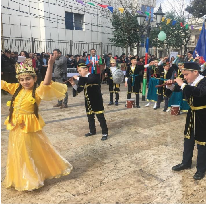
Şekil 6. Azerbaycan’da Nevroz Bayramından Bir Görünüm

Şekil 6’da balaban çalgısının sıklıkla icra edildiği Azerbaycan’da çekilen görüntüler yer almaktadır. Ülkede bu sazların kullanışı küçük yaşlardan başladığı ve ülke kimliklerinde bu saza verilen önemi görmekteyiz.