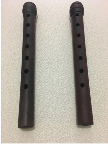
Şekil 2. FA diyez Perdelerinin Görünümü

çalışılmıştır. Unutulmamalıdır ki doğru açılmış ölçü olsa bu durumlara hiç gerek kalmayacaktır.