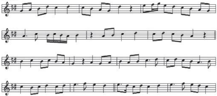
Şekil 9. Hicaz Hümayun Peşrev (Türk Sanat Müziği Seçme Eserler 2, 2000: 82-83)