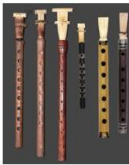
Şekil 4b. Hyanpiri (Kore)