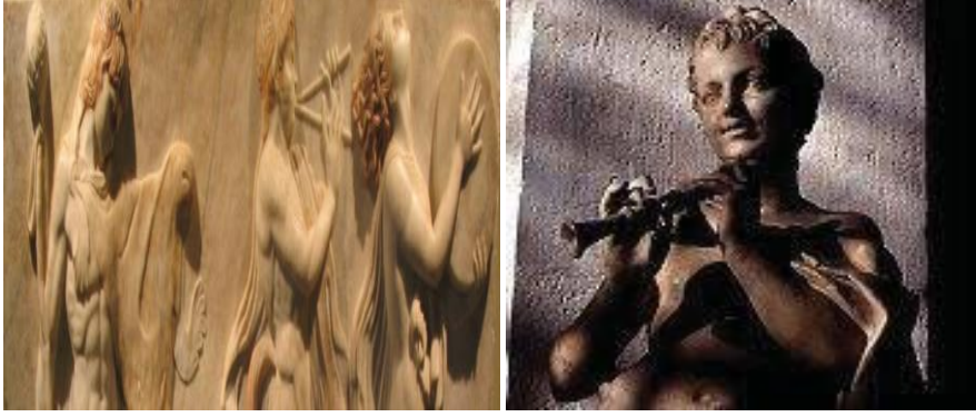
Şekil 1. Tarihsel Helenistik Dönem Çalgısı Monaulos (URL-1)

Şekil 1’ de görüldüğü üzere çalgıların Helenistik çağı Mısır kalıntıları arasında bulunan “monaulos” ile yakın bir bağlarının olduğu ifade edilmektedir. Şahin’e göre, İngiliz araştırmacı Picken’in de bu konuda, meyın ve Azerbaycan’da kendisine çok benzeyen kamış borulu (balaman), Sovyet Ermenistan (duduk), Gürcistan (duduki), Dağıstan (balaban)’ın Antik çağın son dönemlerine ait monaulos ile ilişkisi olduğuna dair görüşleri bulunmaktadır. Anadolu’ da yapılan kazı çalışmalarında da mey sazına benzeyen çalgılara rastlandığı görülmektedir (Şahin, 2018: 64).