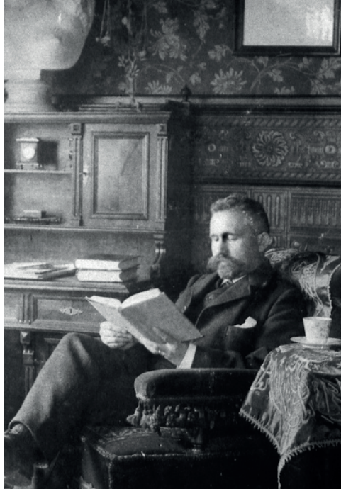
Şekil 6. Max Planck Psikiyatri Enstitüsü ve Ludwig Maximilian Üniversitesi Psikiyatri Kliniği’ni kuran Emil Kraepelin. Solundaki masanın örtüsü ve üzerindeki cezve dikkat çekicidir. Max-Planck-Institut für Psychiatrie, Historisches Archiv, Münih.

2001) 117 Bakırköy’de DSM-III’ün tanıtımı ve kullanımının öncülüğünü yaparak Kraepelinçi yaklaşımın yeniden yaygınlık kazanmasında önemli rol oynamıştır. Bu dönemde psikiyatri eğitiminde de ağırlık psikofarmakoloji, beyin görüntüleme, genetik ve bilişsel davranışçı psikoterapiler lehine ağırlık kazanmıştır. 118 Günümüzde psikiyatrinin Kraepelinçi dünyada yaşamaya devam ettiği gibi 119 Türkiye psikiyatrisinde de Kraepelin’in etkisi ve yaklaşımının egemenliğini sürdürdüğünü söylemek mümkün görünmektedir.