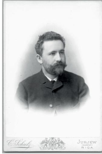
Şekil 1. Emil Kraepelin (1870–1926).

modern psikiyatrik tanımlar için, Kraepelin'in akıl hastalıklarını sınıflandırma sistemi önemli ölçüde katkıda bulundu. 30 Halen düşünceleri ve psikiyatriye yaklaşımı tartışılmaya devam eden Kraepelin'in hayatı ve çalışmaları konusunda uzmanlaşmış tarihçiler, Kraepelin'nin günümüzdeki imajı ile tarihsel Kraepelin'in farklı olduğuna dikkat çekerek, Kraepelin'i "beyin temelli ve katı bir nozolojik yaklaşıma sahip, psikoloji karşıtı görüşleri savunan, biyolojik psikiyatri taraftarı" şeklinde değerlendirmenin indirgemeci bir yaklaşım olduğunu belirtmektedir. 31