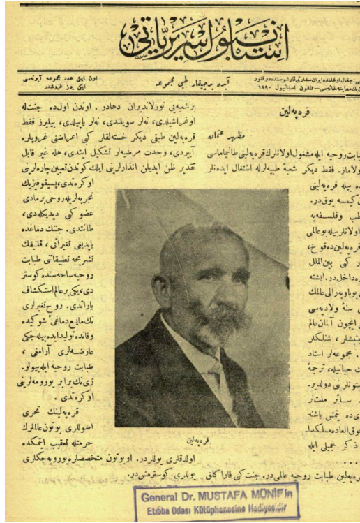
Şekil 4. İstanbul Seririyatı'nın Sene 7, Sayı 11, Mart 1926 kapağı (Kraepelin'in 70. Yaşgünü).

Mazhar Osman'a göre Kraepelin ruhsal hastalıkları gruplandırın, ruhu “maddi bir uzuv gibi didikleleyen” ve psikiyatrinin biyoloji ile birlikte yürümesini sağlayan kişidir: