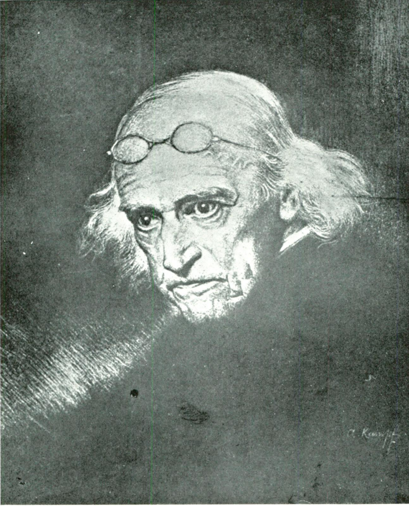
THEODOR MOMMSEN 1817 - 1903