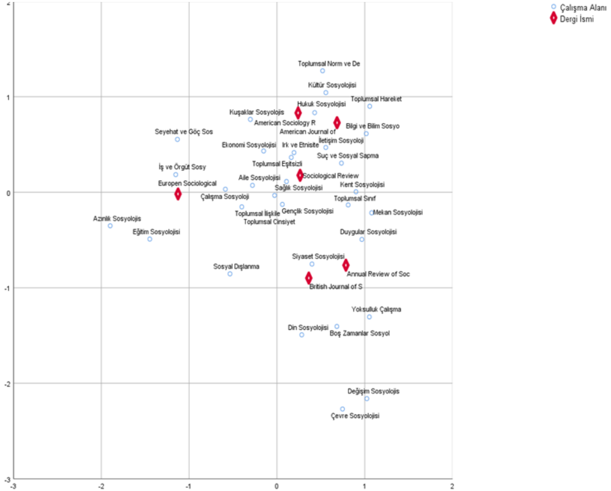
Şekil 2. Dergilere göre konu dağılımının uyum analizi

nitel, %13,6'sı ise teorik bir içeriğe sahiptir. Bu derginin ise nitel çalışmalara daha fazla ağırlık verdiği görülmektedir. ESR 'de çalışmaların %96,7'sinde nicel ve %3,3'ünde ise nitel yöntem kullanılmıştır. Bu dergide de nicel yöntemin son derece baskın olduğu söylenebilir. Son olarak BJS 'de yayımlanan makalelerin %46,4'ünde nicel, %46,4'ünde nitel ve %7,1'inde ise karma yöntem kullanılmıştır. Bu dergide de nicel ve nitel çalışmaların oransal olarak eşit olduğu söylenebilir.