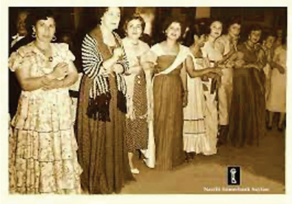
Şekil 2: Nazilli basma balosu (Adalığ, 2006)

Sümerbank'ın giyim-kuşam üzerine olan etkisini ortaya koyan bir diğer madde basma baloları olmuştur. Fabrikanın özellikle de Sümerbank Nazilli Basma Fabrikası'nın kendine özgü geleneklerinden bir tanesi olan Basma Baloları, fabrikanın Ulu Önder tarafından açıldığı 9 Ekim gecelerinin vazgeçilmez haline gelmiştir (Şekil 2). Basma balosu da ismini, o geceye katılacak olanların kıyafetlerinden almaktadır. Kadınlar geceye basmadan dikilen elbiseleri ile, erkeklerin takımları ise yine basmadan dikilen kravat ve yaka mendilleri ile süslenip tamamlanmaktadır (Adalığ, 2006: 5).