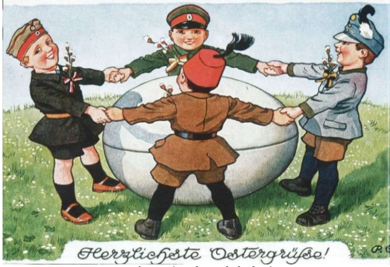
Resim 3: (Mutlu Paskalyalar!)

Kart, Almanca “Ich sei, gewährt mir dir Bitte, In eurem Bunde der Dritte!” [Bir dileğim var bahşedin bana, üçüncü olayım ittifakınızda!] alt başlığı kullanılarak bir metin ile zenginleştirilmiştir. Bu cümleler, F. Schiller’in Die Bürgerschaft (1798) adlı ünlü baladının son iki mısrasından alınmıştır. Tanınmış bir edebiyatçının, hakiki dostluğu ve fedakârlığı konu edinen edebi eserinden seçilen bu mısralar, görselin edebiyat ile buluşmasını sağlamıştır. Medyalararasılık olarak nitelendirilebilecek bu uygulama ile verilmek istenilen mesajın çağrışımsal gücü genişletilmiştir.