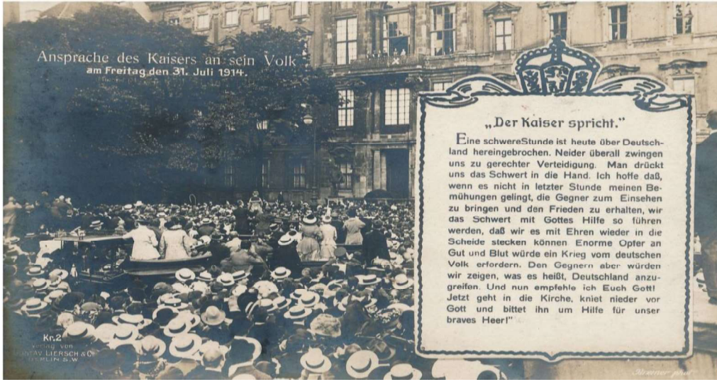
Resim 1: (Kayzer konuřuyor!)

I. Dünya Savařı'nda bol miktarda kartpostal kullanılması, devletlerin halka hızla iletiřim kurmakta ve mesaj iletmekte bunlardan etkin bir řekilde yararlanmaları sonucunu doğurmuřtur. Bu kartpostallar çoęunlukla karikatürize edilmiř görsellerden yararlanılarak hazırlanmıřtır. Ancak Resim 1'de (Spiegel Geschichte, 2015) gördüğümüz gibi kimi zaman anın görüntüsünü ve heyecanını doğrudan yansıtabilmek için gerçek fotoęraflar da kullanılmıřtır. Bu bağlamda kartpostallara, I. Dünya Savařı'nın kader anlarından biri olan II. Wilhelm'in konuřmasından örnek vererek başlanacaktır. Ardından gelecek kartpostallar ise Osmanlı/Türk imgesini yeniden kurgulamak amacıyla üretilmiř örneklerden oluřacaktır.