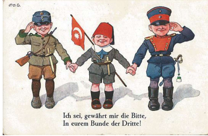
Resim 2: (Bir dileğim var bahşedin bana, üçüncü olayım ittifakınızda!)

Resim 2’de (Dortmund postkolonial, t.y.) bize göre sol başta Avusturya-Macaristan, ortada Osmanlı ve sağ başta Alman askeri üniforması giymiş üç çocuk görünmektedir. Mütebessim duran çocuklardan sol ve sağ başta olanlar kendilerinden daha kısa ve küçük çizilmiş bir diğer çocuğun elinden tutmaktadır. Silah olarak bellerinde tüfek, hançer ve kılıç taşıyan asker-çocuklardan Osmanlı çocuğunun yerleşik imgesi başındaki fes ile vurgulanmıştır. Bu ve diğer pek çok örnekte gözlemlendiği üzere, Osmanlı askerini daha kısa boylu çocuk temsil etmektedir ve kartın alt başlığı olan ifade onun ağzından çıkmaktadır. Bu bağlamda Osmanlı Devleti yardımı, korunmaya ve himayeye muhtaç olarak gösterilmektedir.