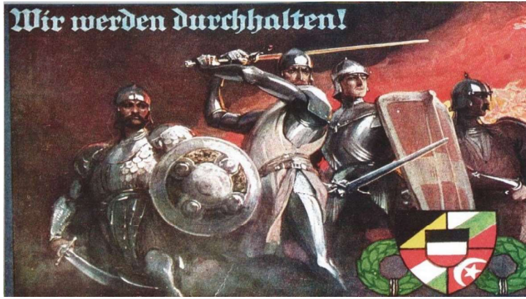
Resim 4: (Sonuna dek direneceğiz!)

Resim 4'te (Parlayan, 2014, s. 26) oldukça ilgi çekici bir görsel yer almaktadır. Alman, Macar, Avusturya ve Osmanlı askerlerinin tamamı şövalye zırhları içerisinde görünmektedir. “Wir werden durchhalten!” [Sonuna dek direneceğiz!] üst başlığıyla sunulan resmin sağ alt köşesinde ülke bayraklarını birbirine bağlayan ortak bir arma ve onun her iki yanında zaferi temsil eden çelenkler yer almaktadır. Alman askerini kılıcını havada kendine güvenle savururken, Osmanlı askerini ise arkada koruyucu ve direktif almaya hazır bir halde görmekteyiz.