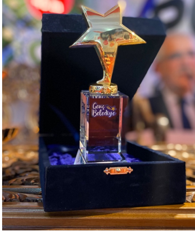
Şekil 2. Genç Belediye Ödülü (2022).

Ekim 2022’de Açık Sahne Sanat Akademisi, Türkiye’nin 150’den fazla büyükşehir ve ilçe belediyesinin katıldığı Tam Bana Göre Festival’de Kültür Sanat kategorisinde “Genç Belediye” ödülü ile takdir edilmiştir.