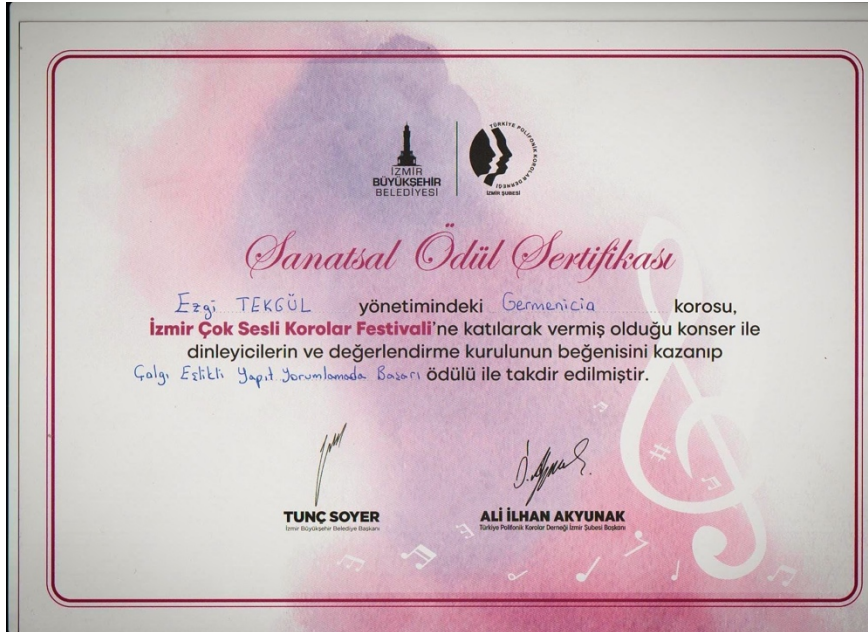
Şekil 1. Sanatsal Ödül Sertifikası (Taratılmış belge).

Açık Sahne Sanat Akademisi 2022 yılında ulusal çapta aldığı ödüller ile “ulusal ve uluslararası sanat platformlarında varlık göstermek” vizyonunu destekler nitelikte faaliyet gösterdiğini ortaya koymuştur. Mayıs 2022 yılında İzmir’de gerçekleşen “İzmir Çoksesli Korolar Festivali”nde jüri tarafından “Çalgı Eşlikli Yapıt Yorumlamada Başarı Ödülü” (Şekil 1) ile takdir edilen Germanicia Çoksesli Korosu, akademinin ulusal düzeydeki ilk ödülünü kente kazandırmakla birlikte Türkiye’de 1996 yılından beri gerçekleştirilen Çoksesli Koro Festivallerine Kahramanmaraş İlinden katılan ilk koro olma özelliğini de taşımaktadır. Bu başarının kentin kültür ve sanat alanında ulusal düzeyde görünürlüğünü arttırdığı söylenebilir.