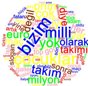
Şekil 2. Entrylerden Oluşan Kelime Bulutu

2020 Avrupa Futbol Şampiyonası'nda Türkiye A Milli Erkek Futbol Takımı'nın maçlarını oynadığı tarihlerde girilen entryleri incelediğimizde futbola ilgili ögeler ve turnuva ile ilgili ifadelerin yer aldığı kelime bulutu Şekil 2'de ortaya çıkmaktadır. Kelime bulutunda milli takım ve futbol ile ilgili kelimelerin yanı sıra maçlardaki mağlubiyetler ile ilgili olumsuz kelimeler yer almaktadır.